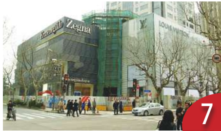
通膨重擊大國 2023 年陷風暴