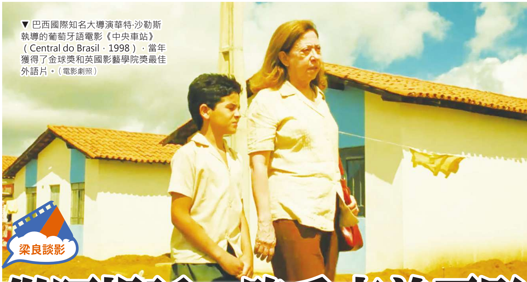
▼巴西國際知名大導演華特·沙勒斯執導的葡萄牙語電影《中央車站》(Central do Brasil, 1998)，當年獲得了金球獎和英國影藝學院獎最佳外語片。(電影劇照)