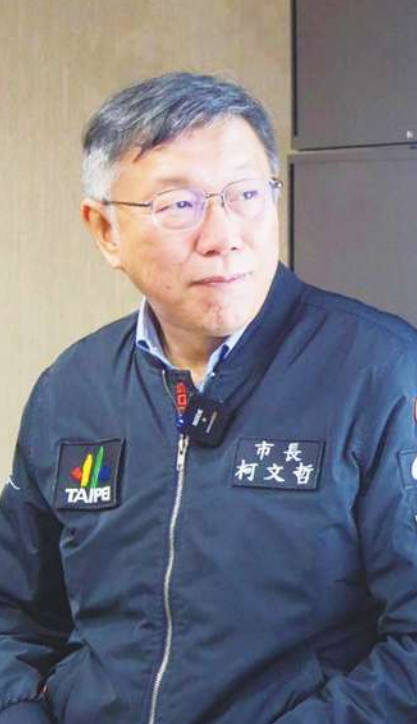
▲ 國民黨主席朱立倫（中）與新北市長侯友宜（右）兩強相爭，考驗誰派系整合的智慧高；學者施正鋒受訪指出，綠營分裂、藍營整合失敗的話，為前台北市長柯文哲（左）最佳機會。（網路截圖）