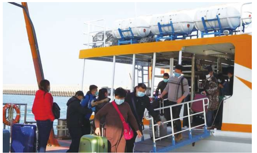
▲小三通將復航，但並未開放台商以此方式返台，引發民眾不滿。圖為 2020 年 2 月 5 日小三通民眾在水頭碼頭下船。

異？王必勝回應說，目前台灣主要的變異株是 BF.5，但中國現在確診、死亡或病毒變異的情況都沒辦法從官方數據得到，疫情相對不透明。