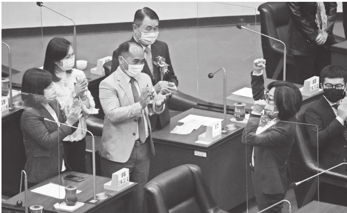
▲議長能決定議案是否排入議程，還掌握編列與動用預算的生殺大權。圖為高雄市議會開票後的歡樂。

背景的市議員來搭配副手，實在相當諷刺。 議長權力無比大 議長位置究竟有何魅力，讓眾多議員不惜與黨中央衝突、帶槍投靠敵對陣營，也要力拼參選到底？熟悉內情的人說，縣市政府想要增加預算、拍賣土地等，都要議會審核同意。而議長就能決定議案是否能夠排入議程，意味著議長實際上有能力卡關特定議案，還掌握編列與動用預算的生殺大權，即使人民選出一個清廉的縣市長，也不得不買議長的帳。 地方政治的關係盤根錯節，利益糾葛嚴重，想要選議長不僅要有錢有勢，還要讓眾地方