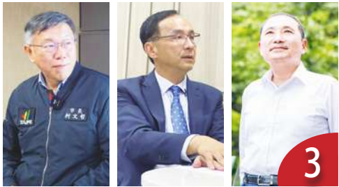
綠失和 藍白整合 兩岸論述關鍵