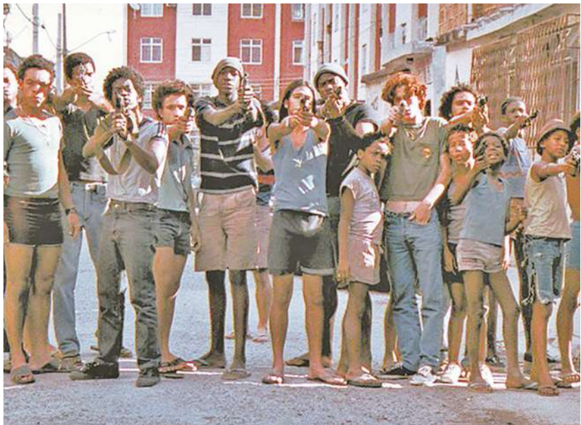
▲跟《中央車站》齊名的巴西電影應屬《無法無天》(City of God, 2002)，本片最近也在台灣重映。(電影劇照)

跟《中央車站》齊名的巴西電影應屬《無法無天》(City of God, 2002)，本片最近也在台灣重映。雖同樣以里約熱內盧的男孩為主角，但兩片風格大異。凱帝·倫德與費南度·梅爾尼合導的《無》片以暴烈手法描述一段在1960年代末至1980年代初發生於一個名為「天主之城」的貧民窟少年幫派鬥爭的真實故事，反映當時的巴西兒童活在充滿暴力和毒品的無法無天環境下，嗜血的故事內容和跳躍式的映像風格，都令人看得觸目驚心，幸好這些故事已成過去。