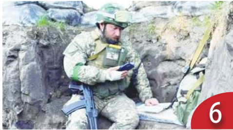
《教育停看聽》這一年的高教大事