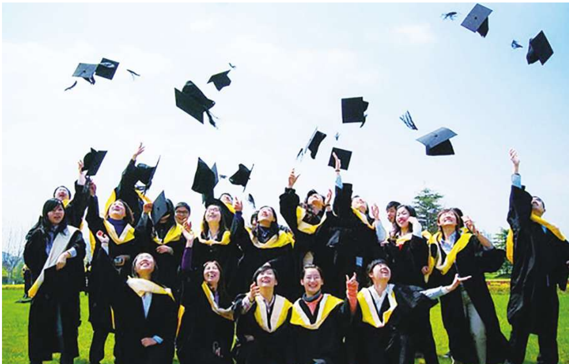
◀ 學術倫理亦如此，豈容學界、政界失格者的狡辯和腐化。(網路截圖)