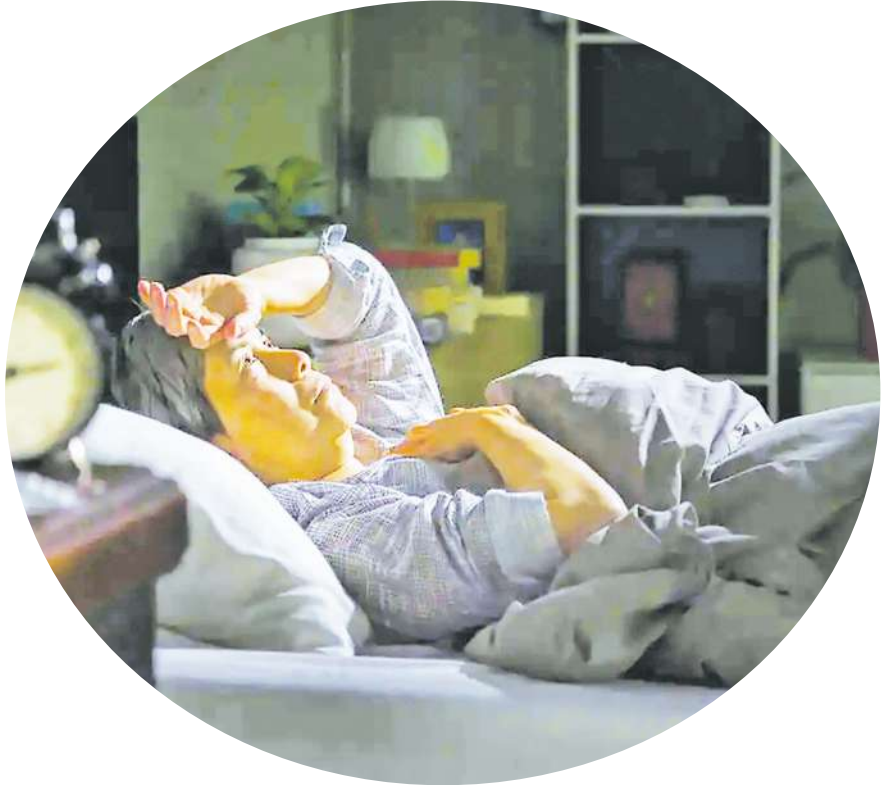
▲研究指出，只要缺少睡眠一個小時，就會扼殺民眾想要幫助別人的情緒，變得更加自私。

此外，約 66% 的失眠患者指出，如果白天感到疲憊，會攝取咖啡因來取得活力，但最終卻產生過量使用咖啡因，反而導致夜間入睡困難。有 25% 的人有在白天小睡一下的習慣，比起不打盹的人，他們需要更長的時間進入睡眠狀態。