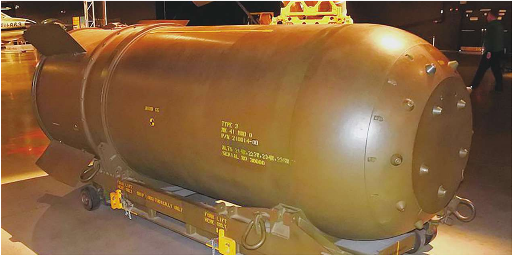
▼美國與俄羅斯兩方的全面核戰是最壞的情況，戰後 3 到 4 年內可能會導致糧食產量下降 90%，造成超過 50 億人死於飢餓。(圖為美國 B41 核彈)

《Daily Express》報導，在美伊核談判中，一位主要核專家聲稱俄羅斯鼓勵伊朗製造核武器，而普丁上個月才罕見訪問伊朗，對該國行動表達支持。國際情勢專家 Andrea 指出，在俄烏戰爭中，擁有核武的俄羅斯對北約介入戰爭更有威懾力，「核武只會使各國更加大膽妄為。」