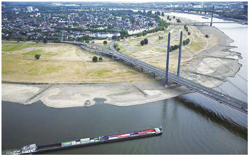
▲ 根據乾旱觀測的數據，目前正在影響著 60% 以上的歐洲地區，是歐洲 500 多年來最嚴重的乾旱狀況。

聯合國估計，目前受到影響的人口有 36 億，到 2050 年，估計每年將有約 57 億人生活在缺水的地區。