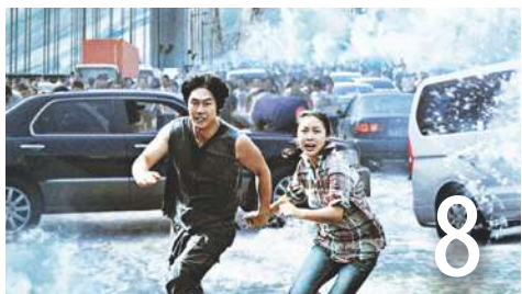
觸目驚心的天災電影 (梁良)