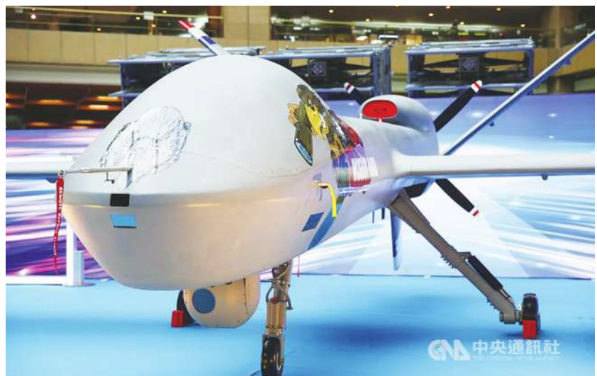
▲ 我國的無人機國家隊 8 月在嘉義成立，可見「台灣其實在各領域都沒有輸入，只是如何做的問題」，盼能結合公部門與私部門，找到屬於台灣無人機產業之路。(中央社)