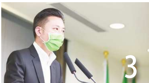
裁定林智堅抄襲藍：請竹科提告