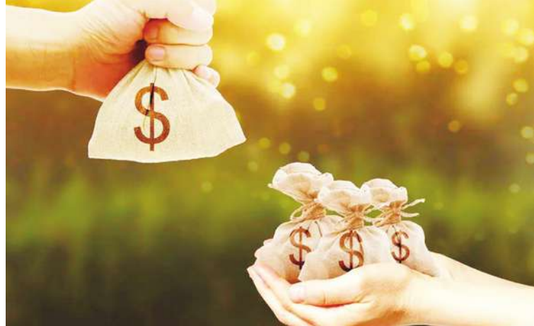
▲ 變賣所有的，分給眾人，就能積財寶在天上，這是不腐餘財最好的方式，因為尚可為自己積財寶在天上。