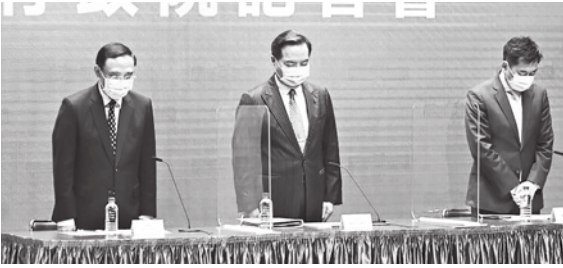
▲殺警案呈現的結構性問題，過去早就有人提醒呼籲改善，但選擇性的立法下，讓悲劇發生。（資料照）

民進黨自2016年政黨輪替上台後，全面掌握立法、行政體系，面對該黨在乎的一例一休、福島核食、萊豬與考監人事，都能以非常好的效率強行通過，但真正關乎