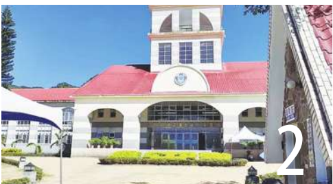
縱虎歸山誘惑多 外役探親應修法