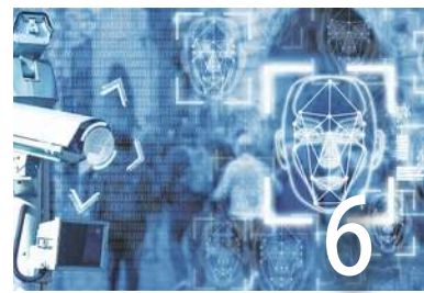
AI，多少罪惡假汝名而行