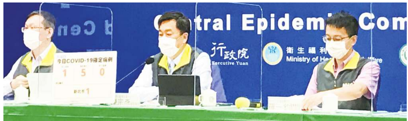
▲ 指揮中心將新增台北疫苗施打站點，並增加 4 萬 5 千劑 BNT 疫苗可預約數。

第 12 輪疫苗預約，包含 BNT、AZ 和莫德納三款疫苗，而其中北市 BNT 疫苗預約爆量，讓指揮中心緊急協助加開站點。台北符合 BNT 疫苗預約資格的人數為超過 14 萬人，但地方設定的地方量卻不足 6 萬人，量能比不到 40%。 發言人莊人祥 19 日表示，指揮中心已協調場地與人力，將於台北新增衛福部一樓、交通部一樓、華山文創園區、中正紀念堂和台灣當代實驗場五個站點，供民眾施打疫苗，共調整增加 4 萬 5 千劑 BNT 疫苗可預約數，呼籲民眾於 20 日中午截止前，儘速完成預約。