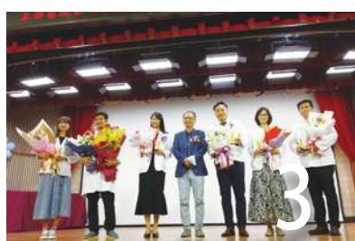
衛福部表揚醫護優良人員