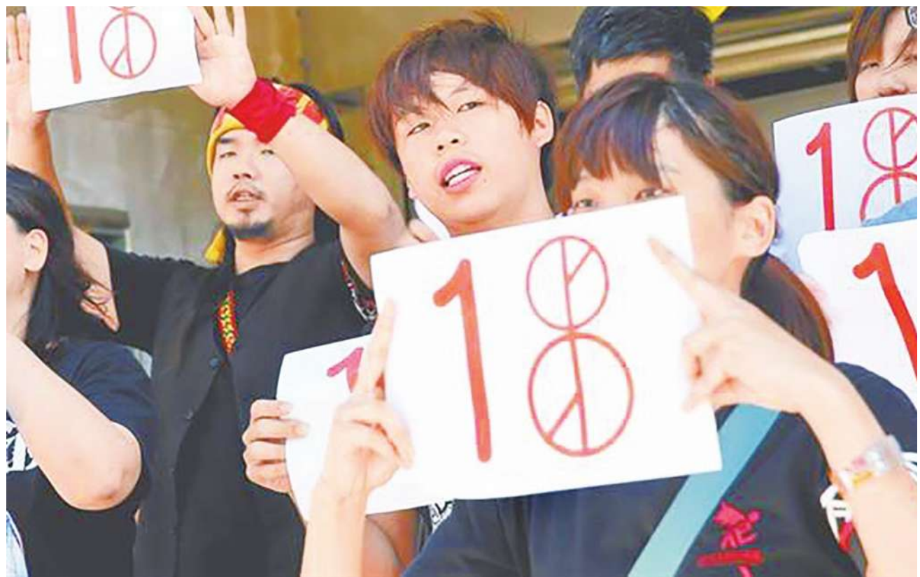
▲ 民法已經將成年年齡調降至 18 歲，甚至未來世界的成年年齡還會下降，因此在憲法中也要保留調整空間。

對此，藍委曾銘宗受訪時表示，憲法的程序修訂涉及憲法穩定性，比修內容還重要，因此最好謹慎考量修改修憲門檻。他說，憲動盟如此主張，也應說明後續想要推動的修憲內容，否則未來公投也不容易過。最後，曾銘宗也說，民進黨應儘速表態是否支持此提案，否則這次提案也只是說說，無太多實質影響。