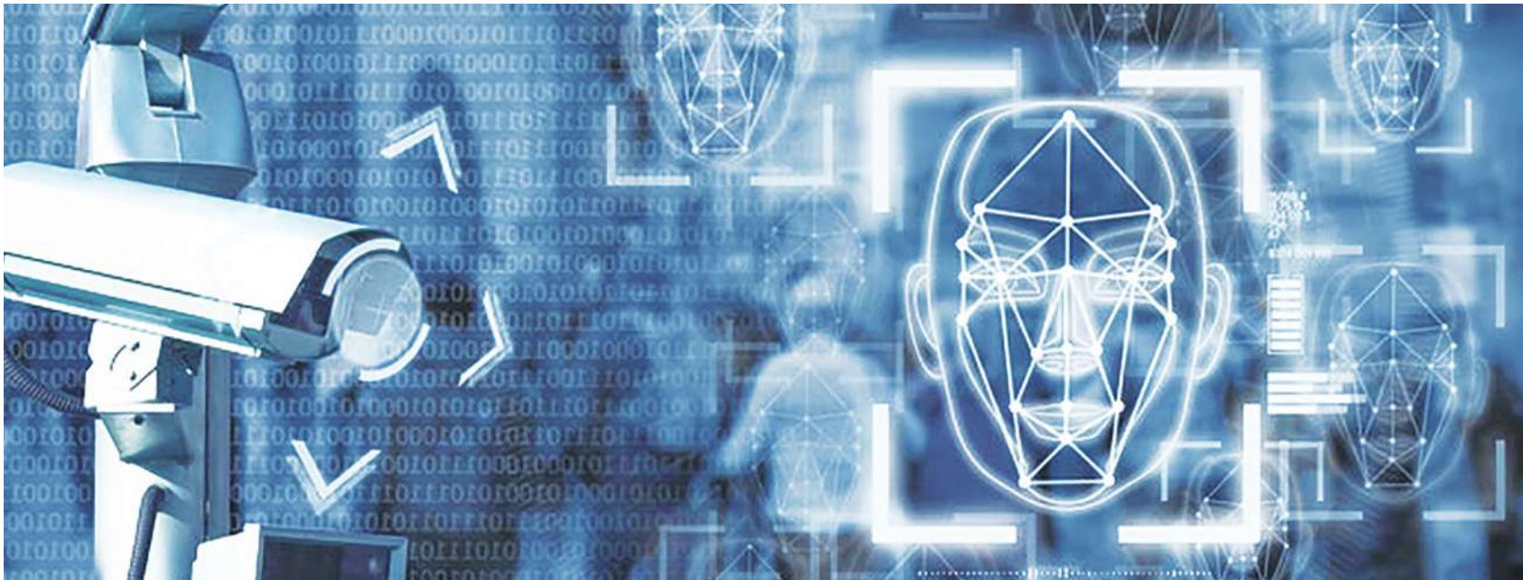
圖) AI 技術現在已滲透到社會的各行各業。(網路截

「自由、自由，多少罪惡假汝之名而行」，這是法國大革命時期羅蘭夫人，在被送上斷頭臺前所留下的名言，在 AI 持續發展和滲透人類生活之際，希望未來不要有「AI、AI，多少罪惡假汝之名而行」的感嘆呀！