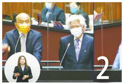
藍籲凍漲油價 蘇：有機制