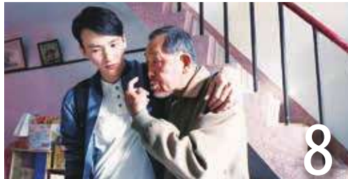
父親節看描繪父親的電影 (梁良)