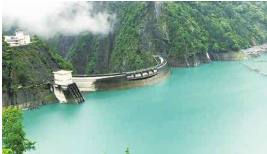
▲連日受熱帶性低氣壓影響降下大雨，位於台中市和平區的德基水庫蓄水率從7日的66.2%，8日一口氣上升到75.31%。(中央社)