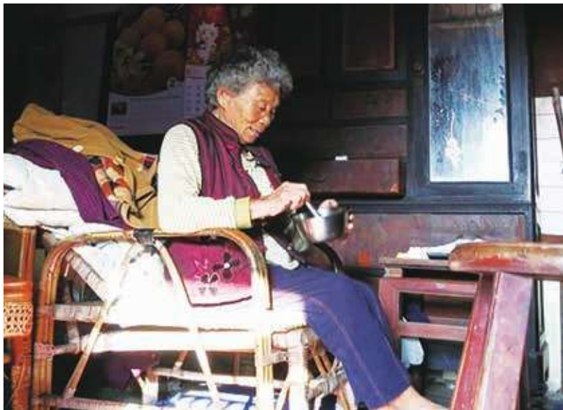
▲ 台灣現在及未來最困難的老人，要數「無子獨居老人」，因為「無子」，無法靠子女度晚年。(網路截圖)

( 本文由本報授權同步刊登於《中時電子報》、《風傳媒》、《優傳媒》與《遠見華人菁英論壇》等網站。 )