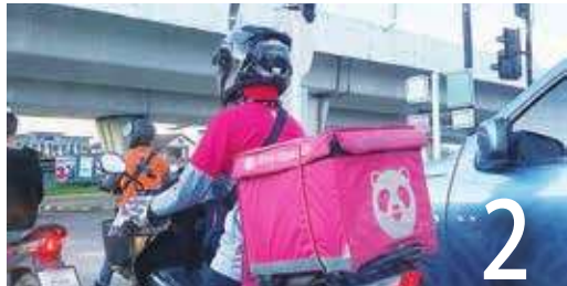
自用車外送無理賠 工會籲納管