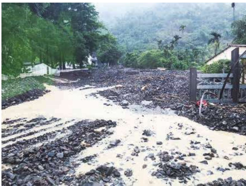
▲邱志偉說，如果沒有前瞻預算規劃這些防洪、滯洪的措施，這次豪大雨的災情恐比現在還要嚴重。圖為高雄台 27 線扇平山莊路段土石崩落、泥流擋道。

由於盧碧颱風與西南氣流共伴影響，中南部近日連日下起了豪大雨，導致許多地方出現淹水的狀況。對此，曾銘宗質疑，蔡政府雖然希望透過前瞻計劃，解決台灣長期的水資源問題，但首先原本 2508 億的預算，到後來刪減到 1939 億，顯示蔡政府並沒有真心重視水環境的治理。他也指出，1939 億預算一路會執行到民國 114 年，至今已經花了 1000 億左右，但卻還是發