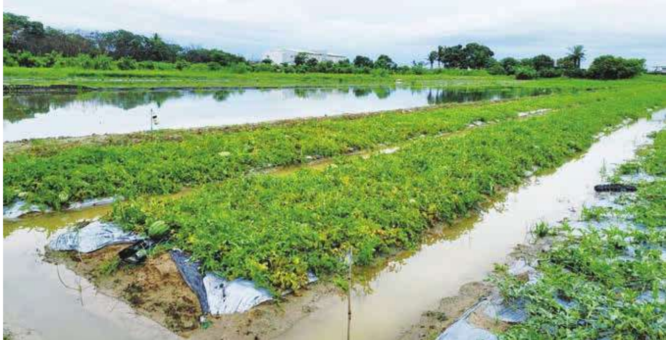
▲曾銘宗質疑，1939 億預算，至今已經花了 1000 億左右，但卻還是發生這樣的水災，讓農民的生計受到傷害、農產品受損。圖為台南近日豪大雨造成多處農田淹水，不少西瓜浸在水中。