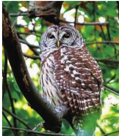
▲美國紐約中央公園相當受歡迎的褐斑林鴉「貝瑞」6日不幸與車輛相撞身亡。

牠甚至有自己的推特和IG帳號。而在中央公園宣佈牠的死訊之後，社群媒體上也湧入大量的粉絲，用照片或影片悼念牠的死亡。有網友就表示，他每天下班之後，總習慣到中央公園看看貝瑞，但昨晚開始只能透過照片回憶，因此非常感謝貝瑞在中央公園的時間，並願牠安息。