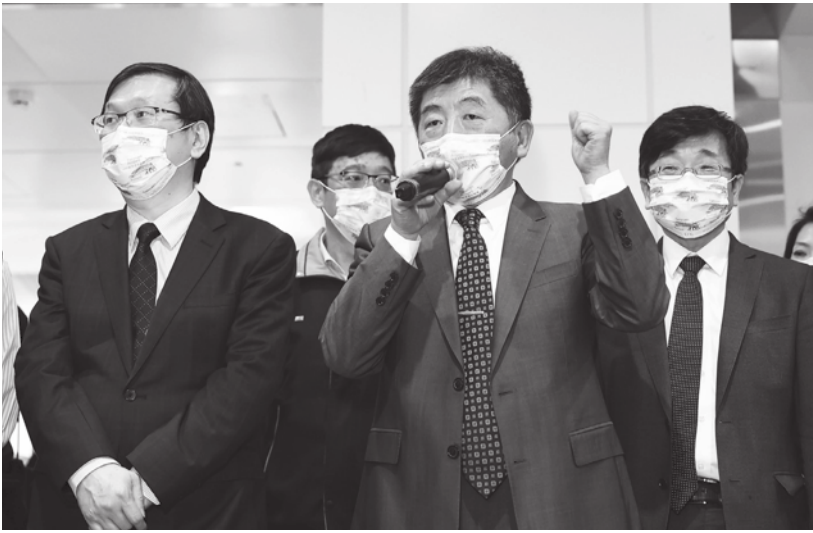
▲ 指揮中心團隊應對數據問題與高端疫苗審查狀況提出合理的解釋。

另一方面，指揮中心在高端疫苗相關議題上也同樣說得不清楚，倉促帶過，讓民眾對指揮中心的信任度再次下滑，尤其日前記者追問高端疫苗檢驗封緘情況、批數、補件資料狀