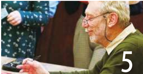
新冠病危者康復 寫童書獻感謝