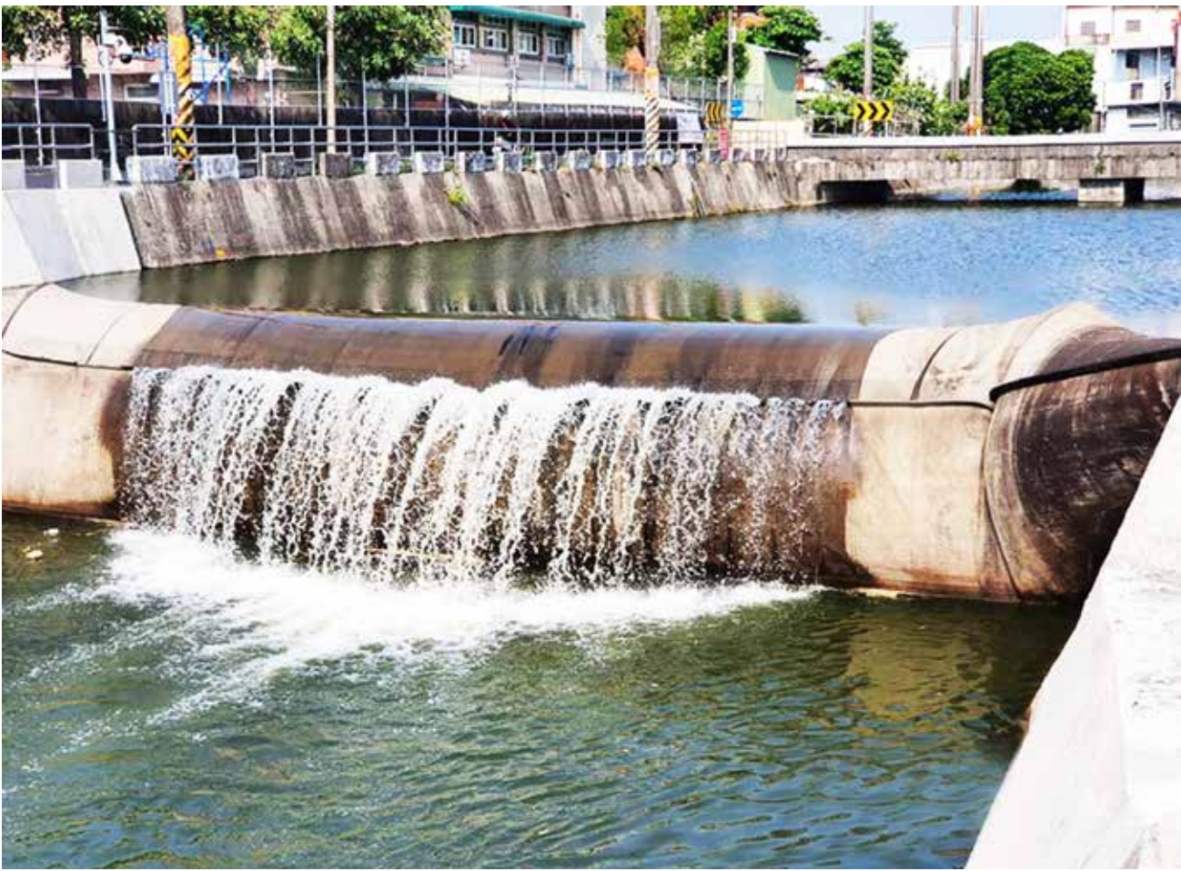
▲屏東農田水利會曾以前瞻建設經費改善屏東市永安圳灌溉排水系統。

立委認為，前瞻計畫中水環境建設預算花了近2千億公帑，仍然是遇大雨則淹，證明中央與地方都未落實執行治水計畫。