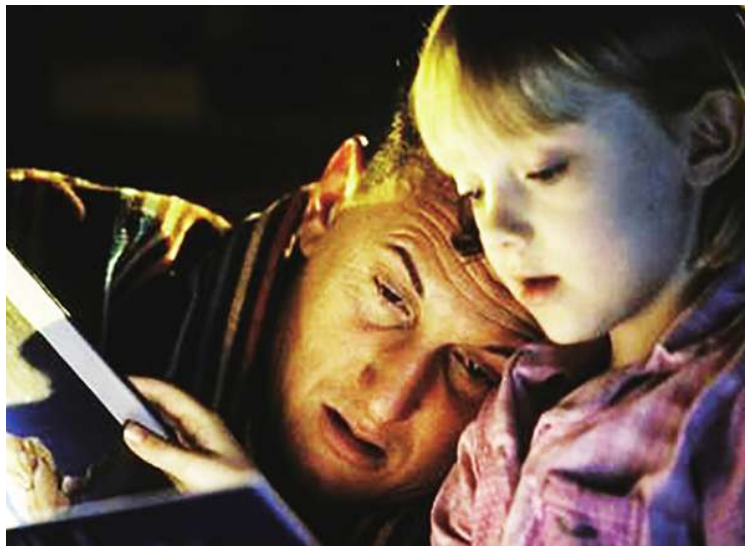
▲西恩·潘主演的《他不笨，他是我爸爸》(I Am Sam)，為弱勢的父親申張了正義。

反過來，我們看看年輕的父親會有什麼人生煩惱吧。一向演喜劇的黑人男星凱文·哈特，在今年推出的新作《為父進行式》(Fatherhood)中飾演新上路的單親爸爸麥特·洛格林，他在興高采烈迎接女兒麥蒂出生不久，便遭遇愛妻在醫院遽逝的打