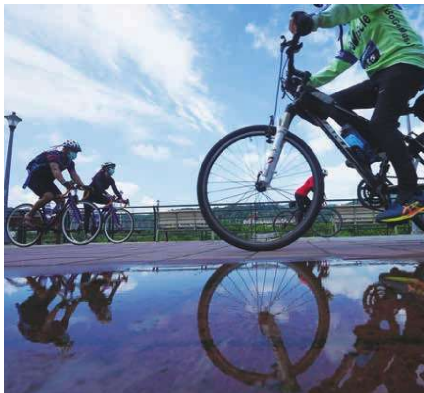
▲氣象達人吳德榮說，北台天氣好轉，午後仍有局部陣雨的機率。圖為台北市民眾 8 日趁著天氣放晴到自行車道騎車運動。

而氣象達人吳德榮則說，8 日「熱帶低壓」在台灣東北方海面恐將再度發展為「輕颱」，仍命名「盧碧」，朝東北快速移動，在 8 日晚間直撲日本九州。其外