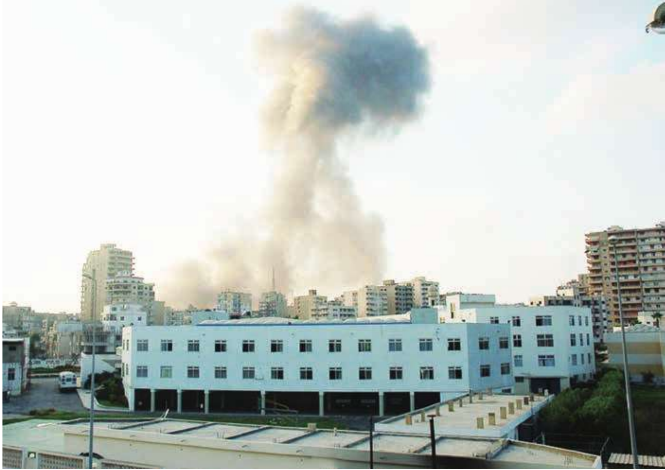
▲ 以色列睽違 15 年後再度襲擊黎巴嫩真主黨。(Photo by M Asser on Flickr under CC 2.0)