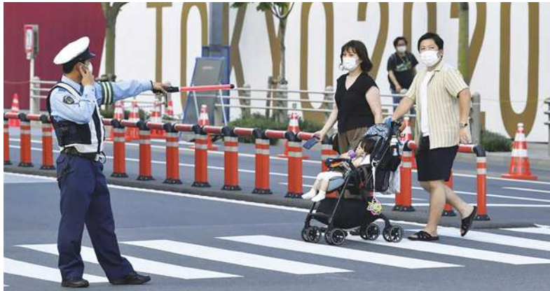
▲ 日本東奧 7 月 23 日開幕表演內容被視為「最高機密」保密到家，開幕當天才會揭曉。另外，為確保東奧及帕運期間安全無虞，日本警察廳總計動員史上最大規模的近 6 萬警力投入維安。