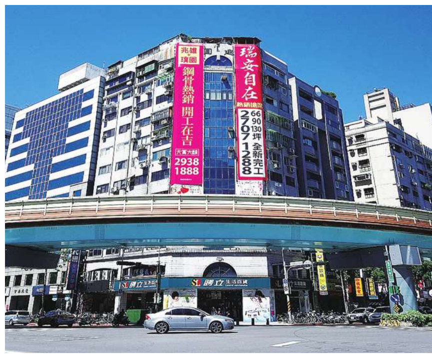
▲ 根據 2021 年 5 月清華安富房價指數，全台房價指數已達到 134.74，較去年同期增長 5.95%。

他呼籲政府不要再迴避問題，應儘速公布近十年的全國家戶總歸戶資料，並將住宅持有數據與