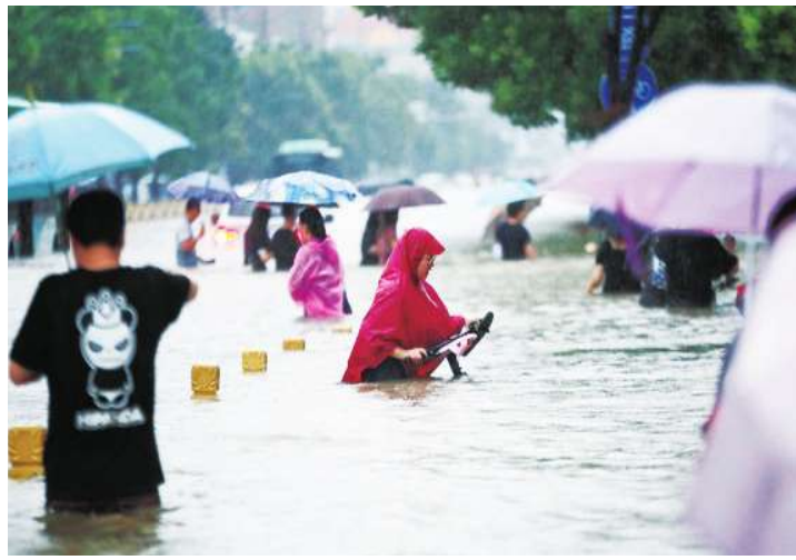
前兩天在中國鄭州發生的超大暴雨，對現在人口稠密集中的都市，實在是瞬間的致命一擊。

靠天吃飯是過去農家的傳統，現在人口更加密集，如果不懂得防微杜漸，天未必給你飯吃，反而可能先要了你的命。