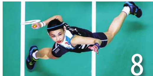
8 多場國手出戰 為東奧加油