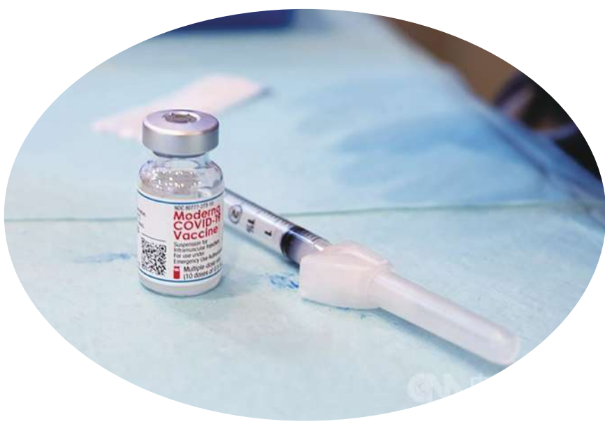
▲政府21日完成今年第四季與明年莫德納疫苗的採購，包括次世代疫苗在內共3600萬劑。(中央社)

▲政府決定僅徵收千度大戶夏季電價，而免徵夏季電價。約有1000萬戶受惠，另外弱勢團體也可免徵夏季電價。(中央社)