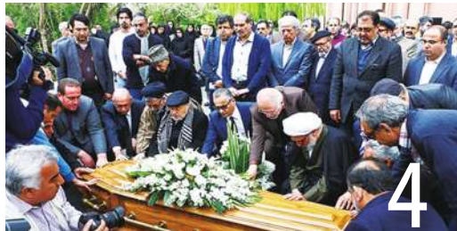
4 疫情如戰爭 美估壽命少活 1 年