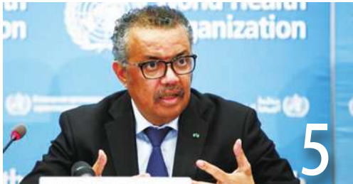
5 世衛：Delta 病毒將成主流