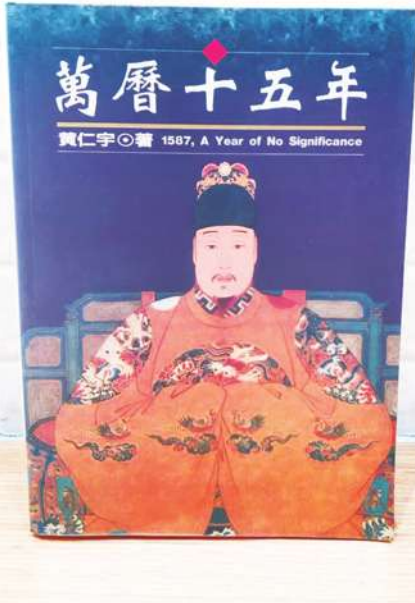
▲「萬曆十五年」以描寫人物特寫，去彰顯個人被拋擲在歷史命定的大格局中的掙扎與無奈。(網路截圖)

面的特定議題」(「黃河青山」第 94 頁)。既然如此，又為什麼會選了一個「時間切片」彰顯自己的史學方法呢？他如何「自圓其說」呢？終究是選了一個帝國末季的切片啊！