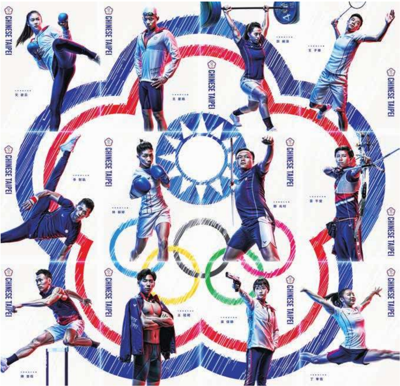
▲ 中華代表團首週就有大量選手登場，其中又以奪牌庫拳擊、射箭女團、羽球女單一姐戴資穎最受期待。(中華奧會臉書)

週日就是射箭女團的淘汰賽，如果發揮良好，最早能在 25 日就見證獎牌落袋，當天一早還有