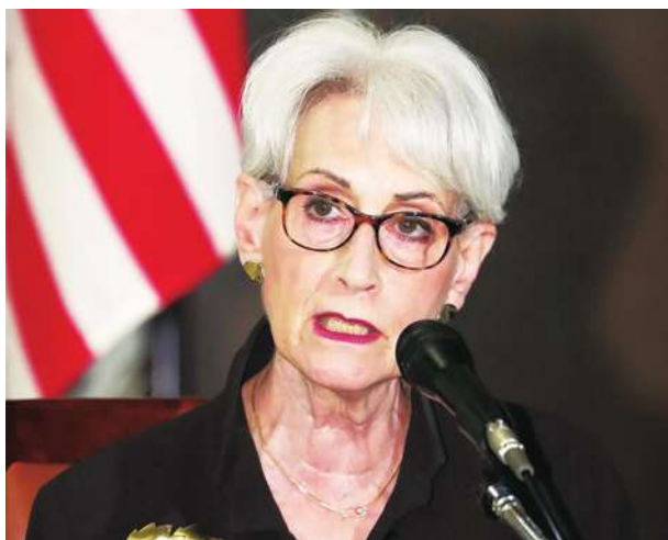
▲ 美國國務院 22 日稍早表示，副國務卿雪蔓將於 7 月 25 日至 26 日訪中，時她將在天津市與中國官員會面。