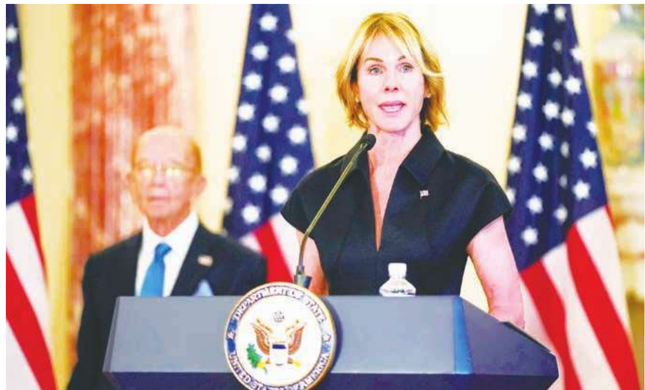
▲克拉夫特（前）為史上首位訪台的現任美國駐聯合國大使，意義重大，時代力量表示樂見台美關係升溫。

時代力量黨團樂見美國駐聯合國大使克拉夫特訪台，並提出參與世衛、聯合國大會，及台灣外長訪華府等期許。