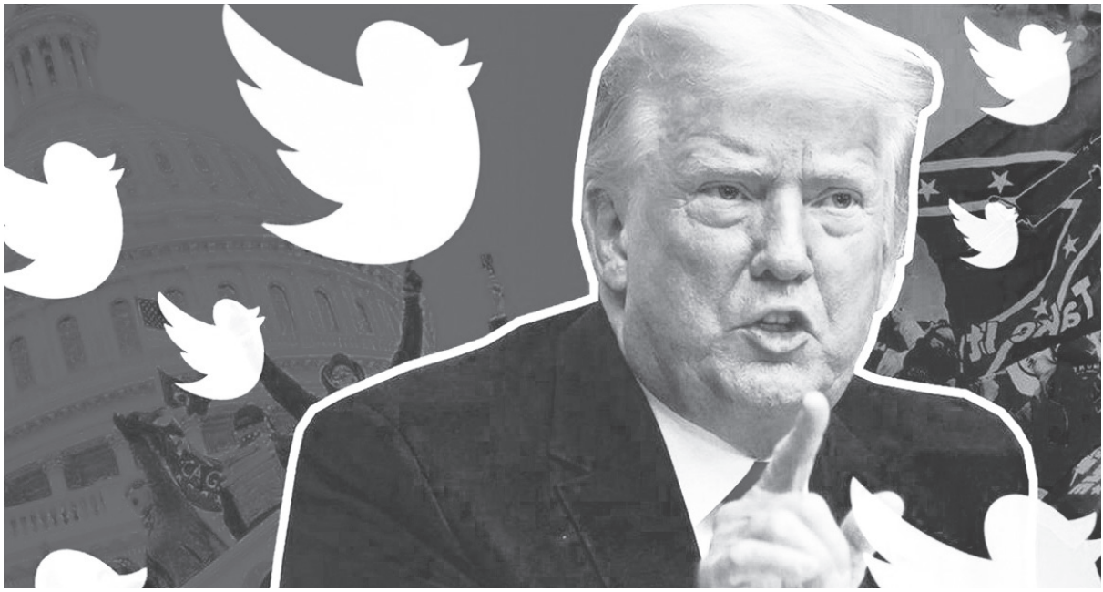
◀再過8天將進行美國總統交接，臉書、推特等科技巨頭深怕6日暴民闖入國會大廈的事件再現，因此紛紛停權川普的帳號。（網路截圖）

波索納洛的兒子還宣布自己的推特帳號將「永久使用」川普的大頭貼，而車臣共和國的領導人卡迪羅夫則表示，先前自己的社群帳號被川普命令推特予以停用，但現在川普自己的社群帳號也被停權，上天終於還他一個公道了。