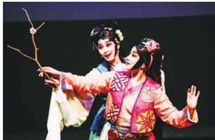
▲台中國家歌劇院春季推出國際藝術節，充滿了想像與穿越。圖為國光劇團的「狐仙」。

【本報特派員劉東泉台中報導】「想像」1 千年後的人類食物樣貌？「想像」人與不同物種間的情愛？台中國家歌劇院今年春季推出的「2021 台灣國際藝術節」(2021NTT-TIFA)，充滿真實之內與真實之外的想像。10 檔節目攜手台灣與國外藝術人才與團體，共同演繹穿越時空與人際界限的可能。