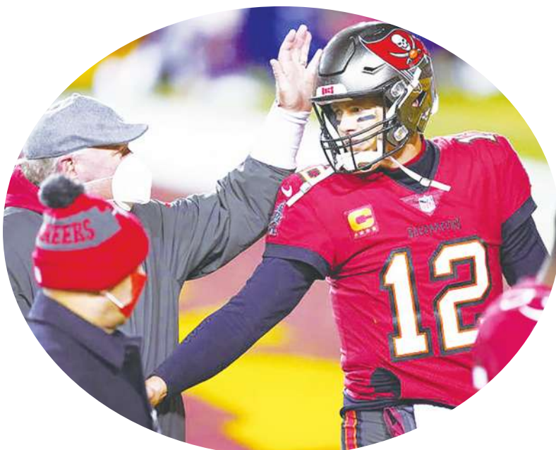
▲海盜明星四分衛布雷迪。