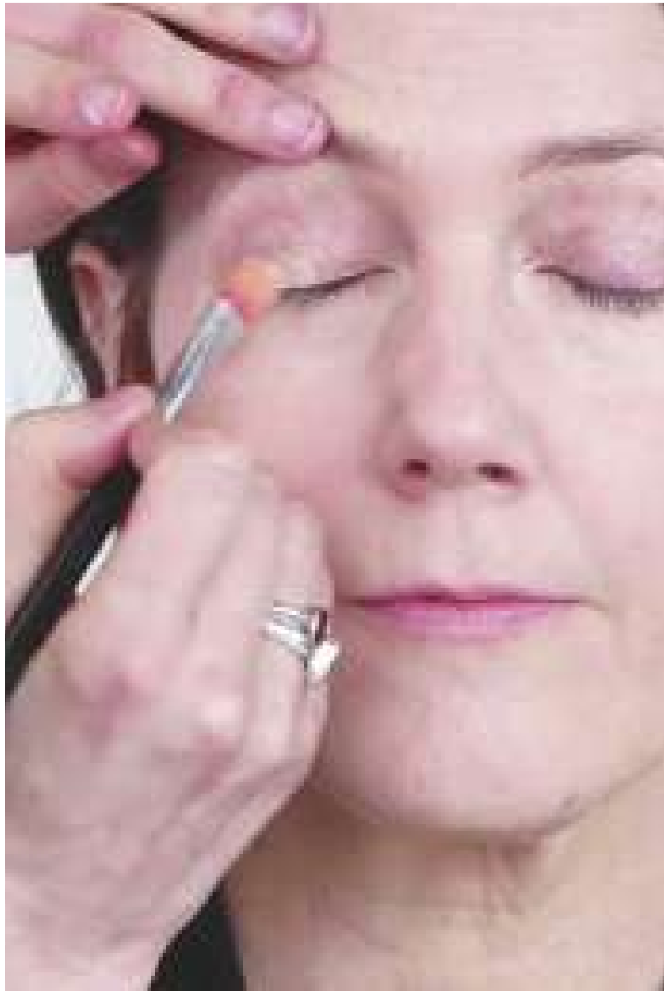
▲衣著顏色也較樸素的大人，不妨大膽使用紫色系或桃紅色系的眼影，這樣可以端莊中帶點俏皮。(網路截圖)