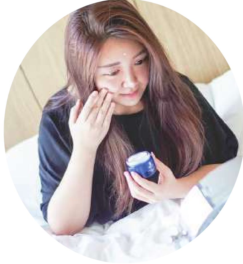
▲晚上就寢前或早晨上妝前多一道按摩步驟，就有助於肌膚拉扯，這是五十歲女性一定不可或缺的保養步驟。(網路截圖)

如何利用假睫毛，讓眼睛變圓，看起來年輕又有精神；如何搭配各種顏色的頭髮及服裝，調整彩妝的顏色。利用這些除了彩妝外的小技巧，使妝扮更有一致