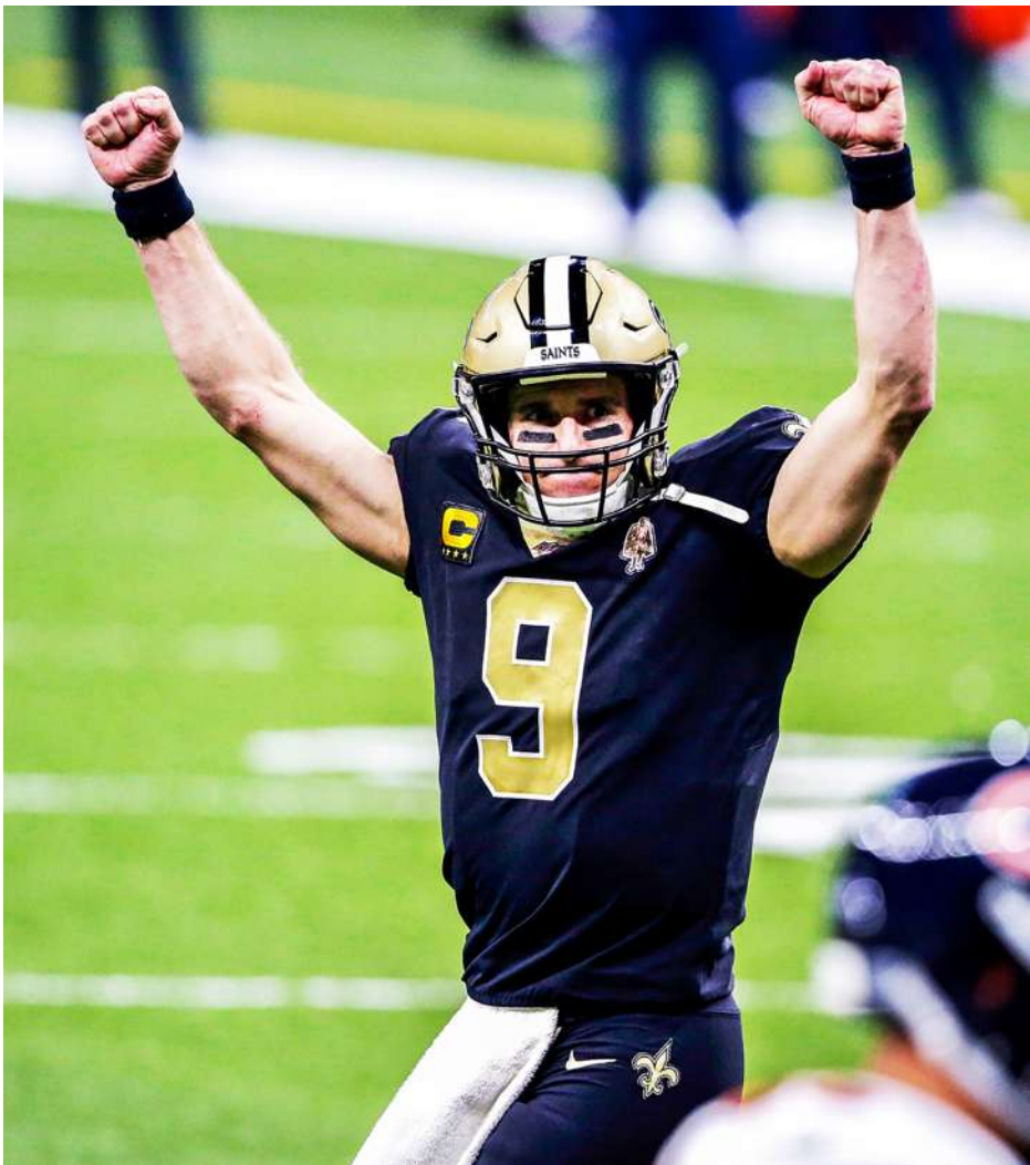
▲NFL 國聯四強賽將迎來聖徒打海盜，由 2 名 NFL 史上傳球數據前二的傳奇四分衛互別苗頭（圖中是布里斯）。

的僅有一冠，近期也有《傳聞》提到，這位 42 歲老將高機率在季末掛靴，布里斯生涯替聖徒在季賽拿到誇張的 172 勝（僅 114 敗），聖徒大軍肯定會想讓這位傳奇老大哥不留遺憾的離開賽場，週末的對戰預期將十分精彩。