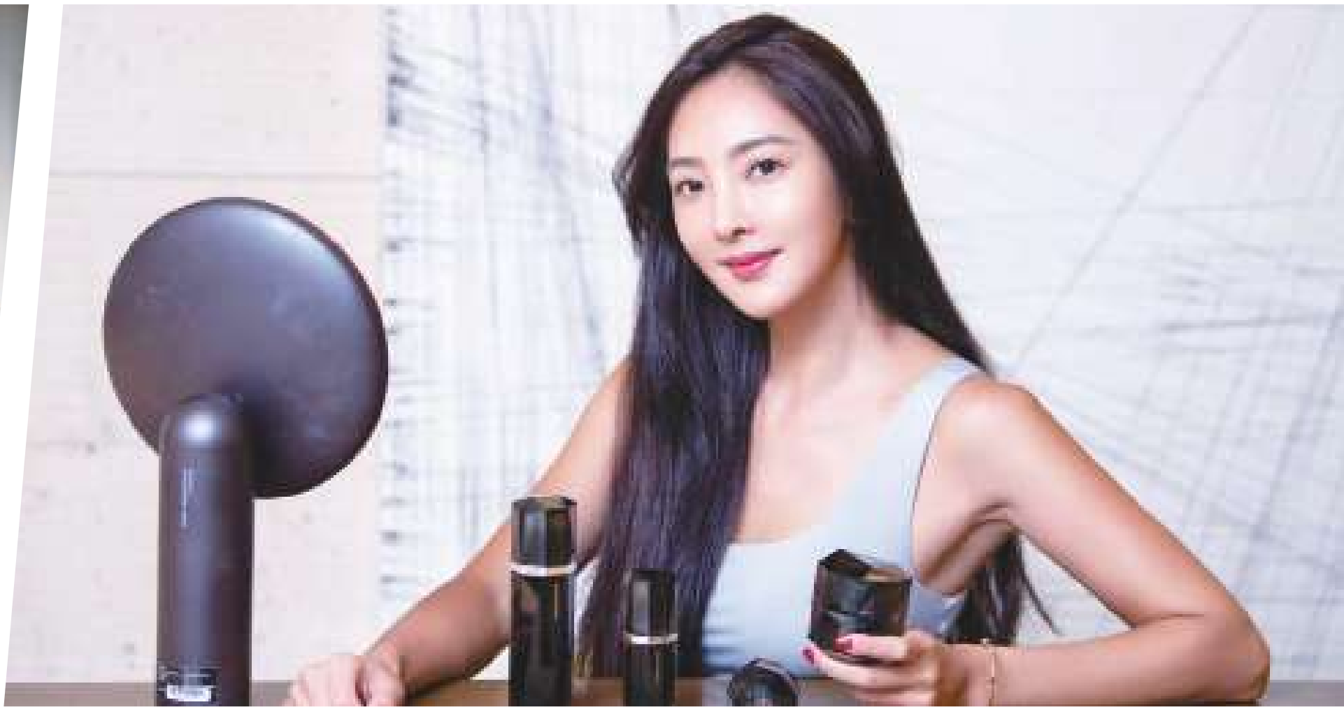
▲到了一定年齡後，捨棄不需要的瓶瓶罐罐，化妝只需簡單質感不用太重。(網路截圖)

「年過 50，還美的這麼不科學！」「關掉濾鏡，好氣色依舊扛得住！」凍齡女神們為何能一直容光煥發？