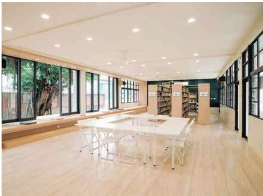
▲台南市西港國中視聽教室後來改造成清新明亮的閱讀區。

25 所校園改造案例中，以台南市西港國中為例，視聽教室閒置已久，改造團隊以白色為基調，搭配淺色的木質元素，把教室改造成明亮舒適的閱讀環境；