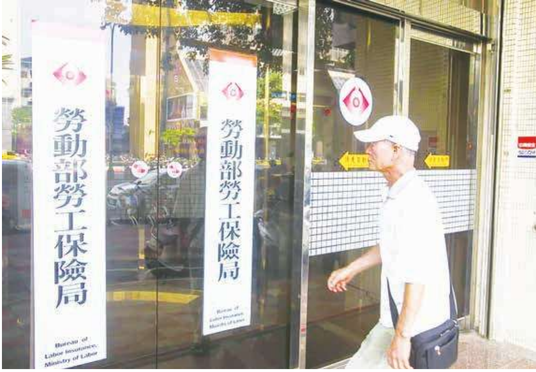
▲ 寶佳集團涉入勞動基金炒股案，成為 2020 年攪動資本市場的一大案。