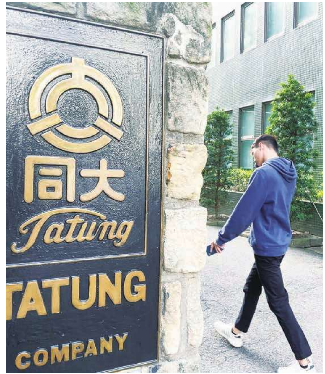
▲ 大家都知道大同公司近年來的經營慘澹，直到最近換了董事才有些起色。