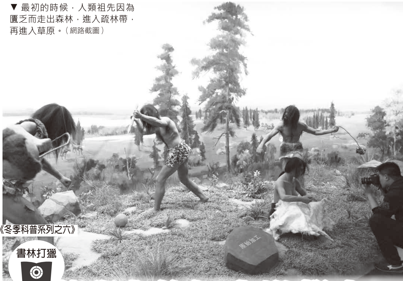
《冬季科普系列之六》

▼ 最初的時候，人類祖先因為匱乏而走出森林，進入疏林帶，再進入草原。(網路截圖)