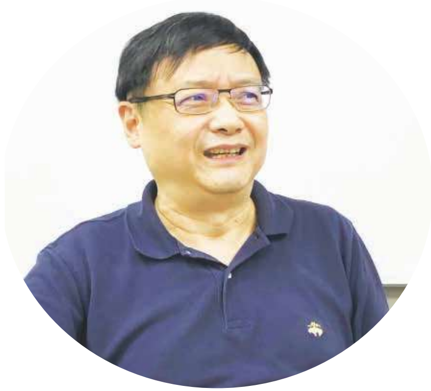
龔天行 前富邦金控總經理、台大管院兼任教授