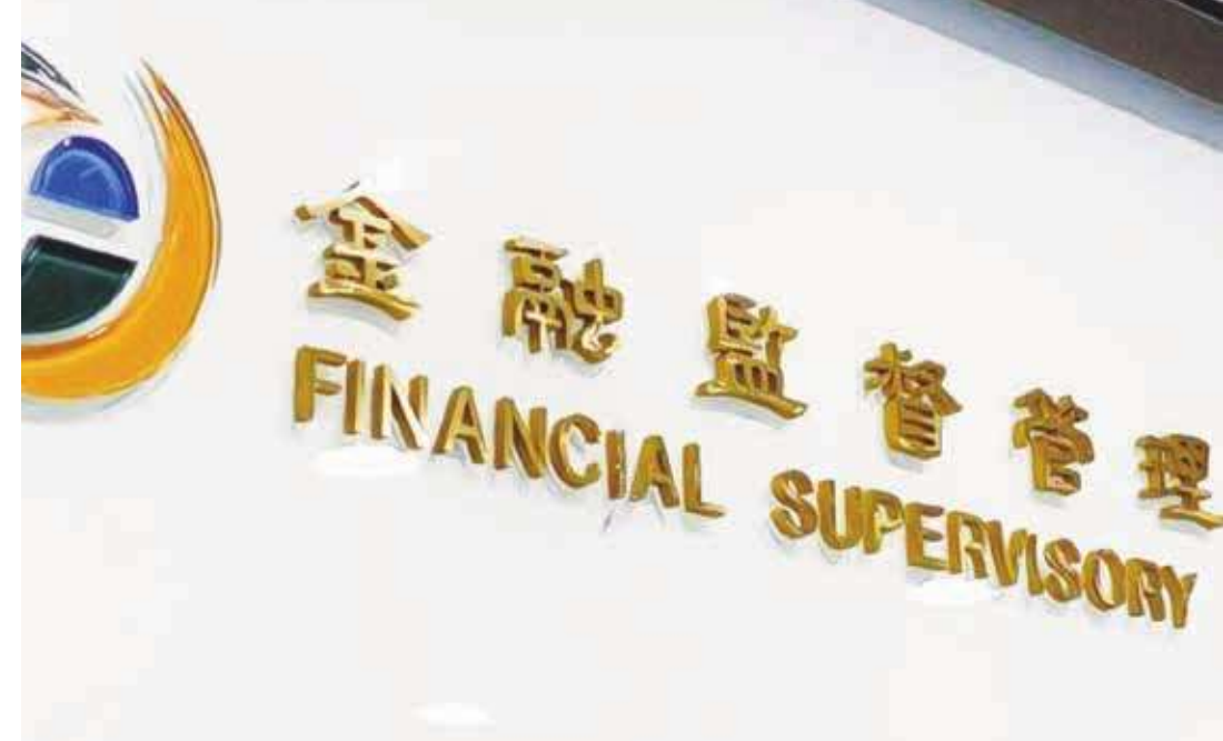
▲ 與其依賴主管機關事後的監督，不如要求企業自律。寶佳有雄厚的資金，有非常強的人才，裡頭甚至過去都是政府的政務官，應該有比較高的自我要求。