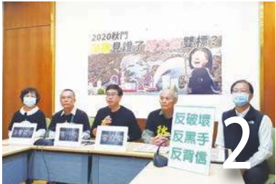
譴責環保倒退 秋門淨零碳