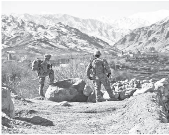
▲利比亞近日終於達成明確停戰協議，內戰雙方必須要在 1 年半以內進行大選。

根據《半島電視台》報導，聯合國近日宣布，與利比亞內戰雙方共 75 人的代表在突尼西亞首都突尼斯，經過 3 天的談判達成共識，雙方必須要在 18 個月內