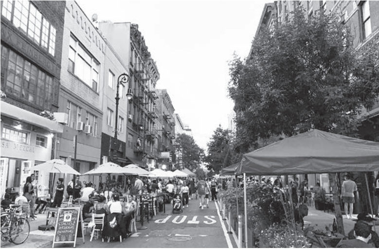
▲紐約疫情再惡化，州長古莫美東時間 11 日下令，餐廳、酒吧、健身房每晚最遲 10 時必須打烊。