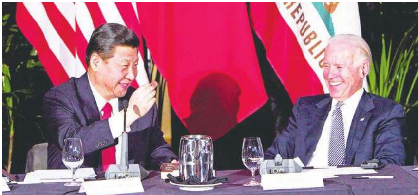
▲中國領導人習近平(左)對於拜登(右)當選總統，顯得更加謹慎，可能與傳統華人喜歡「聽其言，觀其行」習慣有關。

伊朗總統魯哈尼對拜登當選總統看法很「政治」，他說，美國應藉機彌補過去的錯誤，尊重國