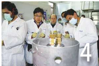
伊朗鈾超標 難與美核協議