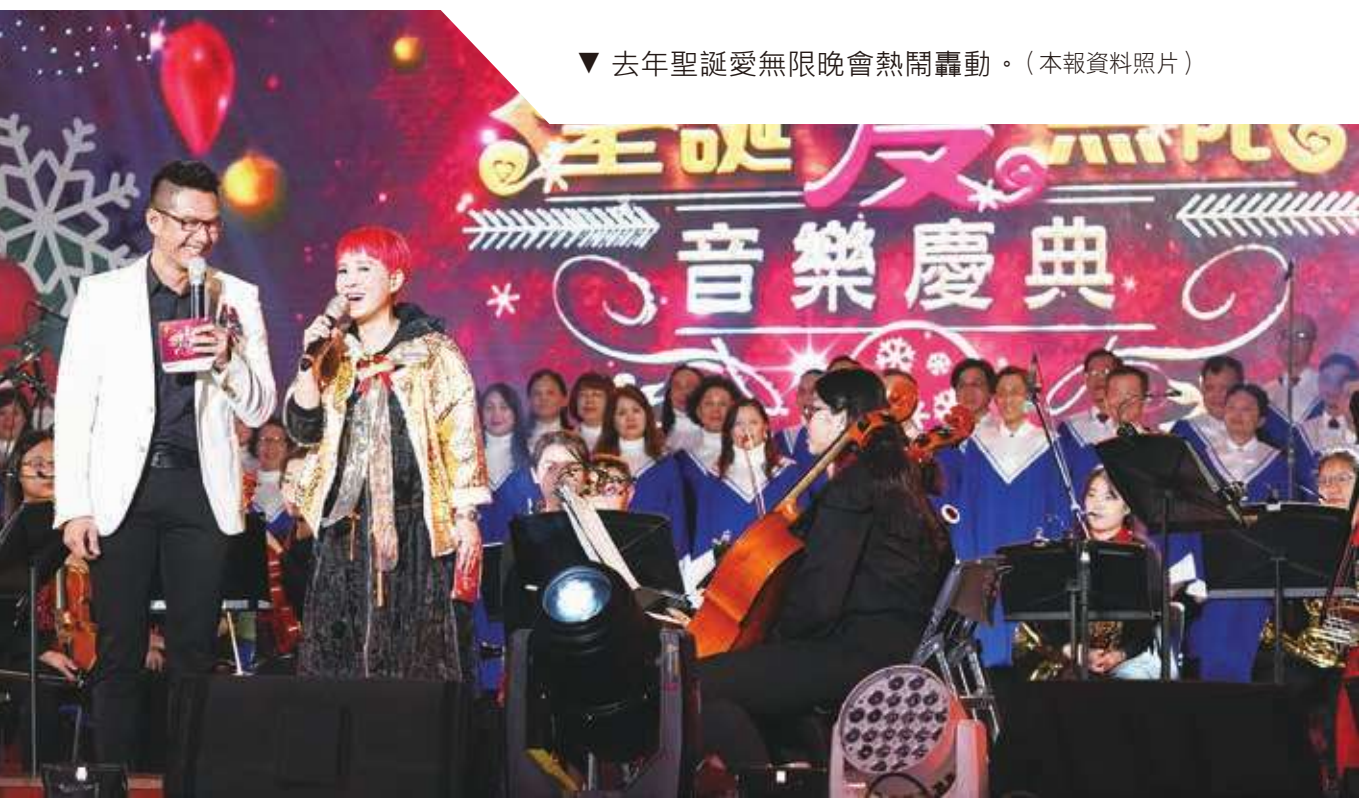
▼ 去年聖誕愛無限晚會熱鬧轟動。