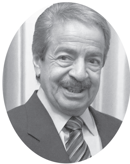
▲巴林總理哈里發於 11 日早晨逝世，他擔任巴林總理將近 50 年，是現今世界上任期最長的總理之一。

哈里發家族從 1783 年開始就治理巴林。1971 年，巴林脫離大英帝國獨立時，哈里發就是總理。在他任內，巴林的經濟穩定成長，與美國關係良好，美國海軍第五艦隊的波斯灣基地就設在