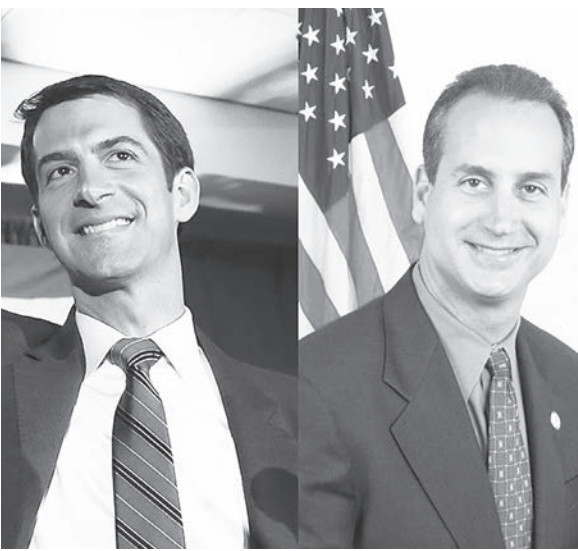
◀美國國會多數選區已完成開票，目前確定至少有 131 位友台議員連任成功，包括共和黨參議員柯頓（左），及眾院「台灣連線」共同主席狄亞士巴拉特（右）。