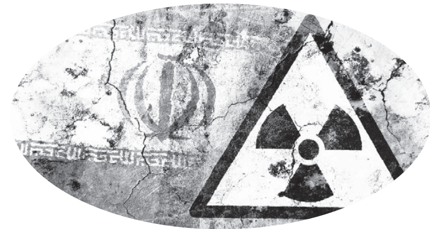
▲國際原子能機構：伊朗現有濃縮鈾儲備較協議高出 10 倍（網路截圖）

2015 年，伊朗與歐盟、美國、俄國與中國等國家簽署了《伊朗核問題全面協定（JCPOA）》，以換取美國等國家解除經濟制裁，但 2018 年川普政府認為伊