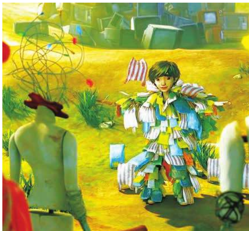
▲ 廢棄之城的動畫劇照。

但其實得到創投之前就開始製作，因為金馬創投不能什麼東西都沒準備，所以前 1 年就開始做，還曾經跑到香港、法國談合作可能性；「若把寫劇本的時間