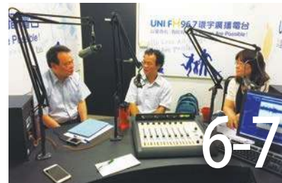
拜登綠新政 如何見賢思齊