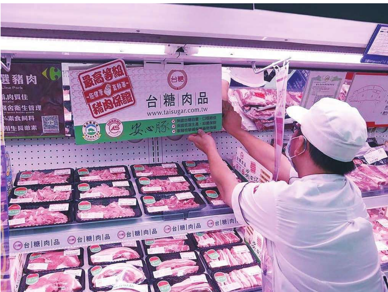
▲ 政府目前僅鼓勵標示台灣豬，而且市場查核人力根本不夠，在野立委建議政府強制標示豬肉產地。

開放萊豬的漏洞百出，在野黨立委針對萊豬的標示可能作假，且稽查人力少、加工肉品難納管等面向提出質疑。