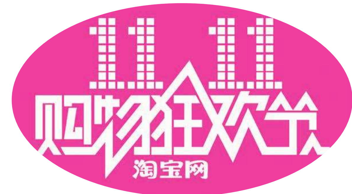
▲ 往年利潤豐厚的中國雙 11 購物狂歡節，今年卻因為被政府盯上而蒙上陰影。