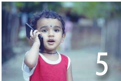
因疫失學 數位教育印盛