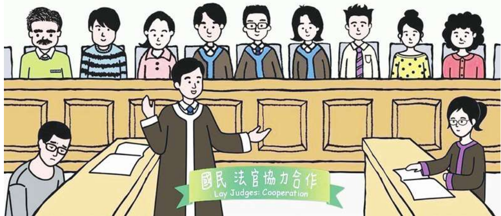
▲ 為讓國民熟悉新制度，司法院編列 1 億 2000 萬做推廣費用。根據司法院資料，將用 2000 萬來開發手遊、桌遊、AR、VR 遊戲等。

不過，這個議題蠻值得作一個「之前／之後」的行為主義準實驗來看看其交叉的影響是甚麼。