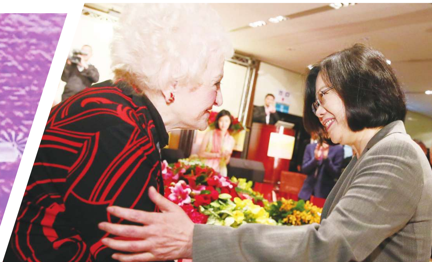
◀ 蔡英文總統（右）出席第16屆國家祈禱早餐會時，向彭蒙惠女士（左）問好。