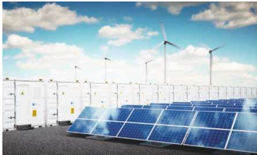
▲投資客現在不只重視企業的商業潛力，也重視投資標的公司是否有致力於環保。(網路截圖)

《彭博》報導，現在的投資客和顧客越來越在乎企業有無做到社會回饋，在環保減碳、種族等議題上有沒有努力。日前在澳洲，就有一個16位投資客組成的組織「氣候聯盟」，狹帶6090多億美金的資金，專門投入促進清潔能源和減碳技術的研發。