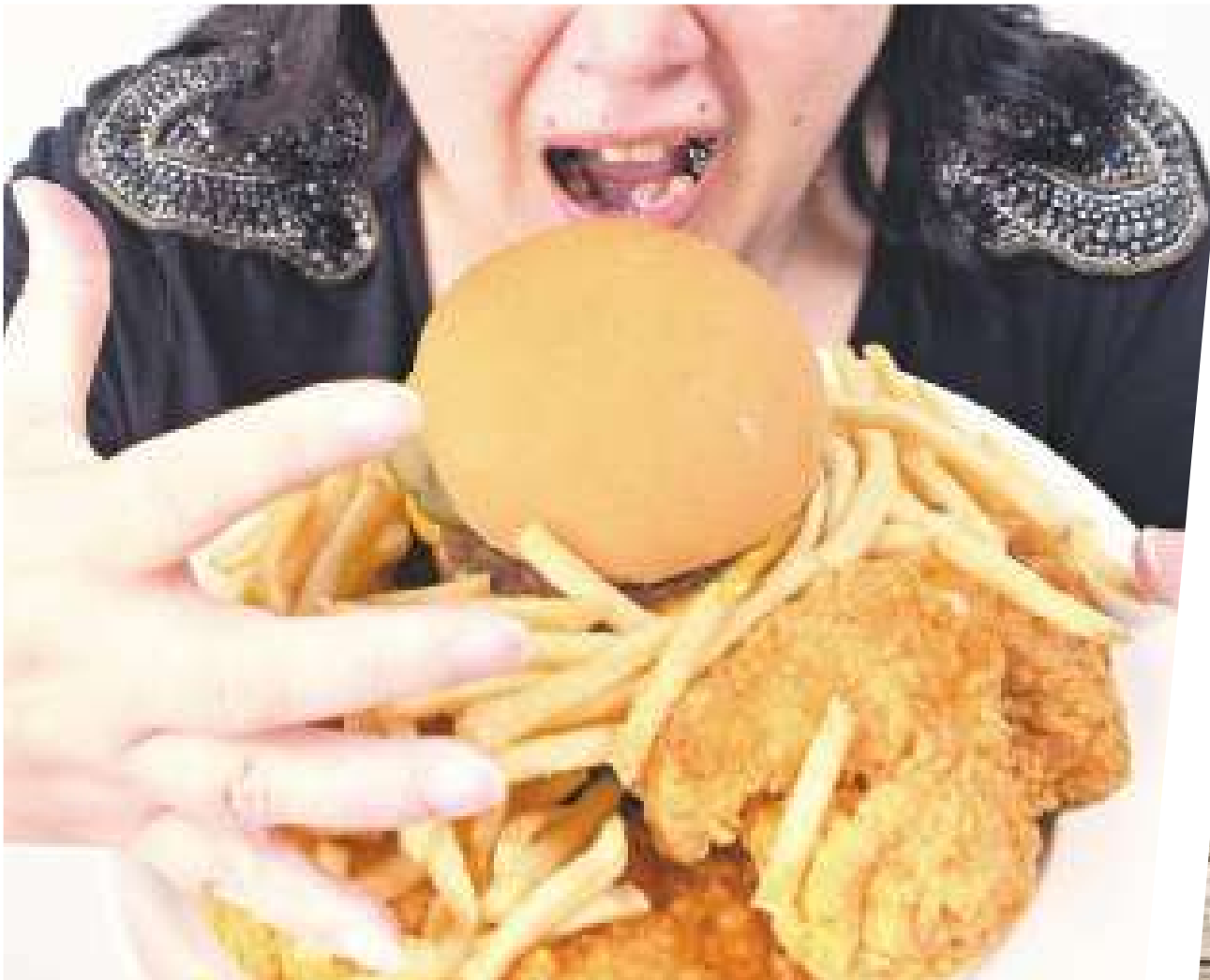
▲現代人習慣大量攝取高脂、高熱量的食物，使得腸胃天天飽受傷害，也囤積很多脂肪。(網路截圖)