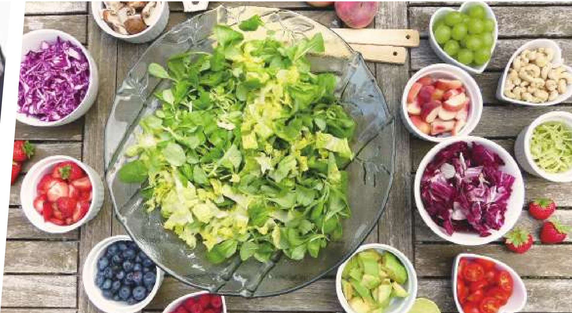
▲如何挑選食物，也是節食中的重要課題。