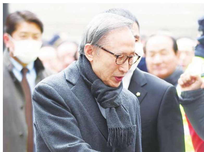
▲南韓前總統李明博(圖)被檢方指控貪污並收受三星公司賄賂，首爾最高法院最終維持二審原判處有期徒刑17年、罰金130億韓元。