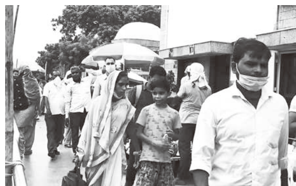
▲印度是全球疫情第 2 嚴重的國家，確診數累計超過 800 萬例，當局預期在排燈節 (Diwali) 過後，境內確診病例更會激增。