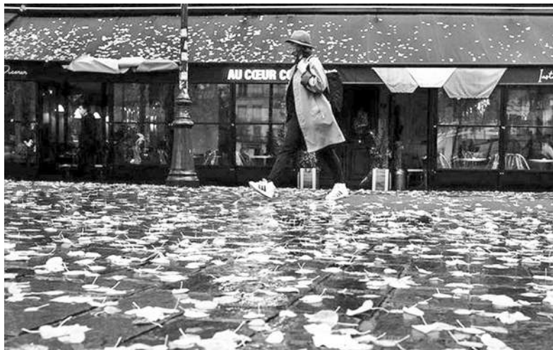
▲法國第二波疫情發展超出預期，總統馬克宏晚間宣布全國 30 日凌晨 0 時起封城，將至少持續至 12 月 1 日。