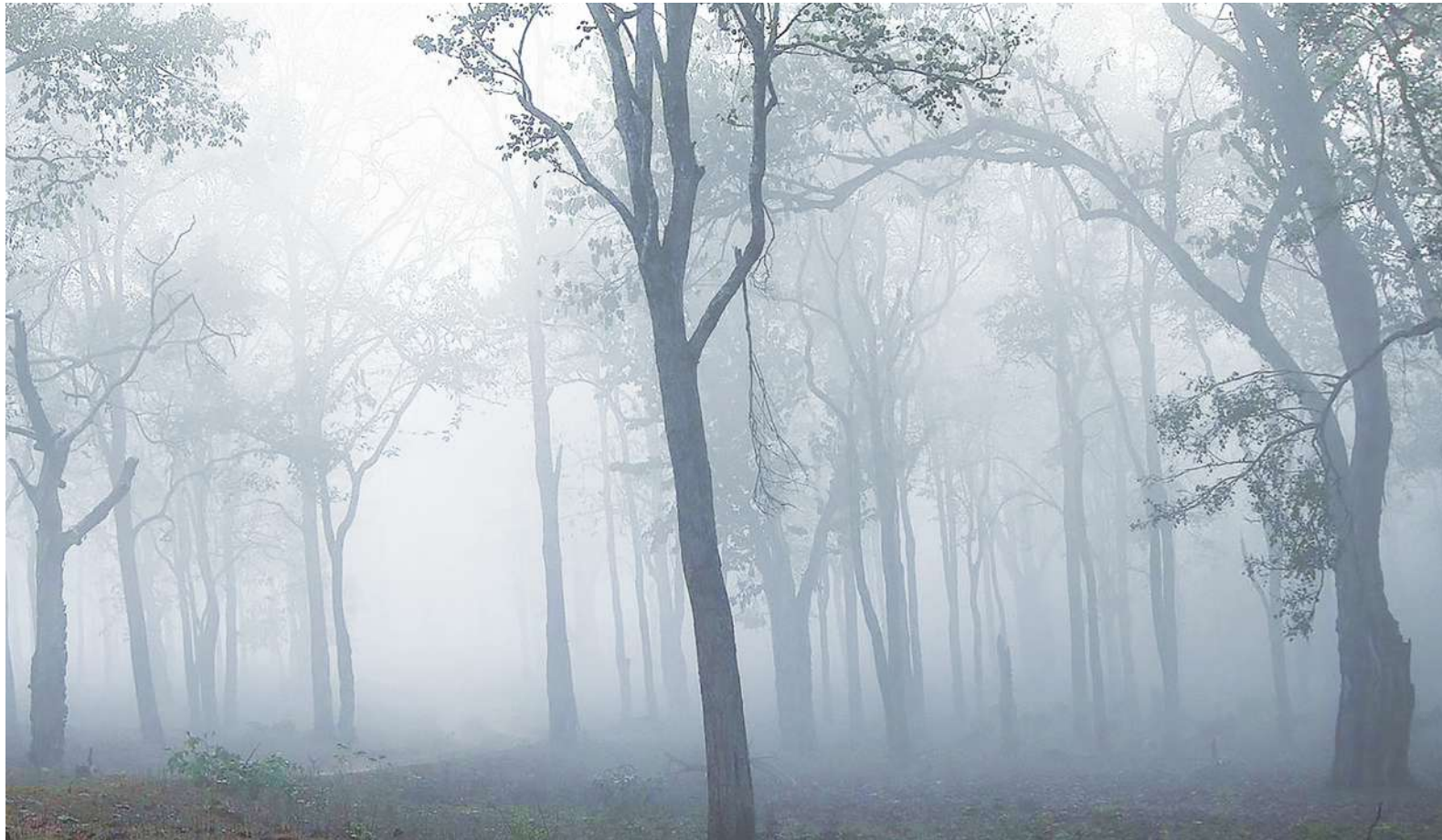
◀中國的植林政策比外界預期減碳的效果還要好，不過專家也提醒氣候變遷下要小心森林大火反過來使更多碳排放至大氣。