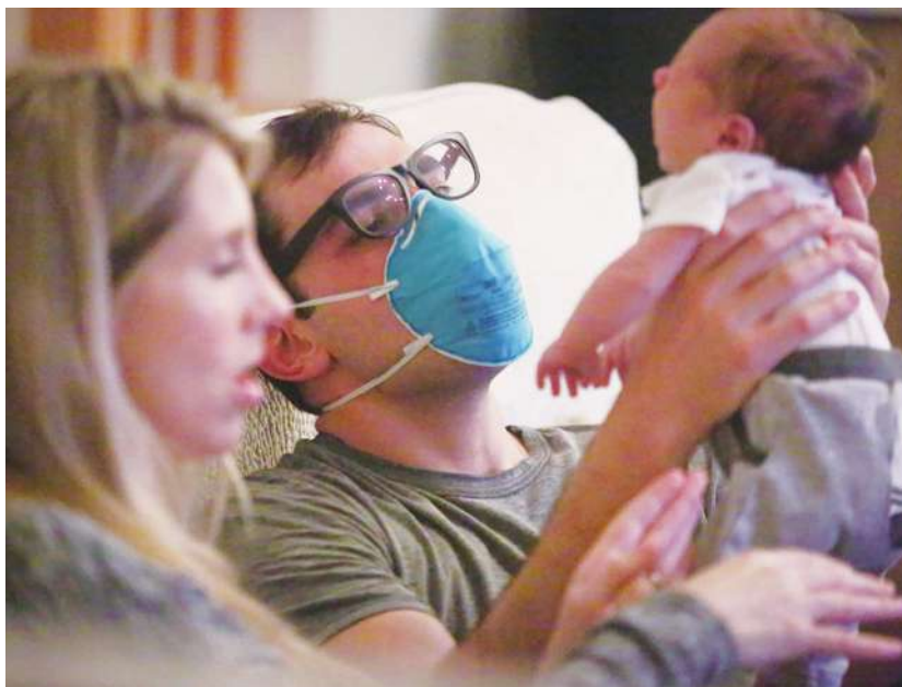
▲疫情下的嬰兒潮，在富裕國家可能不升反減。（網路截圖）

工作的民眾表示，疫情間年輕人無法購買避孕用具，只能依靠聯合國與當地人權團體四處發放免費避孕套，他甚至有多名朋友還在大學就學，就在疫情中意外懷孕，「沒有工作，也無處可去，所以大家都有大把時間。」