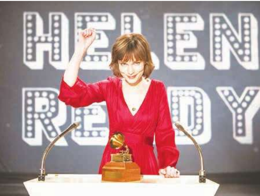
▲海倫瑞蒂在1972年成為第一位在葛萊美獎得到最佳女歌手獎的澳洲歌手，上台領獎的致謝辭轟動一時。