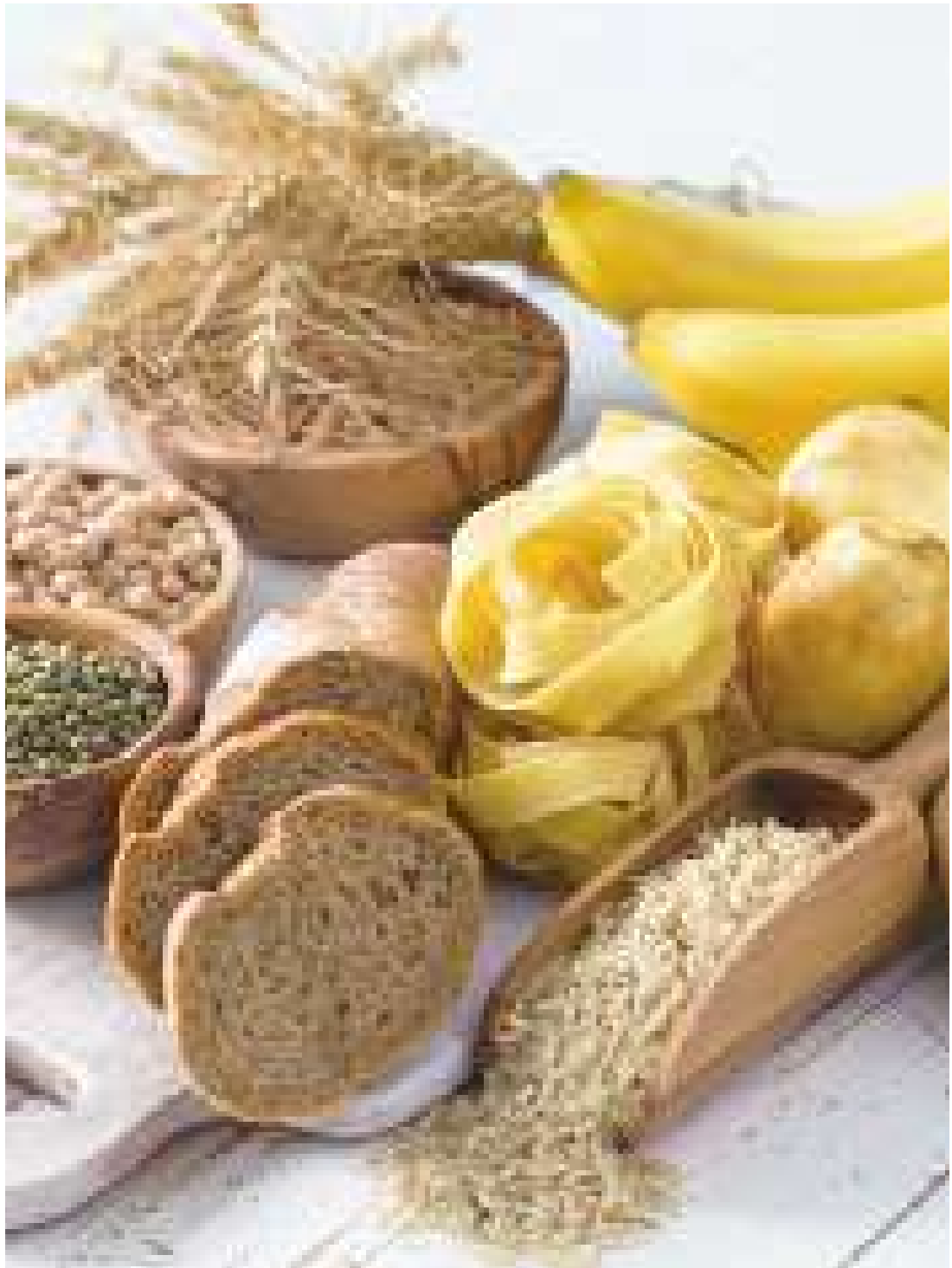
▲攝取「醃類」是斷食第二天的大忌，應盡量避免。(網路截圖)