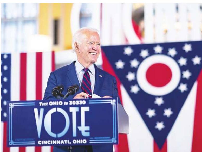
▲民主黨總統候選人拜登在中西部兩關鍵州人氣持續勝過總統川普，民調顯示，拜登在密西根州握有微幅領先，在威斯康辛州則享有明顯優勢。