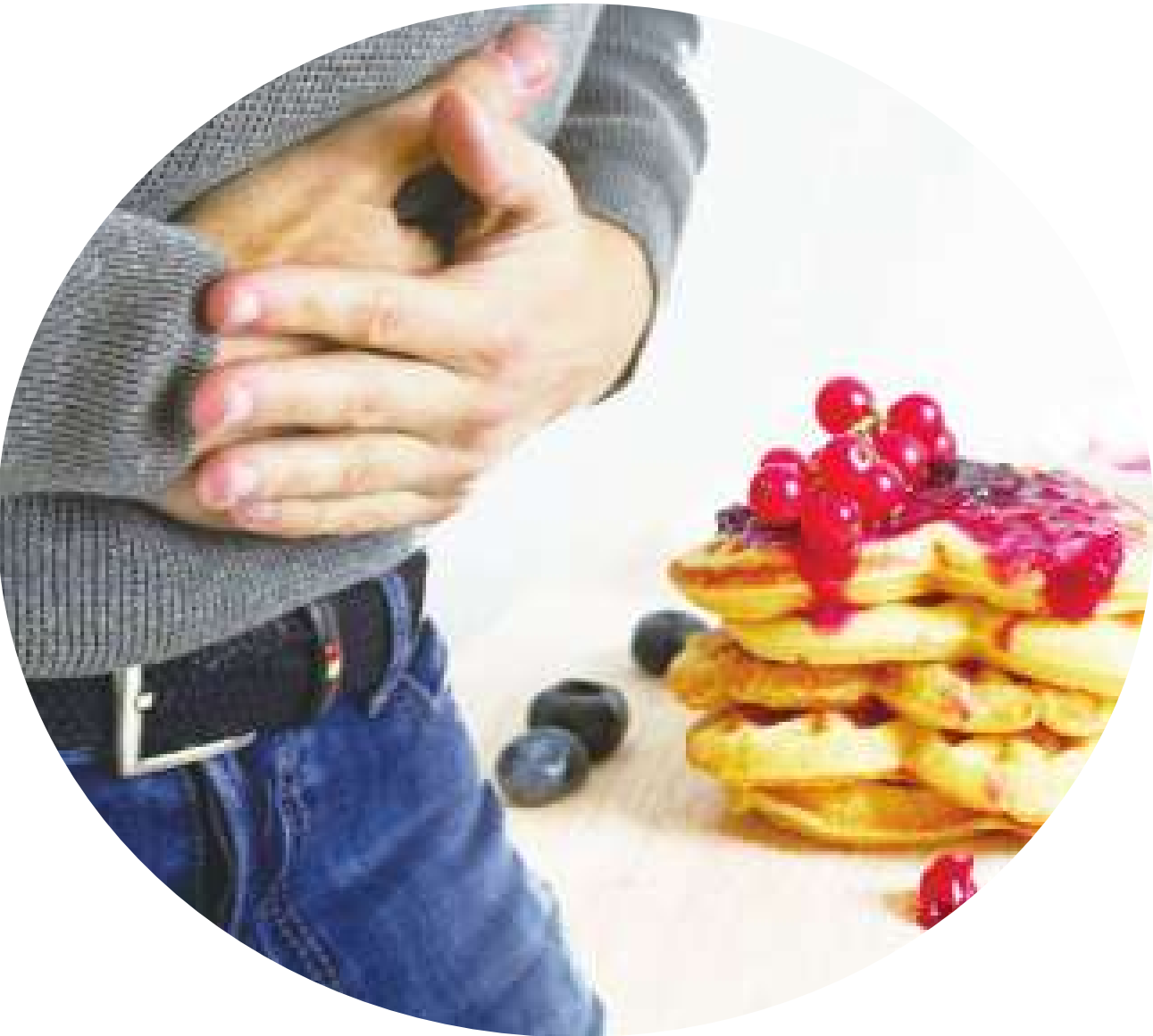
▲攝取「醃類」是斷食第二天的大忌，應盡量避免。

淨空超過一整天的胃部，一旦有食物進入，即便好消化，也會對身體造成刺激。這時候腸胃吸收處於十分良好的狀態，因此如果突然攝取高糖飲食，反而會變胖，除此之外，最不樂見的情形，