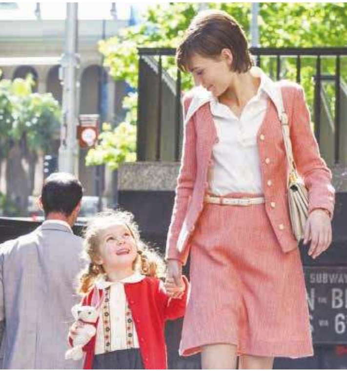
▲影片由海倫瑞蒂在澳洲贏得了歌唱比賽冠軍，她帶著三歲幼女勇闖美國，滿懷希望到紐約闖天下卻事與願違展開序幕。（網路截圖）

而最值得一提的還是導演努力讓這部女性勵志電影扣合女權運動發展，甚至與現在的”Me too”遙相呼應，彰顯出時代意義，是這部影片可觀之處。此片11月在金馬影展首映，12月底會在院線推出。在此之前，歌迷們不妨先在youtube回顧海倫瑞蒂的名曲，先飽耳福。