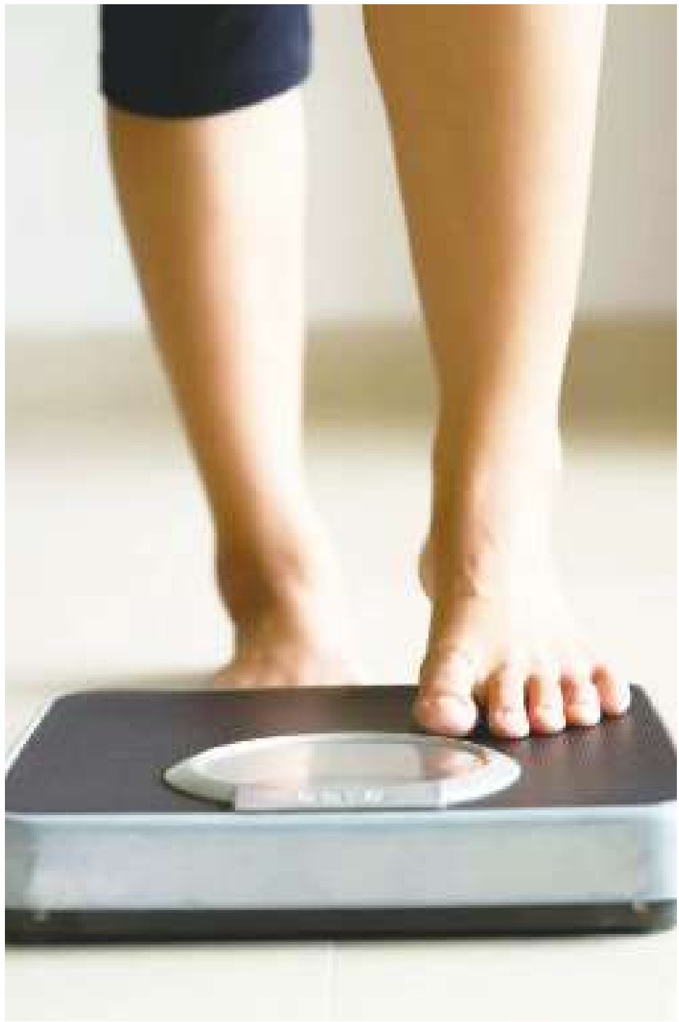
▲易瘦體質的養成讓你不再受數字困擾。(網路截圖)