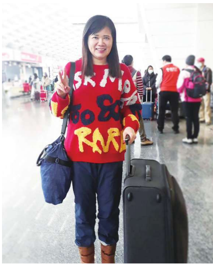
▲ 現在每周參加主日，天天禱告，早已揮別陰霾，在公司任執行長助理兼財務會計的工作，安分守己地在上班著。