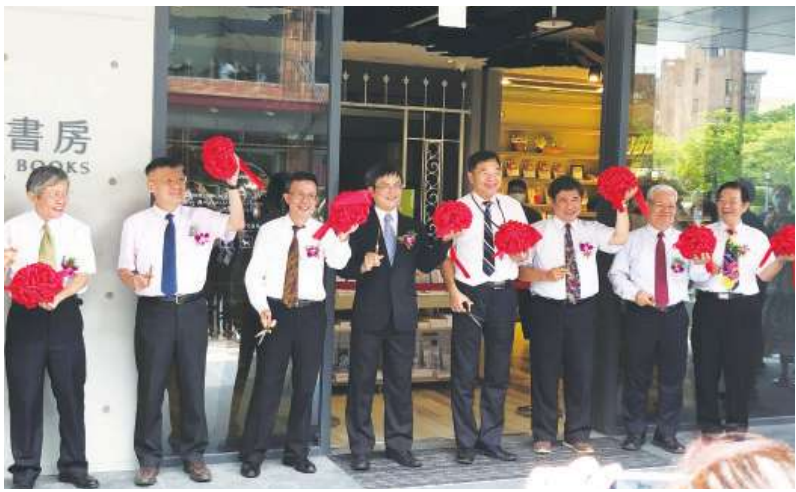
▲ 校園書房歷任校園團契總幹事與董事共同剪綵，展開正式營業。

九月起，每周二晚間校園書房將舉辦一連串免費講座，9 月 18 日與 19 日舉辦「走進職場神學