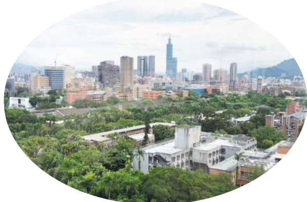
▲ 頂樓的視野遼闊，主要都沒有遮擋，一面可看群山與台北 101 大樓（煙火）。

頂樓的視野遼闊，主要都沒有遮擋。一面看整條羅斯福路與新生南路，一面看整個台大校園，一面看群山與台北 101 大樓（煙火）。