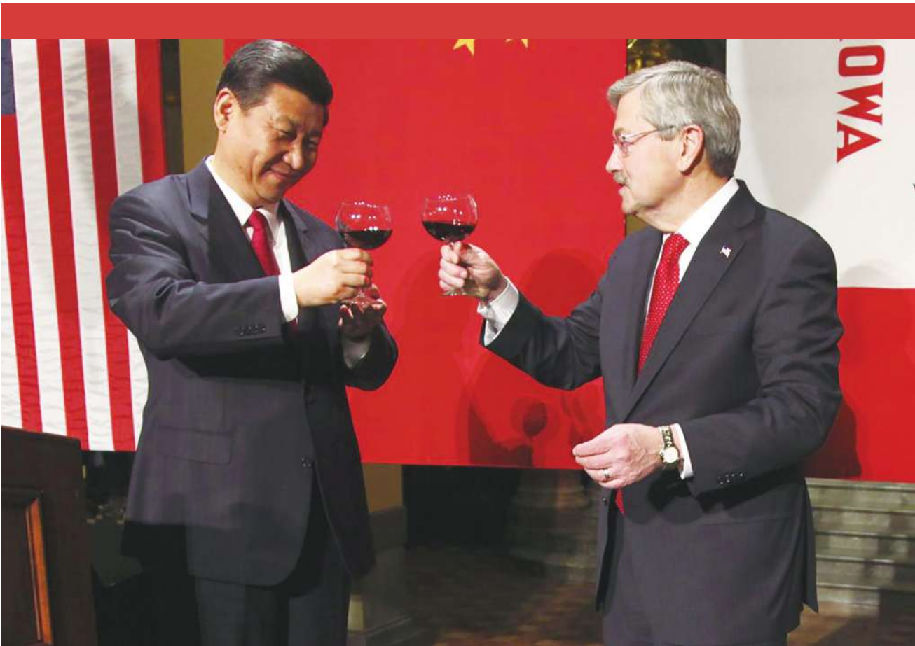
▲布蘭斯塔德（右）第一次擔任州長時，習近平（左）當時還是小官員，曾到訪過愛荷華州，那個時候雙方就認識了。（網路截圖）