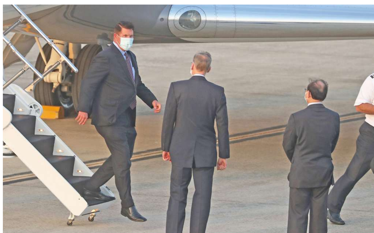
▲ 美國國務院次卿克拉奇 (左 1) 17 日下午飛抵台北松山機場，美國在台協會 (AIT) 處長鄺英傑 (左 2) 親自接機。

美國國務次卿克拉奇將率團訪台，這是台美 40 年來美國官員最高階的訪問，但中國外交部痛批，美國在助長台獨氣焰。