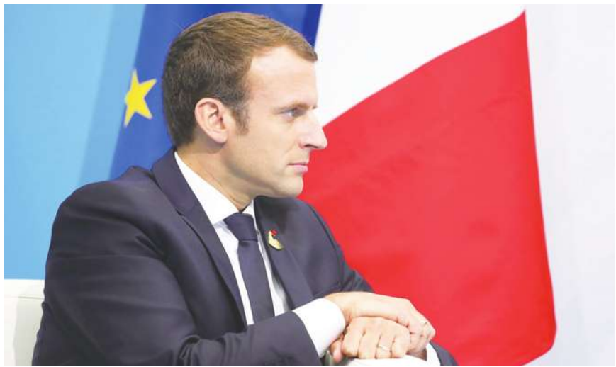
▲馬克宏希望黎巴嫩儘速組成新政府，但目前過渡總理阿迪布面對許多困難。

《環球新聞》提到，黎巴嫩的舊勢力也對不同部門有所堅持。真主黨希望能掌握財政部，其他基督教的馬龍派也對政府相關職位虎視眈眈。雖然阿迪布獲得前總理哈里里的支持，不過近日如果再無法協調出結果，當地媒體認為他可能會下台，這也讓黎國的政治將持續陷入空轉。