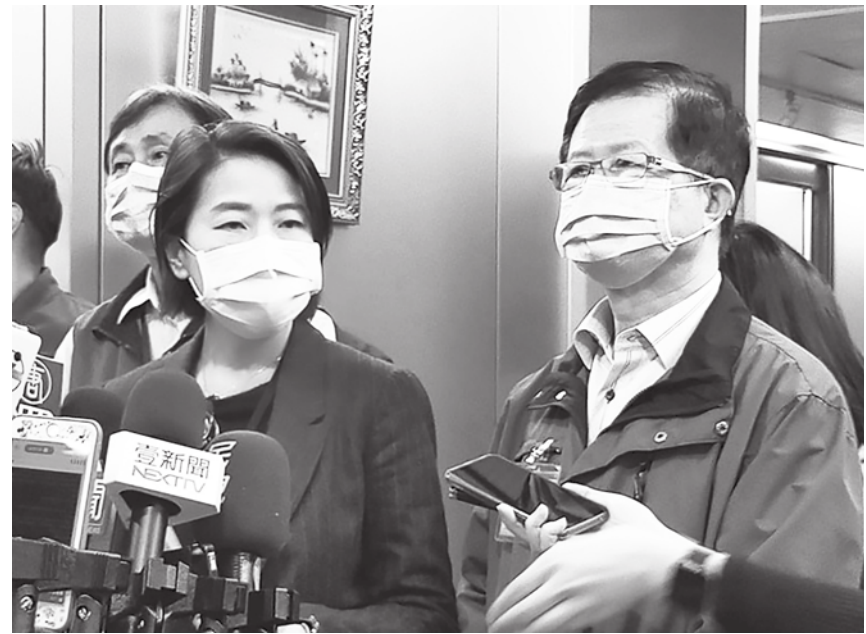
▲黃珊珊表示，防疫假薪資比照現行的家庭照顧假，它一年有7天的額度，因此防疫照顧假前7天會支付薪水，但後7天是不能給薪的。

黃珊珊表示，家庭照顧假是勞基法本身就有的名稱，但就中央訂定的防疫照顧假來看，根據台北市公務人員請假規則、公有管理要點和約聘僱的給假辦法等，都沒有這項名稱，只能適用現行的家庭照顧假，一年有7天的額度，因此這7天會給薪，另外7天在沒有這個名稱的情況下，是不能給薪的。