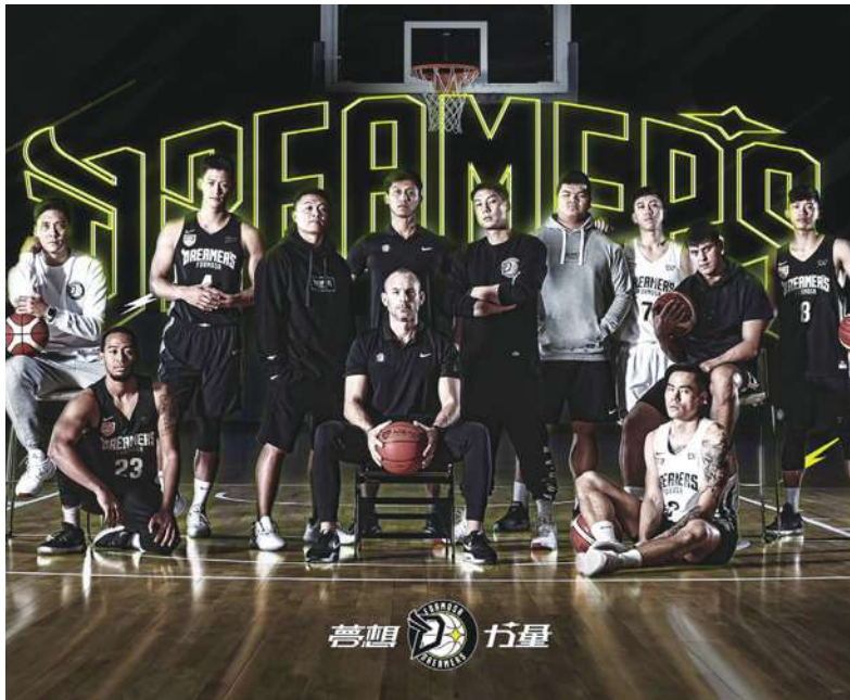
▲ 面對武漢肺炎疫情延燒，東南亞職業籃球聯賽（ABL）寶島夢想家今天宣布：2 月 4 場主場出戰香港東方龍獅以及澳門戰狼的賽事，全數延期。