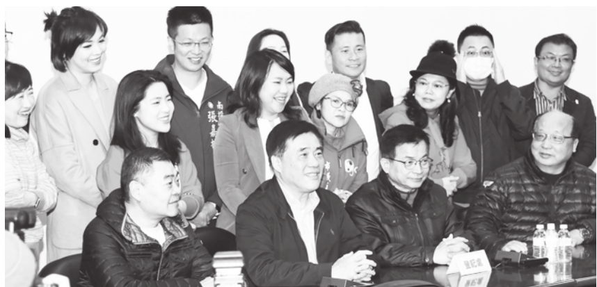
▲郝龍斌(下中)4日正式登記參選國民黨主席，支持者喊出「主席選好，台灣更好。」

「有很多民意代表來支持我，讓我信心倍增。」郝龍斌說，國民黨面對總統大選跟立委選舉挫敗，改革是當務之急，希望透過參選黨主席來走出改革第一步。