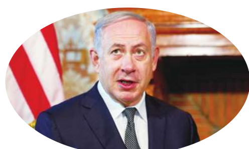
▲以色列總理納坦雅胡與蘇丹主權委員會主席布爾漢於3日在烏干達進行會議，之後以色列官方宣布，兩國關係將邁向正常化。

根據《阿拉伯新聞》報導，自1967年阿拉伯國家聯盟對以色列發表「三不」聲明後，只有埃及與約旦承認以色列主權。蘇丹在前總統布希爾的領導下也與其他阿拉伯國家一同杯葛以色列，但新政府的外交政策轉變。除了與以色列關係正常化外，蘇丹也希望美國將其從支持恐怖主義的國家名單中移除，以便獲取國際金援與促進商業活動。