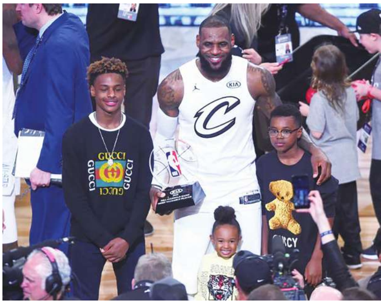
▲ 為了紀念因直升機墜機罹難的布萊恩等人，NBA 明星賽隊長之一的詹姆斯決定，讓他那一隊在比賽中穿上象徵布萊恩女兒的 2 號球衣。