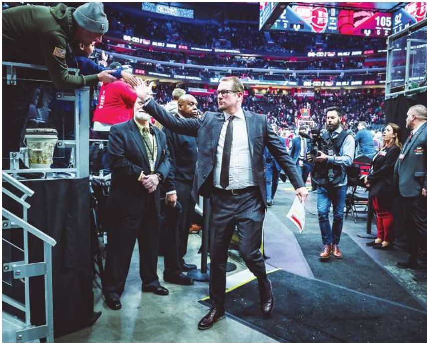
▲ 暴龍隊近期打出精彩的 11 連勝，整個一月繳出 12 勝 3 敗佳績，讓主帥諾斯拿到單月最佳教練獎。

【本報記者宋秉謙綜合報導】NBA 衛冕軍暴龍隊近期狀態火熱，團隊已拿下 11 連勝，功勳教頭諾斯也獲頒為單月最佳教練！雖然暴龍隊本季失去 MVP「可愛」里納德，但他們靠著扎實的團隊防守、外線投射穩定，整個 1 月繳出 12 勝 3 負的佳績，穩居東區次席，也讓諾斯人生第三度獲得單月最佳教練的肯定，後續若再擊敗溜馬隊，便能改寫隊史最長連勝紀錄。