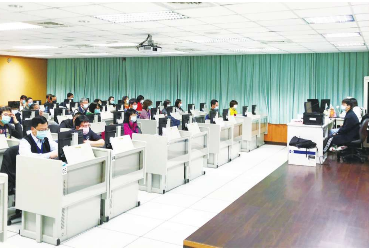
▲ 大考中心招集數百名教師，為 109 學年度學科能力測驗 非選擇題閱卷，因應武漢肺炎疫情，要求人員戴口罩。

大考中心主任張茂桂表示，即便武漢肺炎疫情延燒，國、英文寫作部份仍召集 362 位大學教授參與閱卷，正式閱卷前也審視 3000 份試閱卷，進行討論及草擬評分標準。他說：「每份試卷由 2 名隨機抽出的教授批改，若超出 7 分以上的分歧會重閱。」必要時再由召集人進行第 4 閱，確保公平。至於武漢疫情是否會影響之後的指考？張茂坤主任表示，即便開學時間延後，學生仍然可以在 5 月底前完成學業，而指考訂定在 7 月，所以不受影響。他重申：「指考時間沒有延後，測驗範圍也不會調整。」至於考場部份，因為可能受到學期延後影響，目前還在安排及協調。（相關新聞見 3 版）