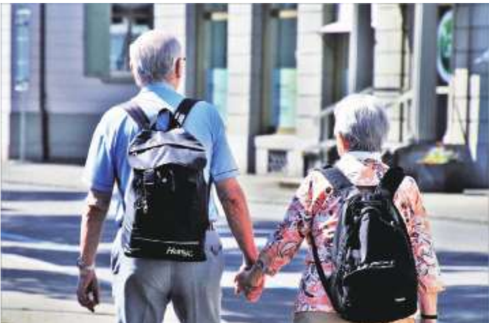
▲台灣普遍的民族性都是避談「老」，因此思考居住問題時，總是以解決現況為主，而不會去想到 30 年後的狀況。(photo by 網路截圖)

▼成年子女分月或是分週，輪流接應父母到家中暫住，這方法看似解決了照料長輩的需求，但其實卻衍伸不少狀況。(photo by 網路截圖)