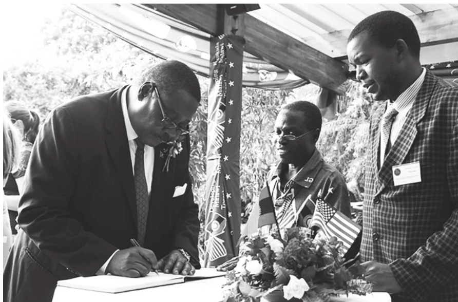
▲馬拉威最高法院宣布，需在 5 個月內重新舉辦大選。圖為現任總統穆薩拉卡。