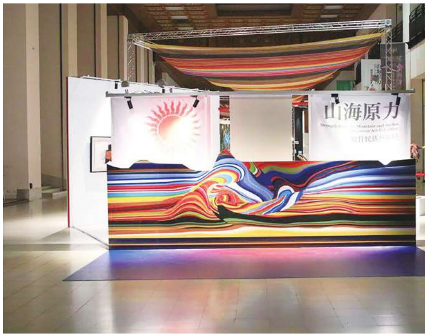
▲▼▼ 策展團隊表示，本展以南島語族的古語土地、根源、海洋為策展主軸，分為 3 大展區。（中正紀念堂提供）

策展團隊表示，本展以南島語族的古語 Cea·Pusu·Wawa（土地、根源、海洋）為策展主軸，分為 3 大展區：鄒族古老語言 Cea（土地），揭示了藝術創