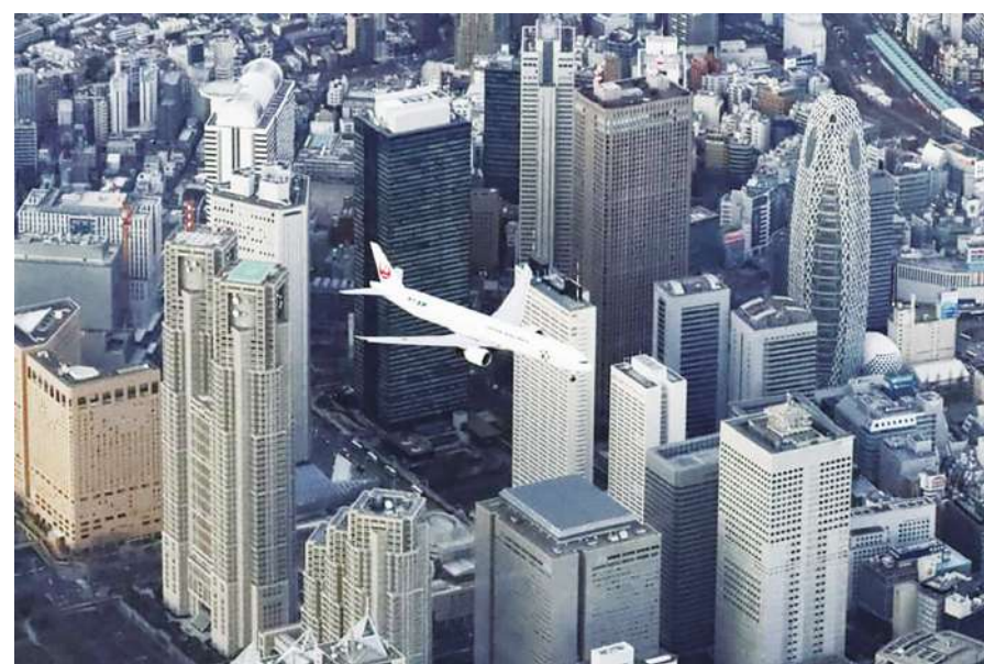
◀日本2020年將迎來東京奧運等盛事，政府調整航線卻使飛機降落時離市區過近引起爭議。