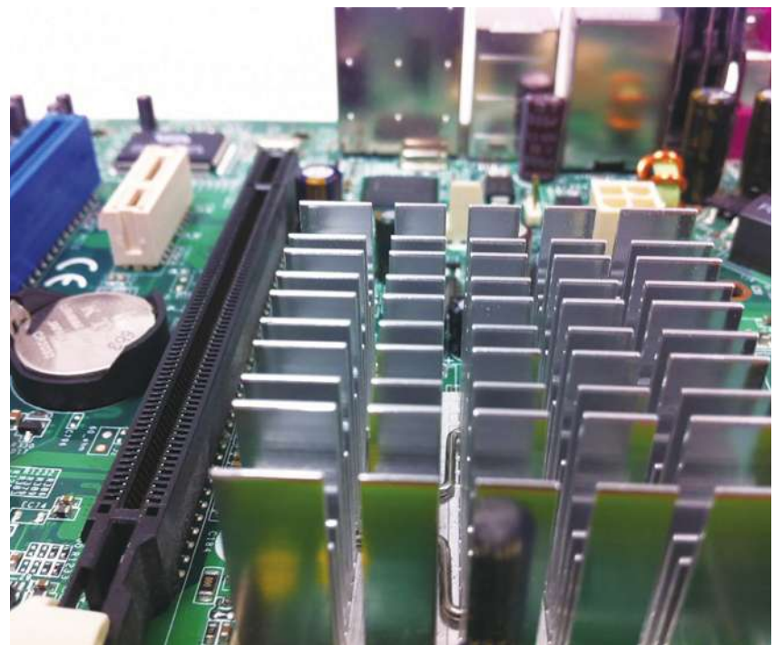
▲台灣號稱資訊大國，IT 產業占證券市場比重為 47.9%，為世界各國之冠。

萬能政府的時代過去了，歐美國家連監獄都委託民間經營，長照制度為什麼不能回歸民間規劃經營呢？