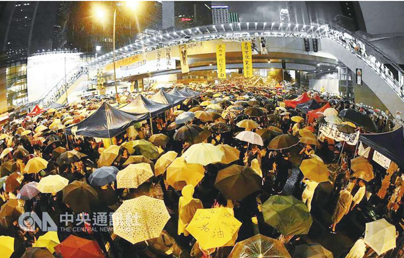
▲4 年前「占中運動」爆發時，香港泛民主派一度氣勢如虹。圖為民眾在主要道路表達抗議訴求。（中央社）

香港警察當然最想破獲這場策劃示威的領導人，但目前仍束手無策；若找出這批策劃活動的人，港府或許就能掌控住局面。這就是香港人厲害的地方，這是雙方在鬥智。（文轉 6、7 版）