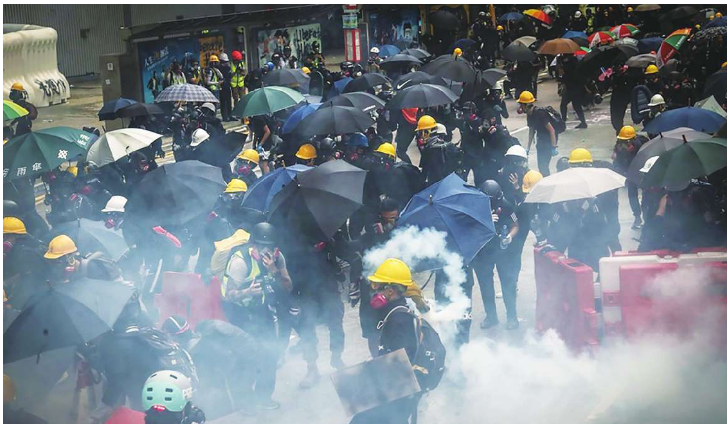
▲香港反送中運動8月31日爆發嚴重衝突，香港眾志秘書長黃之鋒投書媒體呼籲台灣訂難民法。

這筆錢可以開一個公司，把錢交給銀行，一年內都不能動。如果今天是去別的地方還不只一年，但台灣只要一年、甚至11個月就可以了。