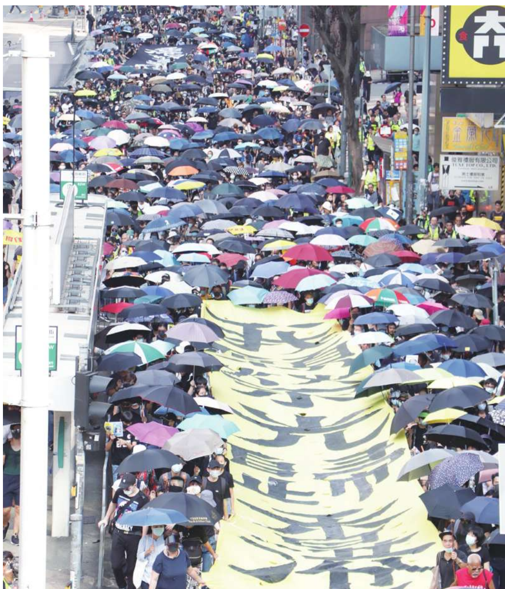
▲5日是香港實施禁蒙面法的第一天，但是許多港人仍然戴著口罩遊行抗議。圖為遊行隊伍下午3時許抵達灣仔，龍頭手持「我願榮光歸香港」的布條。