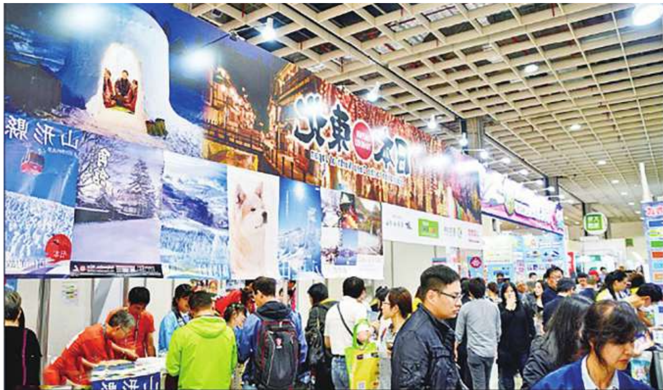
▲台北國際旅展化身成為一個神奇寶盒，把豐富多采的世界收集在象徵TRAVEL也代表TAIWAN的T形盒子，從台灣飛出去。

央有交通部觀光局、原民會、農委會等。地方則有宜蘭館、台北館、花蓮館、中彰投苗四大縣市更是聯合行銷，另外還有澎湖、連江等離島，總計17縣市參展。