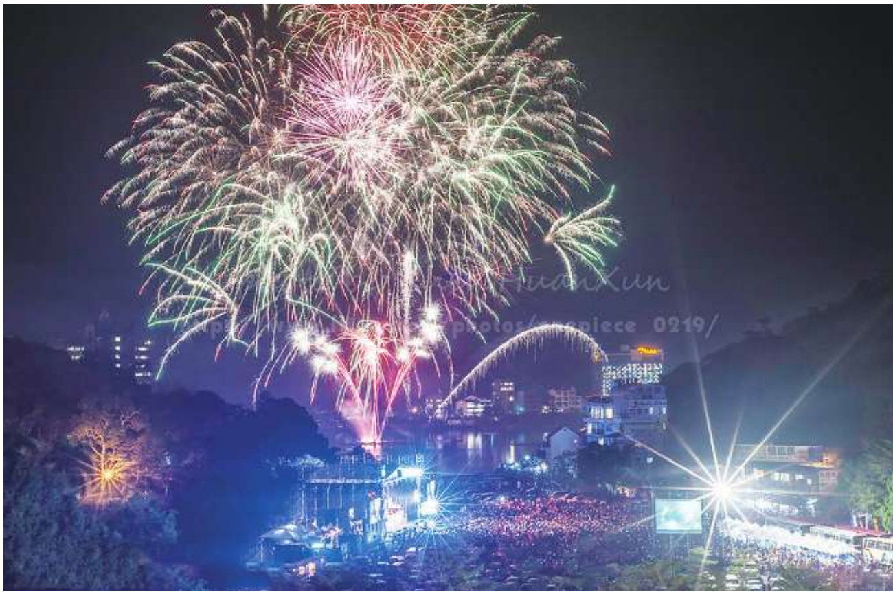
▲▼日月潭花火音樂嘉年華系列活動中，最受矚目的花火音樂會，今年總計有3場次，各展風格特色。

日月潭花火音樂嘉年華系列活動至今邁入第12年，今年舉辦8場亮點主題及其他系列相關週邊活動。本活動以融合台灣及日月潭在地特色，發展出以「藝術文化」及「運動休閒」內涵兼具的