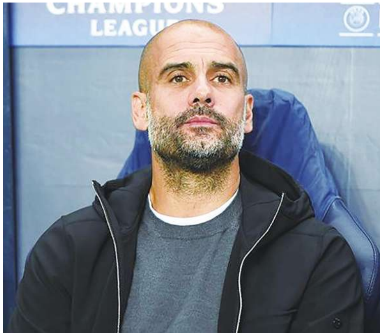
▲美國長達 9 個月的麻疹疫情看來已趨緩。

得英國 8 項頂級賽事冠軍，若要爭取第 9 座冠軍，勢必得在戰術上做出一些改變。曼城意外輸給「狼隊足球會」後，領跑者利物浦的冠軍之路又更顯順遂。