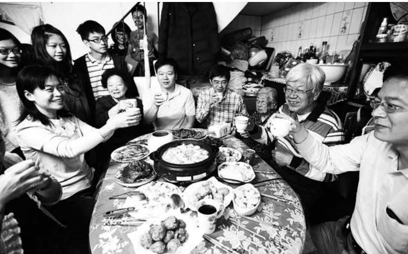
▲ 晚餐菜餚豐盛，並有溫熱的黃酒助興，除了元亮夫婦和二子一女之外，還有三太太娘家的舅兄舅嫂、姨妹和妹夫，和帳房吳先生等圍坐一桌，共祝元亮生日快樂。

「安寶，你不能對老爺這樣無禮，爹媽一切都是為著你好，你要先給爹認罪。我保證你一定有個好媳婦，那個劉家