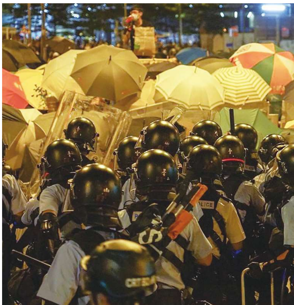
▲香港「反送中」運動持續超過3個月，警民對立加劇。圖為7月1日晚間香港示威民眾闖入立法會，香港警方2日強勢清場，示威者高舉手中雨傘阻擋。

事發前一天晚上，警方修改了守則，等於是告訴執勤警察「可以用槍」，此舉後來造成了，不只是荃灣有警察開槍，一日之內其他各地也出現好幾起槍響。