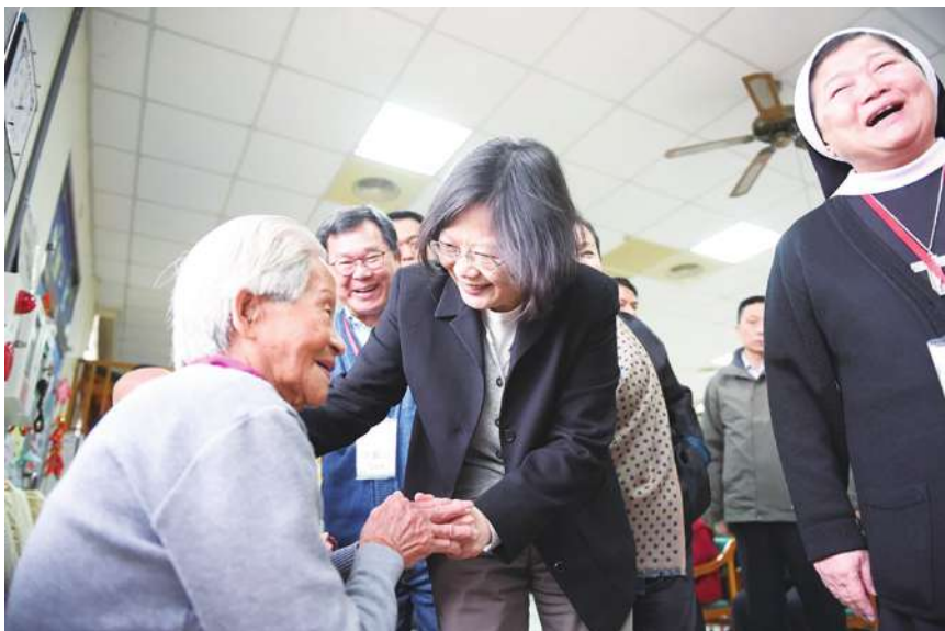
▲長期照護在台灣已形成嚴重的社會問題，政府的長照 2.0 政策，花了大錢，卻根本解決不了長照老人的問題。(photo by wikimedia)

您能相信嗎？在台北市大安區等待安養院的床位，竟然要排 4 年，如果想要入住三芝的雙連安養中心床位，要排 5 到 7 年，長照床嚴重不足，在台北市、台中