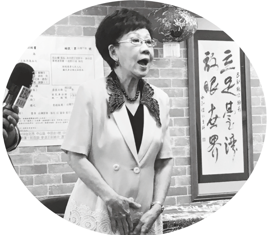
▲前副總統呂秀蓮 7 日召開記者會控中選會刁難。

前副總統呂秀蓮在 7 日記者會上表示，要去領連署書時，中選會表示一定要以收件的方式領取，必須寄到林口才能收件，被認為是在拖延參選人的收集連署書時間。連署書上方的地址更是有許多細節要注意，光是「市」就有三格要填，不能書寫簡體，她說：「請問有誰在寫台灣的『台』會寫繁體『臺』，現在也沒有台灣『省』了吧？」呂秀蓮指出，此連署書版本為