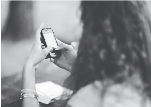
▲一份 2018 的研究認為，長期低頭滑手機恐會導致頭骨增生骨骼並突出，但其他學者認為過於牽強，大眾不必擔憂。

儘管各大外媒稱之為「角」，但實際上該篇研究並非試圖宣稱人類會長出和犀牛、長頸鹿頭上一般的角，只是在探討人類頭骨某部分可能會增生骨骼，導致微型凸出，在醫學上被稱之為「枕外隆凸」（EOP）。作者沙哈爾就表示，「角」是各大媒體所用來形容 EOP 的詞，但研究本身並未使用這個詞。除了各大外媒誇大其詞外，該篇研