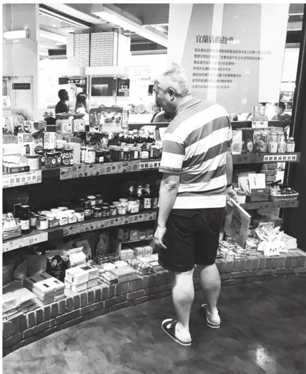
▲整間書店，充滿了濃濃的宜蘭庶民風味，書卷中可說接足地氣。（簡秀枝提供）

▼矮書櫃有系統錯落，紅磚不只分割了空間，更以凸出磚平面區，是款待閱讀饕客的不規則坐位。（簡秀枝提供）