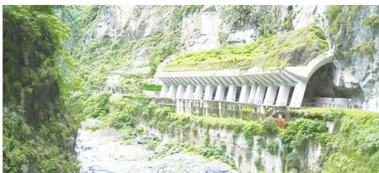
▲完成整修的九曲洞步道，除景觀明隧道外，還可更親近峽谷，聆聽立霧溪急流震耳的水聲。

受限於峽谷地形腹地狹窄的因素，九曲洞步道入口處並無劃設停車位，車輛只能於公路兩側臨時停車，讓遊客上下車後立即駛離，以維持中橫公路交通順暢及安全。