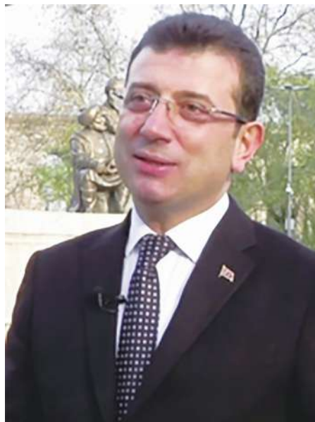
▲ 伊斯坦堡市長重選 23 日登場，反對派共和人民黨的候選人伊瑪莫魯（如圖）被看好再贏葉德仁一次。(photo by Wikimedia)

反對派推翻執政黨在伊堡長年掌權而看似落幕，但卻被害怕輸掉關鍵大城伊堡的執政黨玩「當選無效之訴」。