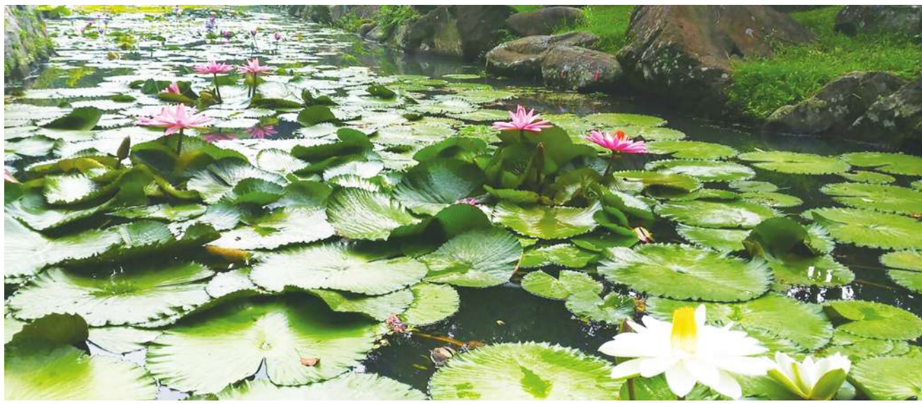
▲▼蓮花與荷花是同一種植物，精確地說，「荷」是花與葉子的總稱，「蓮」則是指果實，也就是蓮子的部分。（網路截圖）

新北市二重疏洪荷花公園： 疏洪荷花公園位於二重疏洪道內，機場捷運的高架軌道就在一旁，每年 6、7 月荷花公園總有大片荷花綻放，低角度取景還能將捷