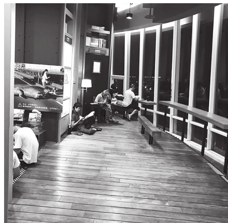
▲夕陽西下，憑窗展書讀，是騷人墨客最愛的隅角。