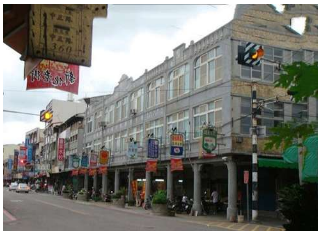
▲新化、東山數位寬頻應用街區計畫，已將「行動支付」列為輔導重點。

新化、東山數位寬頻應用街區計畫將「行動支付」列為輔導重點，期盼透過中央經費挹注推動商圈實質商業發展，並藉由玉井、新化、東山數位街區成功營運模式複製及擴散，帶動台南其他商圈場域服務升級。