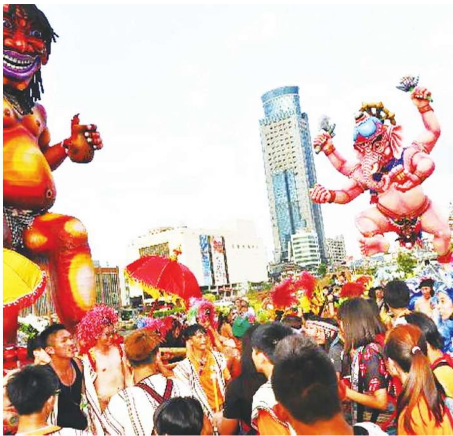
▲海洋老鷹嘉年華運用竹子及紙等材料製作小卷、海豚、飛魚等遊行道具以及搭配遊行的服裝。

嘉年華藝術共創工作坊期間召集社區居民親手創作遊行主題道具，基隆市府指出，今年的工作坊很不一樣，可以看到大鯨魚悠遊在蔚藍的海洋中，彩色小魚調皮地穿梭其中，展現出海洋工作坊的壯闊氣勢，尤其在夜間打上