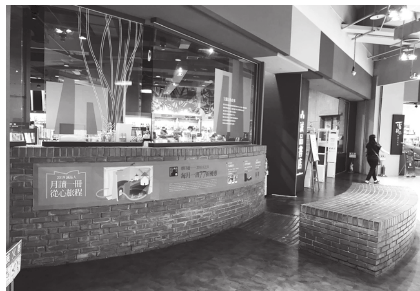
▲矮書櫃有系統錯落，紅磚不只分割了空間，更以凸出磚平面區，是款待閱讀饕客的不規則坐位。

在宜蘭誠品書店，看到或坐紅磚台、或趴在枕木桌、或靠著窗邊的閱讀人群，感受到那種不用言說的新人文風情，正熠熠泛著輝光，無遠弗屆。