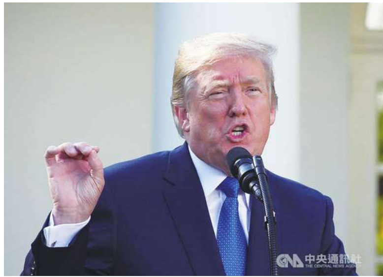
◀ 據知情人透露，美國總統川普在空襲伊朗喊卡當天，批准網攻行動，癱瘓伊朗控制飛彈發射的電腦系統。