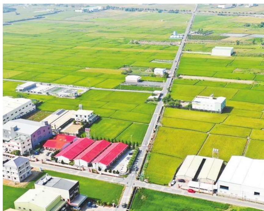
▲ 行政院擬將農地工廠全面納管、就地輔導，引發環團不滿。（網路截圖）

沈榮津表示，修法後不容許新增未登記工廠，也就是 105 年 5/20 以後新增的工廠將依法停