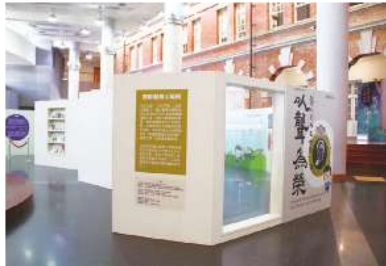
▲「台南月月主題日」住台南抽百萬機票」旅宿推廣，5月則於20日推出「台南博物館主題日」活動。

台南3至12月每月都會抽出10組「台南大阪」與「台南香港」來回機票及各月主題好禮，台南旅遊臉書粉絲團每月均會推出不同的主題日色票系列活動及粉絲好禮抽獎。