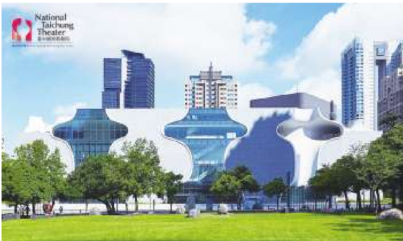
▲▼台中國家歌劇院舉辦為期一個月的展覽《2061 宇宙掉了一顆牙 - 郭奕臣裝置藝術特展》。(網路截圖)

郭奕臣自聽障生與外界溝通的手語獲得靈感，設計出夜光牆藝術體驗，當光線照射在塗佈了夜光粉的牆面上，牆上便會留下光的軌跡，讓觀眾得以「看」見語言與記憶的脈絡。