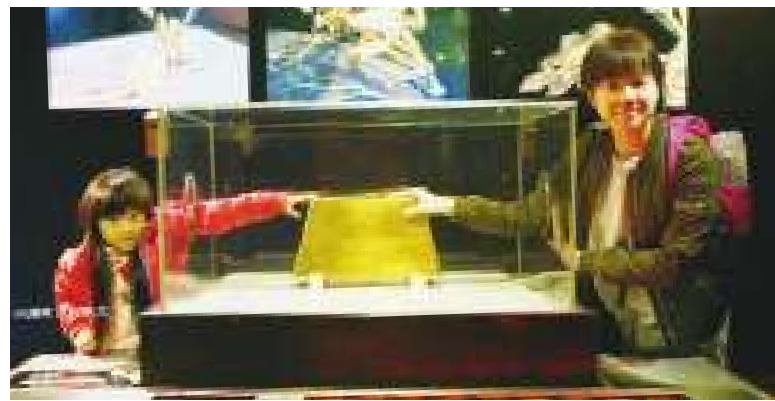
▲黃金博物館將在國際博物館日推出系列活動，包括「高年級黃金實習生」、「珓瑯彩繪親子體驗」及「食在戀金雕花DIY」等。

黃金博物館的特色本山五坑坑道體驗活動，在展示更新後也是相當具有看點，融合了互動式投影以及擴增實境(AR)等科技，讓坑道的景象更是栩栩如生，參觀民眾能沉浸在過去的輝煌黃金歲月。