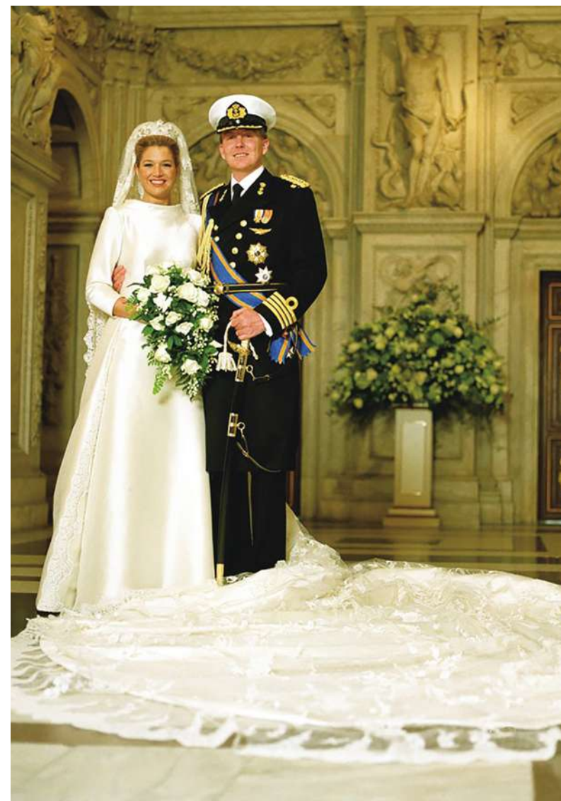
▲ 剛即位的日皇德仁與皇后雅子的愛情故事最近又受矚目，荷蘭則有愛美人不愛江山的浪漫經典。國王亞歷山大當王儲時為追求阿根廷美女一度欲放棄王位，堅定地追求幸福。