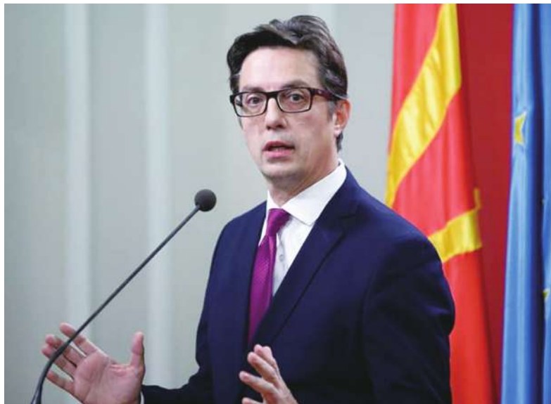
▲北馬其頓大選 6 日出爐，親西方的執政黨候選人潘達洛夫斯基宣布獲勝。外媒分析，這有助北馬其頓提升國際地位。

根據《歐洲新聞網》報導，北馬其頓過去長期在國名上跟希臘紛爭多年，不過在今年 1 月終於跟希臘達成協議，將原本的「馬其頓」改成「北馬其頓」，但這些決議在該國也有引發國內民族主義分子不滿，此次選舉落敗的候選人達夫科娃也藉此在選戰中對潘達洛夫斯基多有批評。