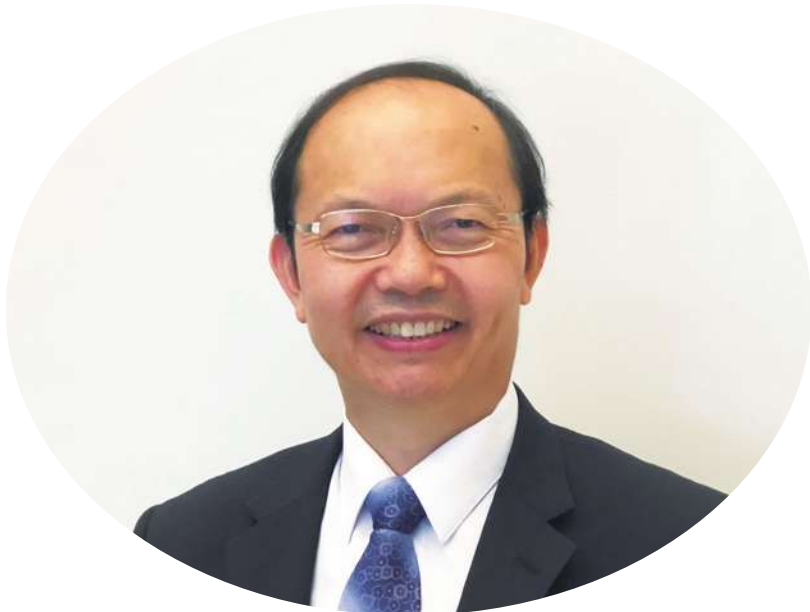
▲ 台中市教育局長楊振昇。

一個校長、老師專業化能力之累積，應不輸給一個部長或局長。而長期有效的累積，學校及教育競爭力才能提升。對於具備良好專業能力的老師，楊振昇認為應該比照資深教授制度，給予長期休假或獎勵出國學習的機制；而對於不適任的教師，若繼續留在教育職場，對家長和學生也是一種無奈和不幸。