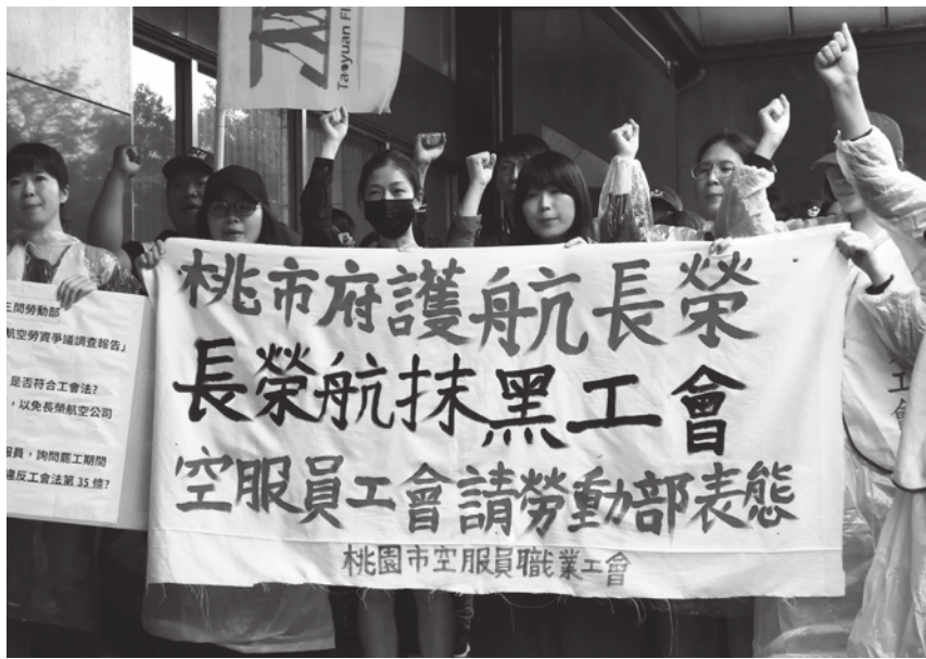
▲桃園市空服員職業工會6日赴勞動部抗議，痛批桃園市勞動局及長榮航空刻意抹黑工會。

民進黨立委蔡適應擔心，如果索羅門或是其他邦交國關係生變，我國會不會拿不回以往對這些國家的基礎建設補助款？吳釗燮回應，以往的薩爾瓦多或是其他邦交國的基建方案都是屬於商業貸款，國家一定會償還國際間的商業貸款，不然以後就會借不到錢，未來援助計畫如有生變，我國都會拿到補償。