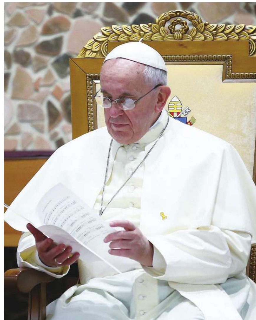
▲ 方濟各認為，網路也可成為連結彼此的方式之一。

【本報記者莊瑞萌綜合報導】梵諦岡跟進科技潮流，讓信徒可與教宗一起禱告。教宗方濟各上週日在聖彼得廣場推出由教廷設計的禱告應用程式（App），不僅可讓全世界信徒知道目前教宗正在禱告的內容，也可與他一起為全世界大事禱告。方濟各在上週日也對發生在哥倫比亞汽車炸彈攻擊與地中海 170 位移民喪命的悲劇感到憂心與難過。