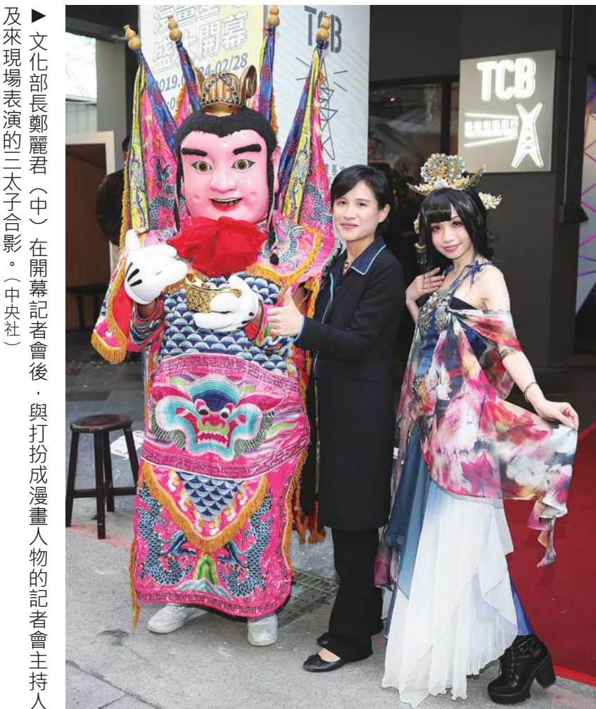
►文化部長鄭麗君(中)在開幕記者會後，與打扮成漫畫人物的記者會主持人及來現場表演的三太子合影。

【本報記者張朝瑋台北報導】「小時候都是跟想開漫畫店的姐姐借漫畫來看，沒想到今天是我主持漫畫基地開幕！」文化部長鄭麗君24日在主持台灣漫畫基地開幕時打趣道。她表示，漫畫基地不只是展覽，也會提供漫畫家創作空間及相關輔導，未來亦會透過與其他平台整合，成為創作者們的後盾。