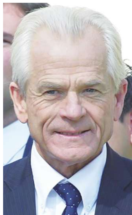
▲ 美國外交政策期刊公布 2019 年度百名全球思想家名單，白宮貿易顧問納瓦洛（左）、前美國第一夫人蜜雪兒·歐巴馬（中）、韓國總統文在寅（右）入選「讀者選擇」大項。

創新工場創辦人李開復也入選「科技」項目思想家。曾在蘋果、微軟與谷歌工作的李開復認為，人工智慧（AI）與人類可以共存，