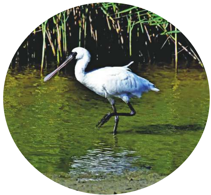
▲一向被稱為重量級的「送子鳥」— 卷羽鵝鵝，最近現身新竹香山溼地。（網路截圖）

不只鵝鵝留在這裡，另外還有瀕危白琵鷺及黑面琵鷺也留在香山溼地過冬，鳥友還在香山溼地觀察到藍喉鵝、小秧雞等較少出現鳥種。1700 餘公頃的香山溼地孕育無數蝦蟹，適合水鳥棲息覓食，為維護生態，市府 2015 年開始疏伐紅樹林，至今已輕完成 100 多公頃紅樹林疏伐，拔除 300 多公頃紅樹林幼苗，逐年擴大鳥類覓食棲地，營造東亞水鳥保護網上的重要基地，讓香山溼地成為全球保育物種網的重要一環。