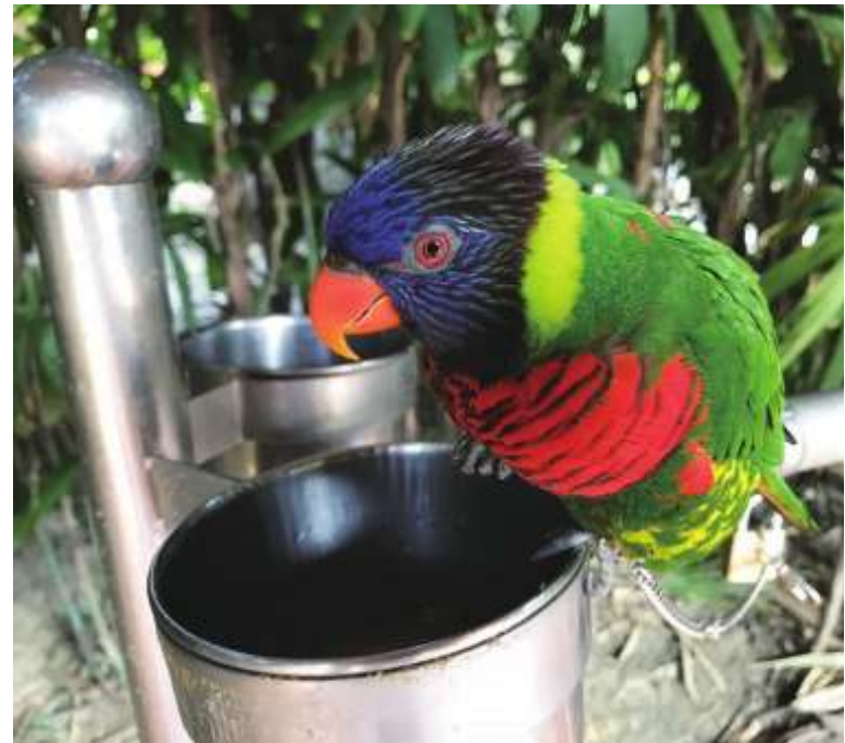
▲壽山動物園特別舉辦「會飛的傳聲筒」教育推廣活動，傳達金剛鸚鵡小常識與保育觀念。

壽山動物園另外將於 2 月 5 至 10 日舉辦「壽山過新年—勇闖豬羅紀」新春系列活動，邀請闔家大小來動物園走春，於春節期間參與動物愛心認養的前二百位民眾還能參加「金豬報福娃娃機」，獲得金豬福袋一份，最大獎是星級飯店住宿券，歡迎多支持動物認養計畫。