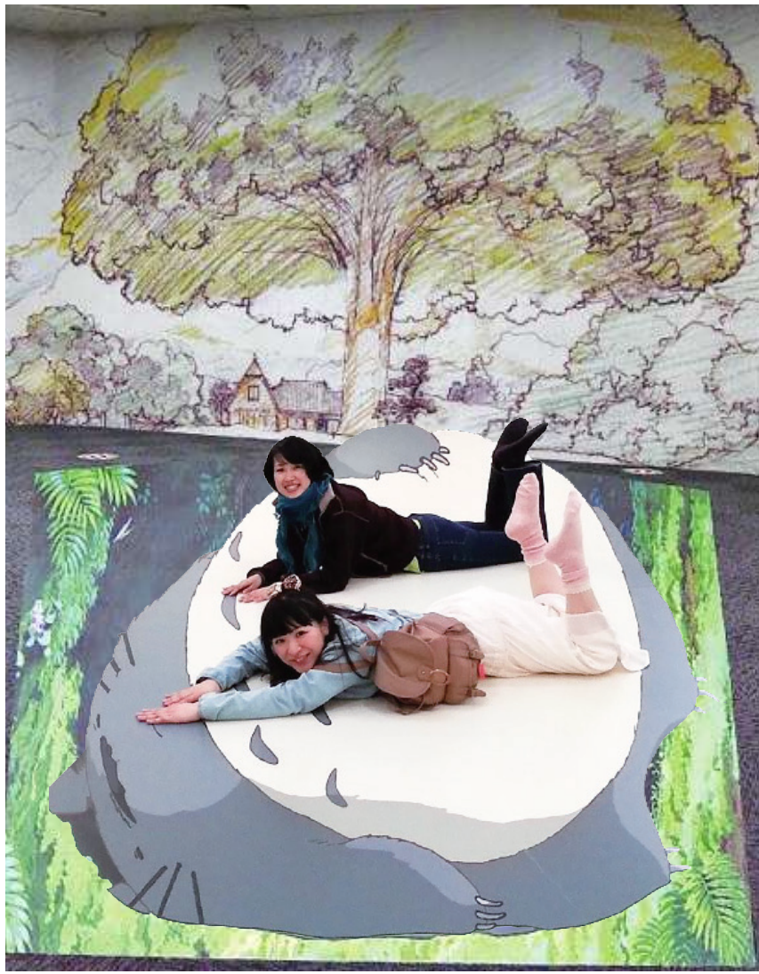
▲▲▲「吉卜力動畫手稿展」一次完整公開高畑勲、宮崎駿導演的 1400 幅真跡手稿。

私下更是摯友，在他們的作品中總是秉持初心，以簡單的故事道出事物本質，不僅傳遞正能量給人們，更時刻提醒大家省思的重