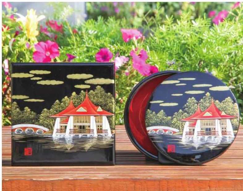
▲ 台中市長盧秀燕 28 日將出訪香港一天，市府表示，屆時將準備知名糕餅和豐原地區生產的漆器餅盒作為伴手禮，餅盒外表黑亮顯示穩重，內在鮮紅充滿喜氣，盒蓋繪有著名地標「湖心亭」。