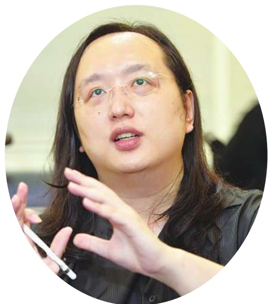
▲ 美國外交政策期刊公布全球思想家名單，行政院政務委員唐鳳選。

唐鳳上午在臉書分享中央社新聞表示，能夠入選，是對台灣社會發展與民主創新的肯定，也是激勵持續行走思路的動力。唐鳳表示，對她來說，思想從來不是個人的創見，而是群眾智慧的結晶。無論是開放政府、社會創新，還是青年參與，每項工作之所以能夠順利推動，憑藉的都是眾人的貢獻。