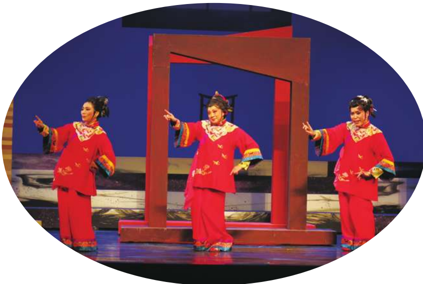
▲但為了讓劇與劇中能相互融合，特別安插一段 3 人同台演出「阿搭嫂」內心戲的橋段。

《阿搭嫂》將於 6 月 1 至 6 月 3 日在台北市城市舞台演出，曾學文表示，盼透過此劇讓戲曲藝術能傳承下去，同時也提供年輕人發展技藝的舞台。對於台灣青年劇團與廈門市金蓮陞高甲劇團合作，他認為，兩岸交流提供一個平台，讓雙方都有互相學習的機會。