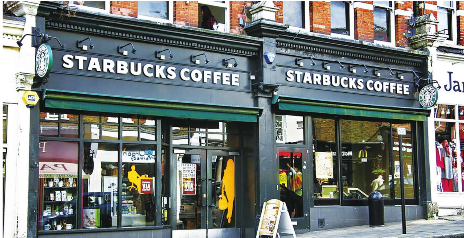
▲ 星巴克 29 日進行反歧視教育訓練，專家和員工雖然都都抱持懷疑，但都肯定星巴克的做法。

【本報記者陳睿仁綜合報導】「今天我們踏出反歧視的第一步！」上月遭指控歧視非裔人種的星巴克29日要求所有直營店休業半天，由星巴克對員工進行反歧視的教育訓練。儘管星巴克承認短短4個小時的教育訓練無法完全消除種族歧視，專家和參與訓練的員工仍多半認為，此次訓練有助於修正不同種族之間的刻板印象。