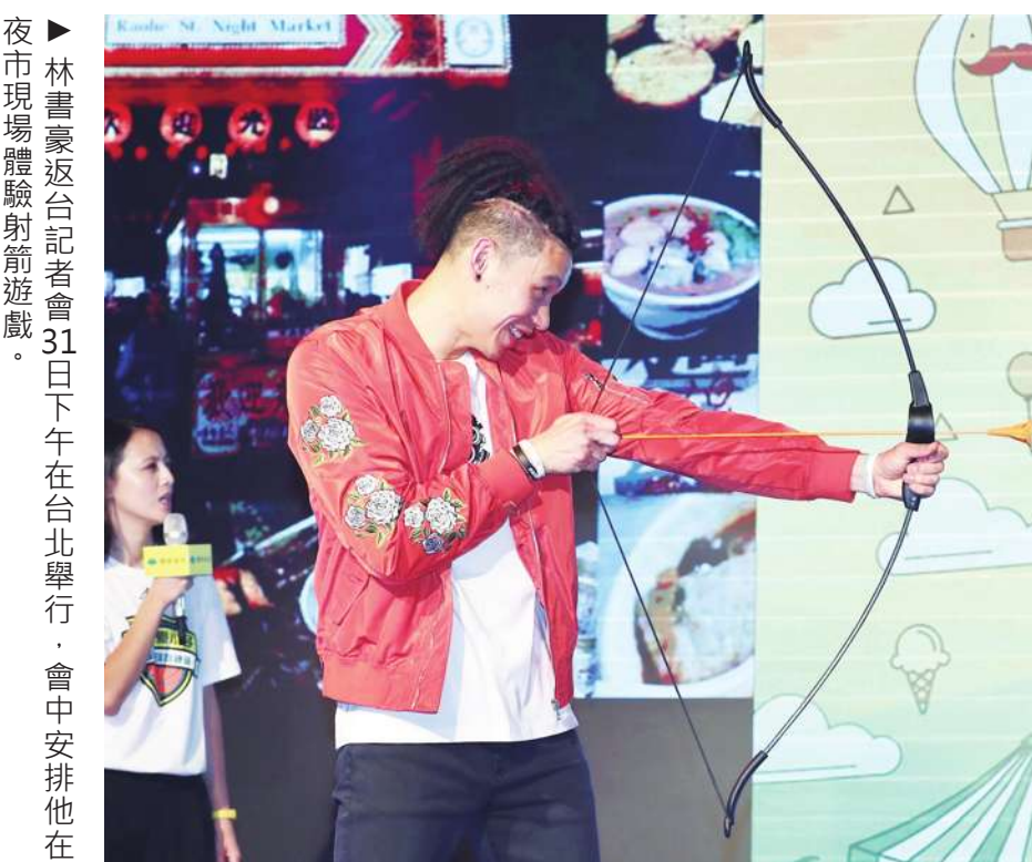
夜市現場體驗射箭遊戲。林書豪返台記者會 31 日下午在台北舉行，會中安排他在

▲美國職籃 NBA 總冠軍賽 6 月 1 日開打，克里夫蘭騎士與金州勇士連 4 年爭冠，對於球迷是否看膩「勇騎大戰」，「小皇帝」詹姆斯說，「想看不同對戰，就先打敗我們」。