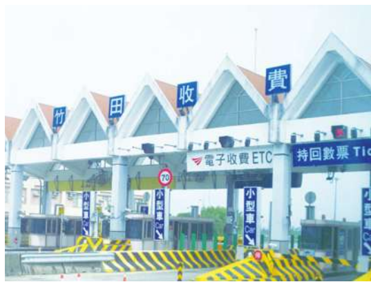
▲交通部澄清並不會將 ETC 作為科技執法工具。

【本報記者藍苡瑄台北報導】「交通部還沒決定用 ETC 當科技執法工具，因為牽涉到高公局與遠通的合約，以及和用戶的法律層面，應該會另用自己的