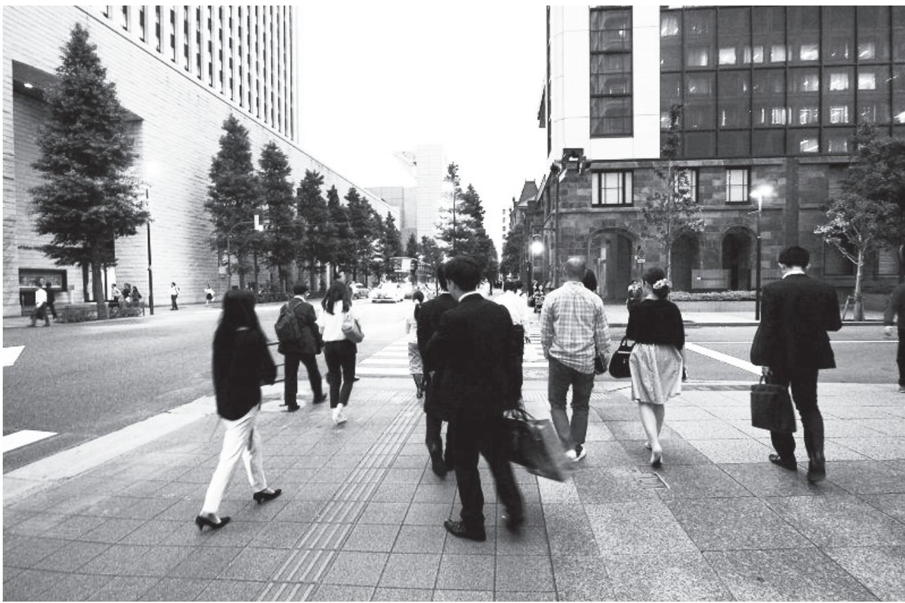
▲ 公務人員服務對大眾敞開，其「情緒勞務」比個人工作者來得重。(中央社)

異：我想，這也是社運者對於公務人員「不夠熱情」之批判的關鍵所在，當然，落實法制維持治理環境現狀，與衝撞不合理的法制現狀，所需要的工作能力與情緒勞務的內涵是不同的，主觀自我正義化進而針對性地衝撞個案，對比隨時要抽離現場並無情化的法制環境要求，類比困難。