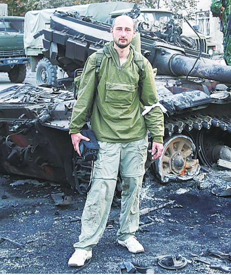
▲ 知名俄籍異議記者巴欽科在被報導刺殺身亡 24 小時內，突然現身記者會，澄清詐死是他配合烏克蘭當局演的一場戲，目的是要防止俄國對他不利。