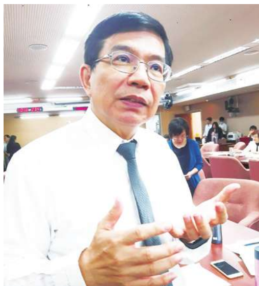
▲交通部政務次長王國材表示，將於明年 11 月台灣主辦的世界飛安高峰會，找適當機會為台灣最近與中國議題發聲。

【本報記者藍苡瑄台北報導】「飛行是普世價值，政治力不應該介入！」交通部政務次長王國材 31 日回應立委林俊憲質詢表示，中國大陸要求國際其他航空公司將台灣改名為中國台灣與 M503 航路爭議的事，可能無法在明年我國主辦的世界飛安高峰會（IASS）