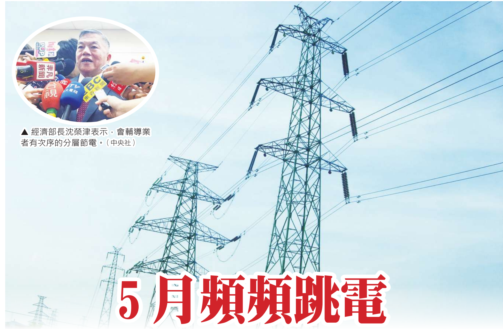
▲ 經濟部長沈榮津表示，會輔導業者有次序的分層節電。

▼ 台電已加強設備管線的保養維護及汰舊更新的工作，計畫七月的備轉可達 5-6%，應不致有缺電問題。