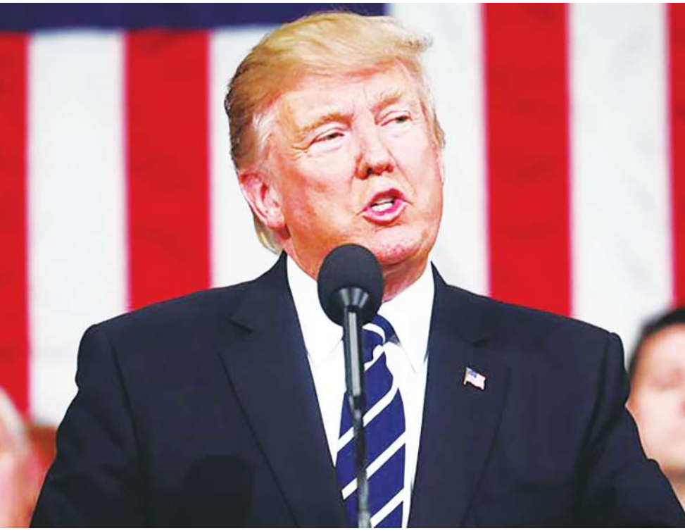
▲ 川普發下命令，繼續對中國商品課徵 25% 的關稅引發中國反彈。

業內幕》透露，美國的關稅和投資政策限制是為了讓美國回復其國內與國際的政治影響力。但外界認為，若美國的貿易政策搖擺不定，恐怕會磨滅中國的耐力而反撲。