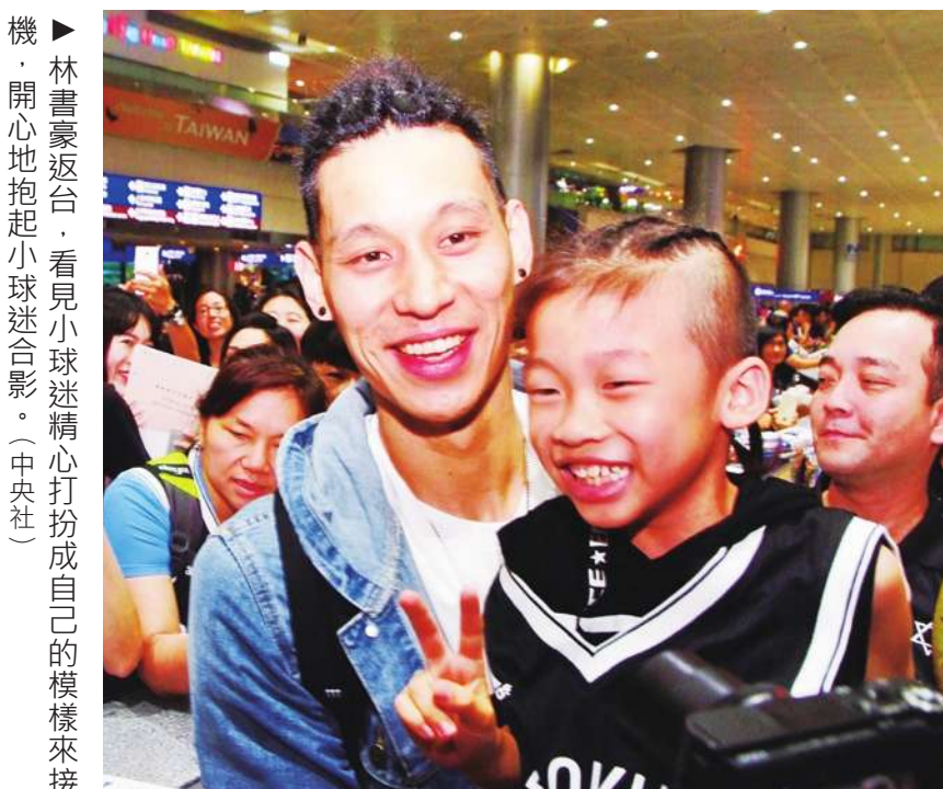
機。林書豪返台，看見小球迷精心打扮成自己的模樣來接機，開心地抱起小孩合影。

NBA 籃網隊球星林書豪 31 日凌晨回台舉辦籃球營與佈道會，他大膽預測 6 月 1 日 NBA 決賽第一場一定會是勇士贏。