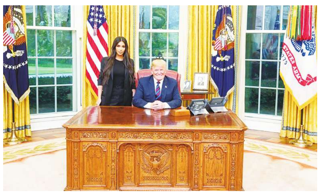
▲ 美國知名女星金卡戴珊 31 日與川普會面，要求赦免美國知名受刑人嬌森。(photo by @realDonaldTrump via Twitter)

【本報記者王慶宇綜合報導】女星金卡戴珊跨界，推動監獄改革！美國知名女星金卡戴珊31日至白宮與美國總統川普會面，希望川普能赦免因輕微罪行遭判無期徒刑的知名犯人愛麗絲·嬌森。川普回應表示與金卡戴珊相談甚歡，也會考慮是否赦免嬌森。