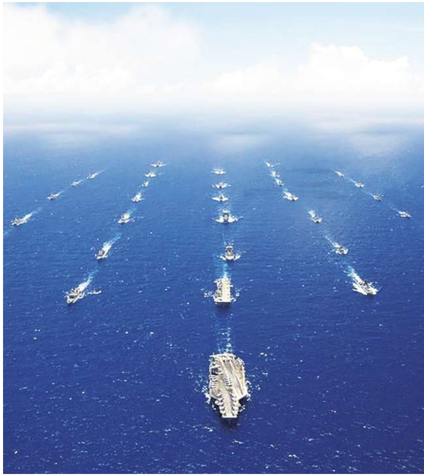
▲ 環太平洋軍演即將舉行，台灣能否參與引起多方討論。美國海軍第 3 艦隊回覆中央社記者電郵提問，內容完整介紹這項規模龐大的國際海上軍演，但沒有回答台灣能否參與的問題。