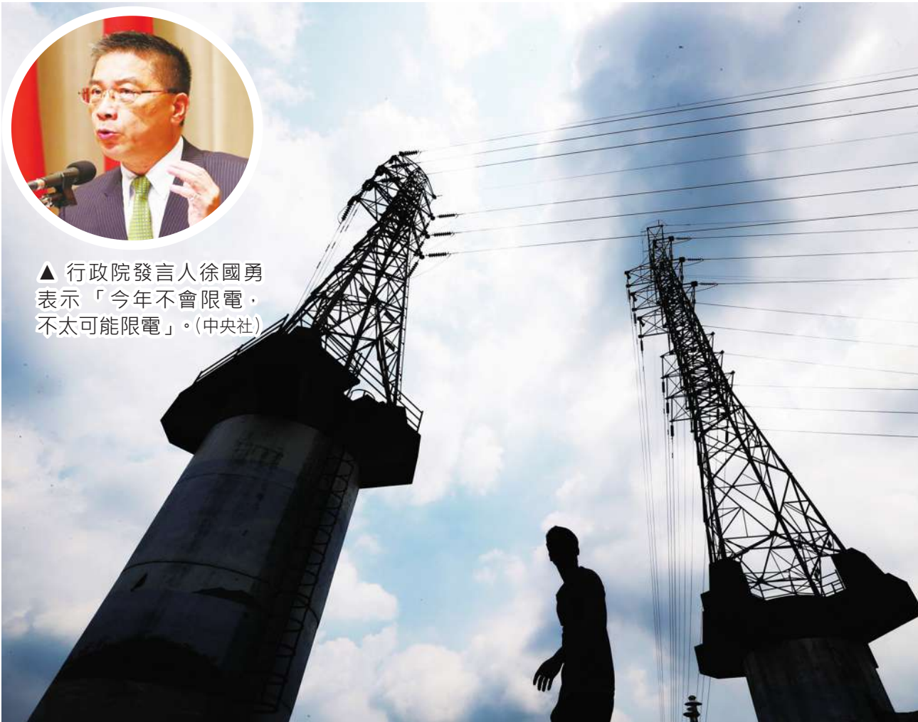
▲ 行政院發言人徐國勇表示「今年不會限電，不太可能限電」。