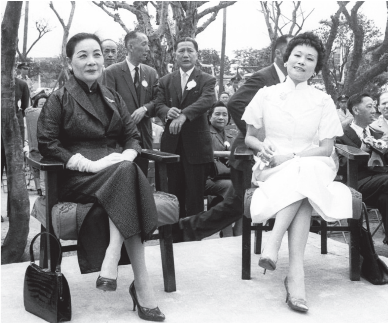
▲ 胡為真父親去世，母親拒絕蔣夫人宋美齡女士（左）的撫卹，認為孩子應在國內接受完整的中華文化教育。

但是，母親沒有接受這善意、看來不錯的安排。她回答說：「非常謝謝夫人的好意，但我想要讓