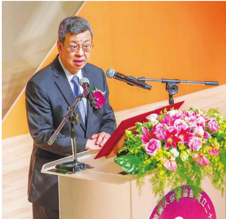
▲ 陳建仁總統在 AIT 40 週年特展上致詞表示，台美兩國持續深化合作，相信台美關係將邁入嶄新階段。

進行打鼓表演。 梅健華表示，展覽陳列了各種文件和文物，蒐集了數百張照片和面談影片，甚至還運用廣增實境和虛擬實境的功能，向大家介紹，過去 40 年來，美國在台協會在台美關係發展中扮演什麼角色。他說，40 年前，沒有人能預料到，美台關係能如此發展蓬勃，希望大家能從展覽中，看出他們如何一起努力，為台美關係奠定穩定基礎。梅健華表示，展覽將在明年全國巡迴展出。 陳建仁致詞則說，台美關係長久以來奠定在自由、民主、人權的基礎上，齊心促進印太地區的和平與繁榮。陳建仁提到今年台灣無法參加 WHO，但美國政府挺身為台灣發聲，令人感動。他表示，AIT 新館下月將落成，這是雙方關係重大里程碑，盼台美兩國持續深化合作，相信台美關係將邁入嶄新階段。