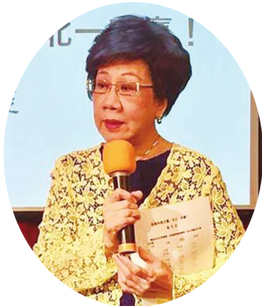
▲ 因未獲黨內提名，呂秀蓮 30 日傳出退黨，外界揣測可能以無黨籍身份參選台北市長。

於，畢竟目前狀況仍不清楚，大家不要總往負面思考，至於「會不會認為民調輸了就應該接受，呂秀蓮沒有拿出副總統氣度？」姚文智僅說，其實協調過程中，沒有像初選那樣的民調機制。