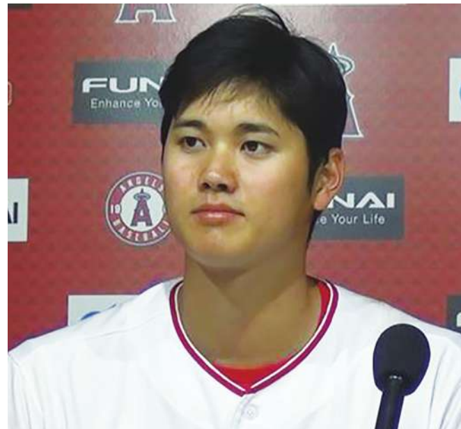
▲大谷翔平答覆記者詢問表示，因普侯斯沒排入先發，這或許是總教練安排他扛第 4 棒的原因。