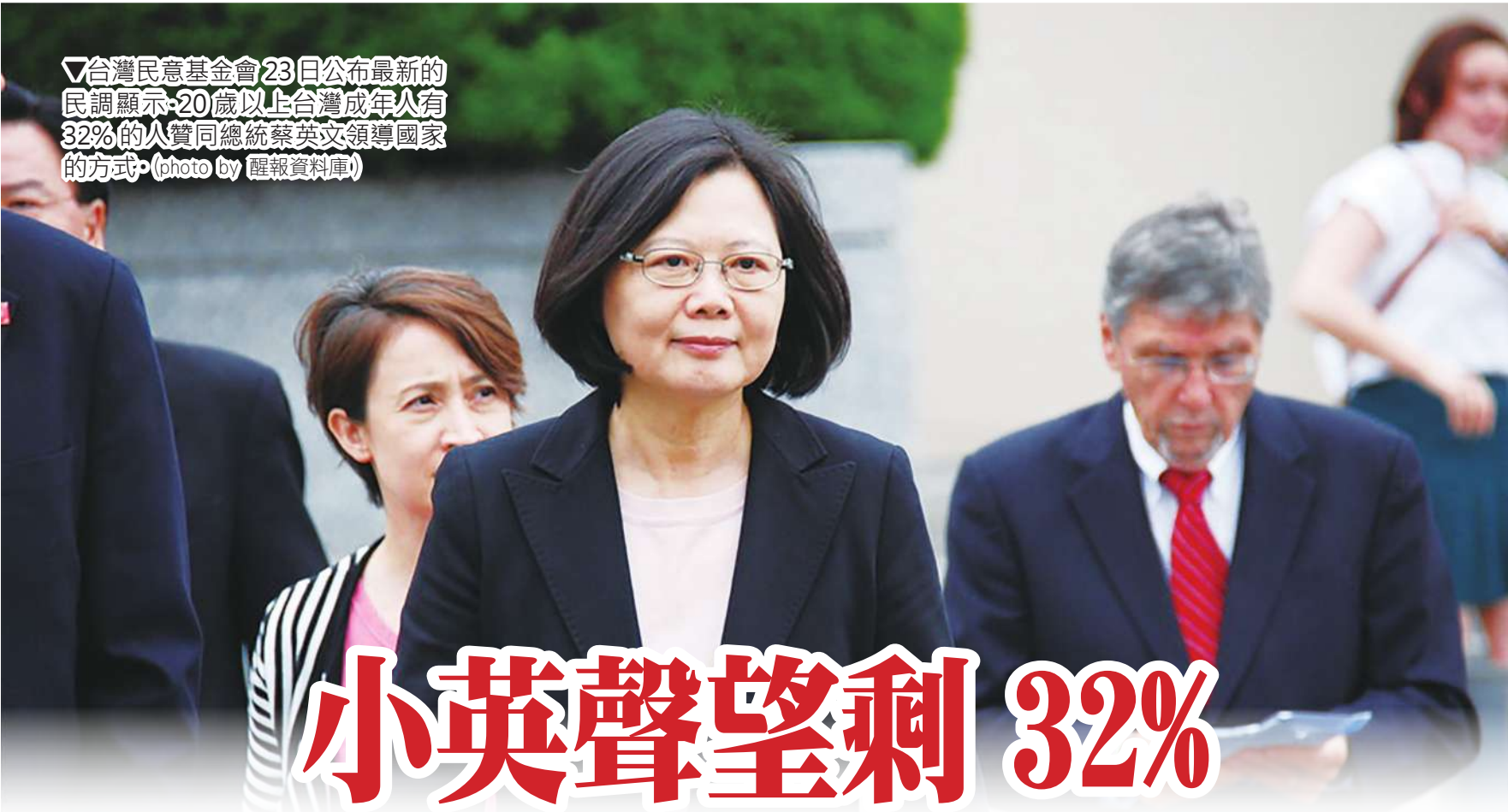
▽台灣民意基金會23日公布最新的民調顯示-20歲以上台灣成年人有32%的人贊同總統蔡英文領導國家的方式。