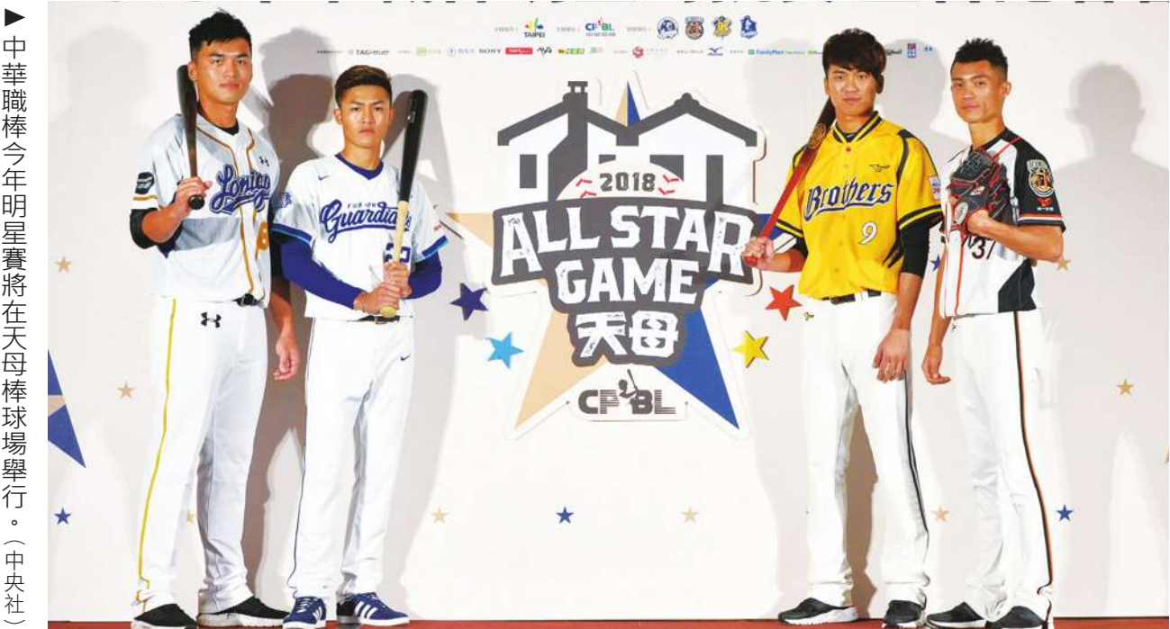
►中華職棒今年明星賽將在天母棒球場舉行。