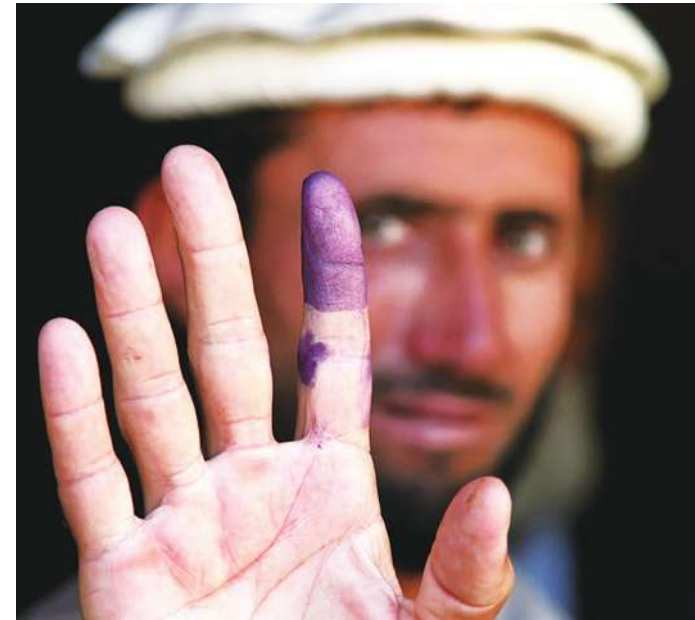
▲ 阿富汗大選即將在10月舉行，但首都選民登記中心日前傳出炸彈恐襲造成63人死亡。

多人受傷。官方指出，1名自殺炸彈客於該處門口引爆炸彈，造成57人死亡，且稍晚又有6人因駕車到巴格蘭投票