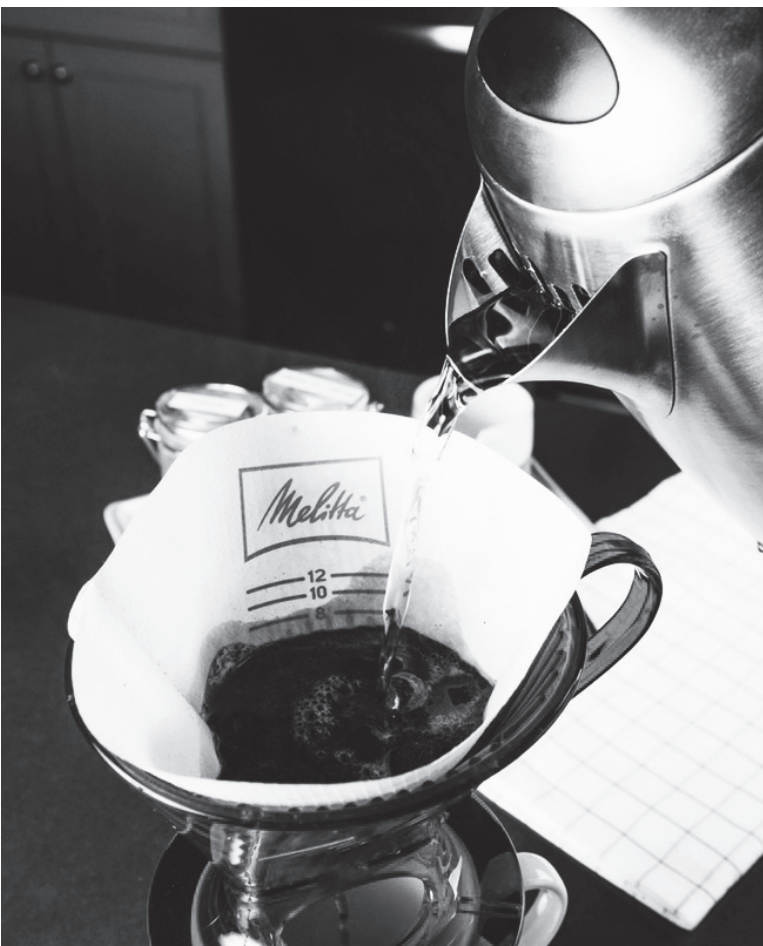
▲Melitta 式濾杯。

►好的咖啡水溫和水量也是其中的條件。