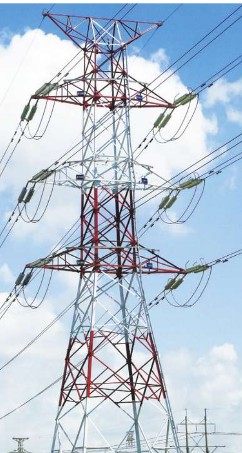
▲因應氣候變化，台電年度歲修的計畫應該也要作適當的調整。