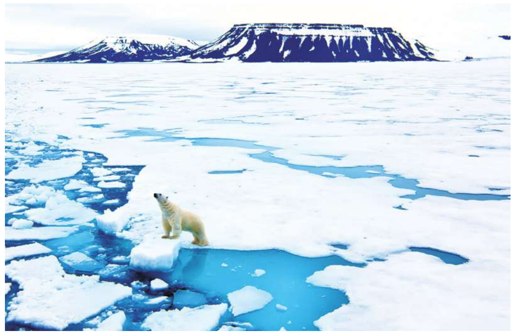
▲暖化最嚴重的影響在極區，而極區會觸動整個大氣的變化，這些變化又引發更多極端天氣。

極端天氣在暖化的趨勢下會越來越明顯，這非常重要的，暖化最嚴重的影響在極區，而極區會觸動整個大氣的變化，這些變化又引發更多極端天氣，不是很熱就是很冷，出現在不同區域，以機會了。