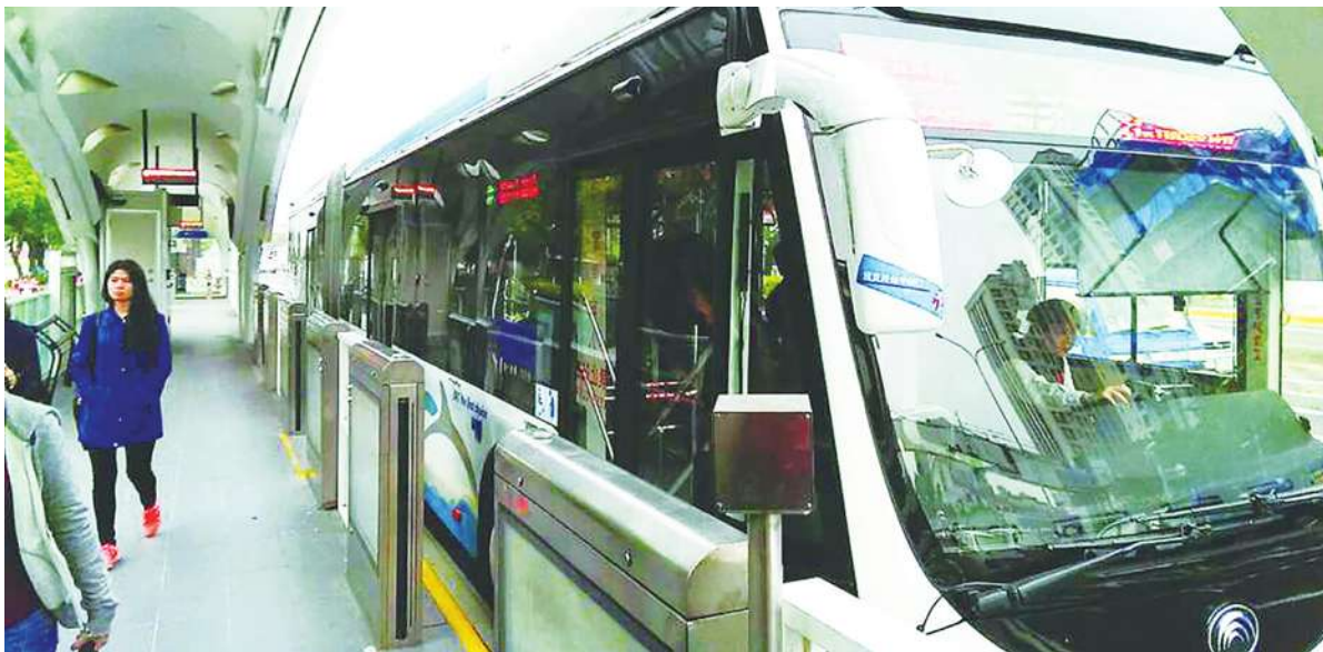
▲BRT 試行時，雖然機電設備尚未完成，但卻有潛力讓台中的交通在數年內獲得大幅改善。

改善台中市中心交通是從胡志強時代到林佳龍時代都相當重視的議題。胡志強過去規劃的 BRT 快捷巴士系統，被林佳龍以「騙