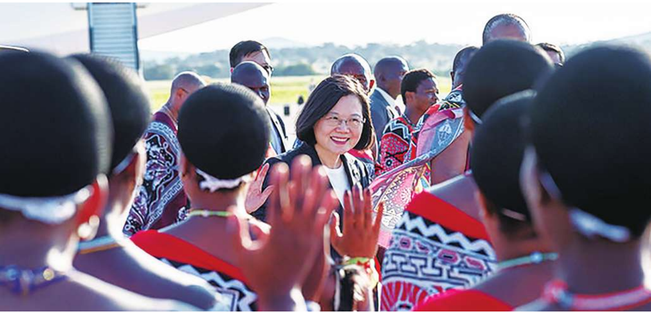
▲蔡英文出訪史瓦濟蘭拚外交的成果，有 50% 民眾對此行感到無感，70% 民眾不滿台灣外交處境。

然而，根據台灣民意基金會 23 日公布的最新民調顯示，有 50% 的人對蔡英文出訪史瓦濟蘭拚外交無感，且有 70% 民眾不满意台灣國際地位和外交處境，普遍不