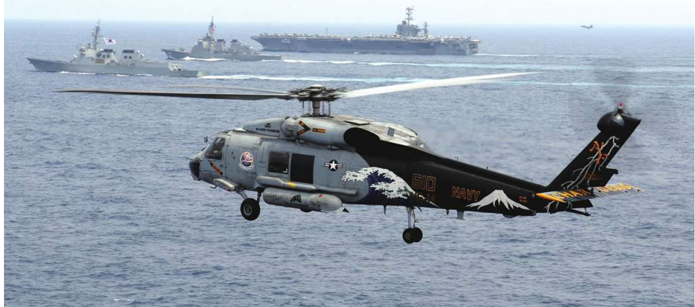
▲ 島嶼爭議使得東海的火藥味更加濃厚。

2014 年上調 7%，可望用來開發新的軍機。分析師認為，儘管日本在軍事的偵測科技領先全球，但是日本的憲法限制軍事發展，規定軍機不可攜帶長程飛彈，日本的航空母艦也只能運載直升機，這對日本仍是一大劣勢。