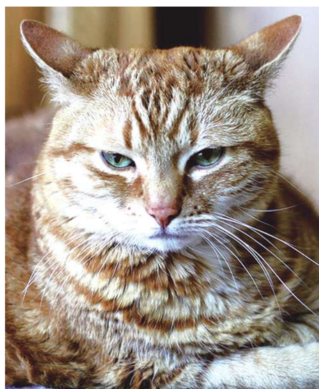
▲日本研究指出，貓會分辨主人的聲音，但聽見並不會像狗一樣熱情回應。