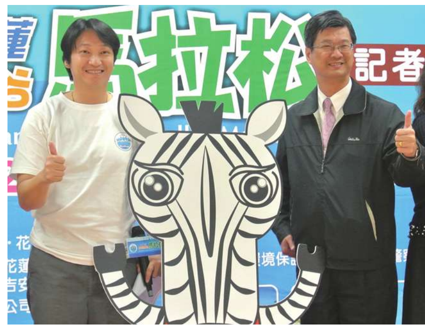
▲ 「2013 花蓮太平洋縱谷馬拉松」，將於12月22日鳴槍開跑。

【本報記者陳正健台北報導】繼太魯閣馬拉松之後，花蓮另一條美麗的路跑盛地在縱谷。花蓮縣政府28日宣布，「2013 花蓮太平洋縱谷馬拉松」將於12月22日鳴槍開跑，共有5千名好手共襄盛舉，參賽者沿著全國最長的花蓮193縣道而跑，一旁就是台灣東部三大河之一的花蓮溪，風景秀麗，是極具魅力的長跑賽道。