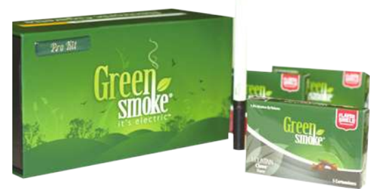
▲ 芝加哥市長拉姆伊曼紐不只反菸，也提案抵制電子菸的販售。