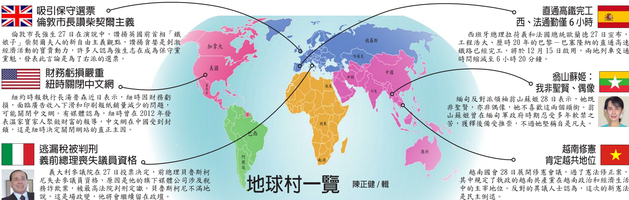
地球村一覽 陳正健/輯

越南國會28日展開修憲會議，過了憲法修正案，其中規定了執政的越南共產黨在越南政治和經濟生活中的主宰地位。反對的異議人士認為，這次的新憲法是民主倒退。