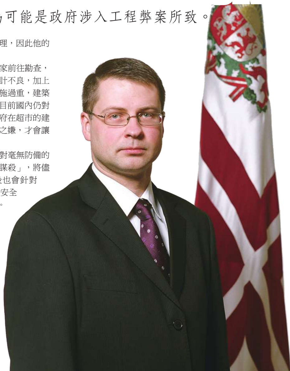
► 拉脫維亞總理東波夫斯基27日宣布請辭，引起全國譁然。

總統貝爾津指出，這場災難對毫無防備的民眾而言，是一場「大規模的謀殺」，將儘速調查。拉國政府表示，之後也會針對國內的大型公共建築進行工程安全評估，以防類似災情再度上演。貝爾津指示，針對建築用料的合格與否，以及建造過程中是否有政府單位涉入收賄，也將一併徹查。