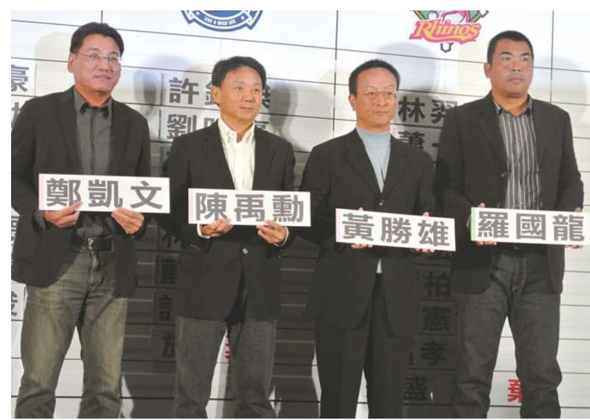
▲ 2014年中華職業棒球大聯盟年度選手選拔會，28日在台北君悅飯店隆重舉行。