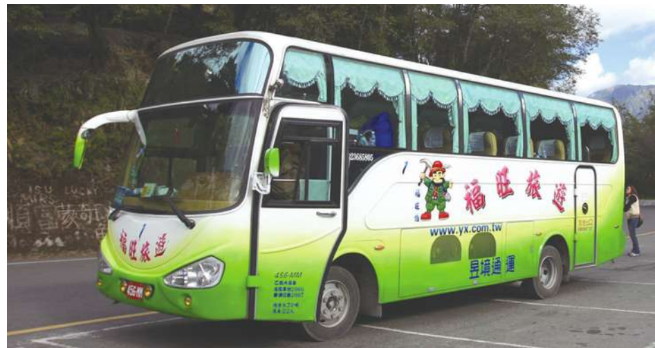
▲ 遊覽車問題多。圖為22座中型巴士。(photo by Matt's Life on Flickr - used under Creative Commons license)

台北市監理所所長呂碧宗說，業者申請時「軸距」是3.98公尺，確實是登記為乙類大客車，是否為改裝車導致行駛坡路上不去，仍需再調查；監理所質疑，業者也可能新車登記，但用舊車上路，將一併查明。