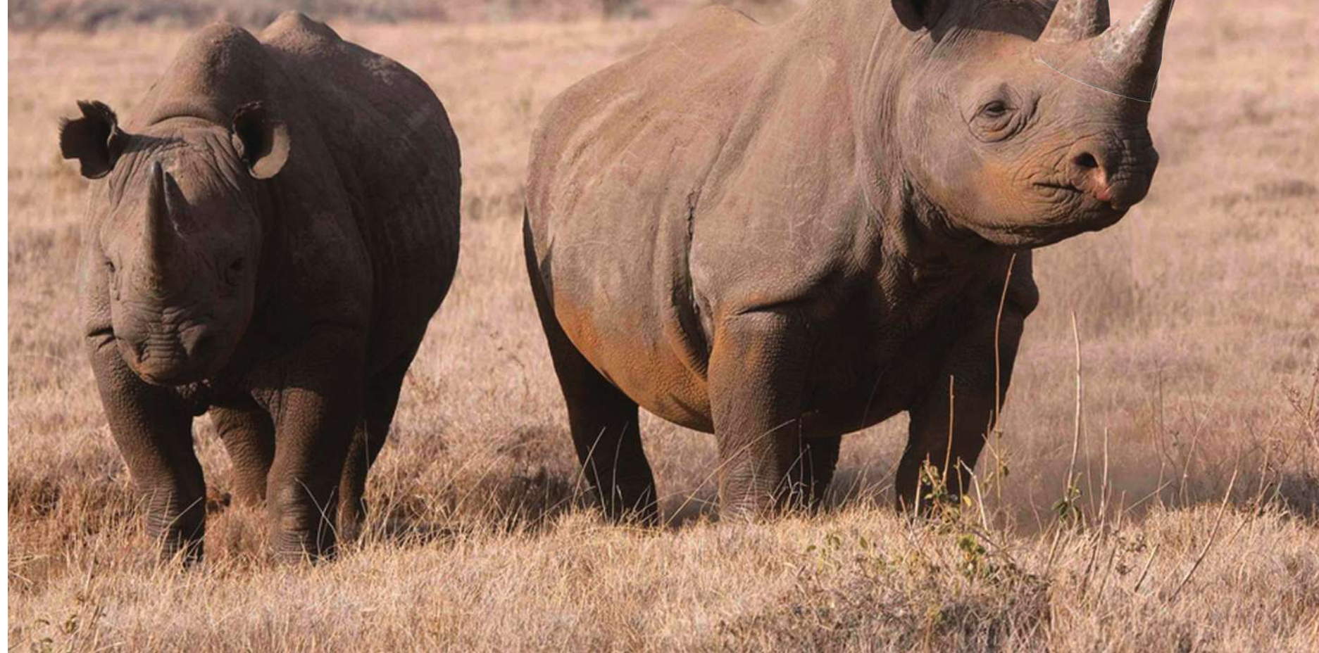
▲ 黑犀牛角在黑市中極受歡迎，1公斤可賣高達13600美元。

英國查爾斯王子與威廉王子近日發起「野生動物聯盟」計畫，首要目標是找出非法盜獵者。