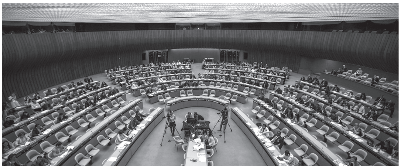
▲聯合國貿易和發展會議(UNCTAD)稍早發佈的數據顯示，台灣整體「投資」數據已在亞洲四小龍中敬陪驥尾，甚至有被東南亞後起國家超越的危機。圖為UNCTAD會議一景。

事實上，UNCTAD這項調查報告，已然將台灣列入為「全世界FDI流入存量排名第三級國家」，與南韓、泰國、越南、蒙古、菲律賓、緬甸、柬埔寨、澳門特區同級；而與排名第一級的中國大陸、香港區和新加坡，乃至第二級的印尼、馬來西亞，相去非常遙遠。這項調查報告所顯示的，不啻是給予台灣最為嚴厲的一記棒喝。