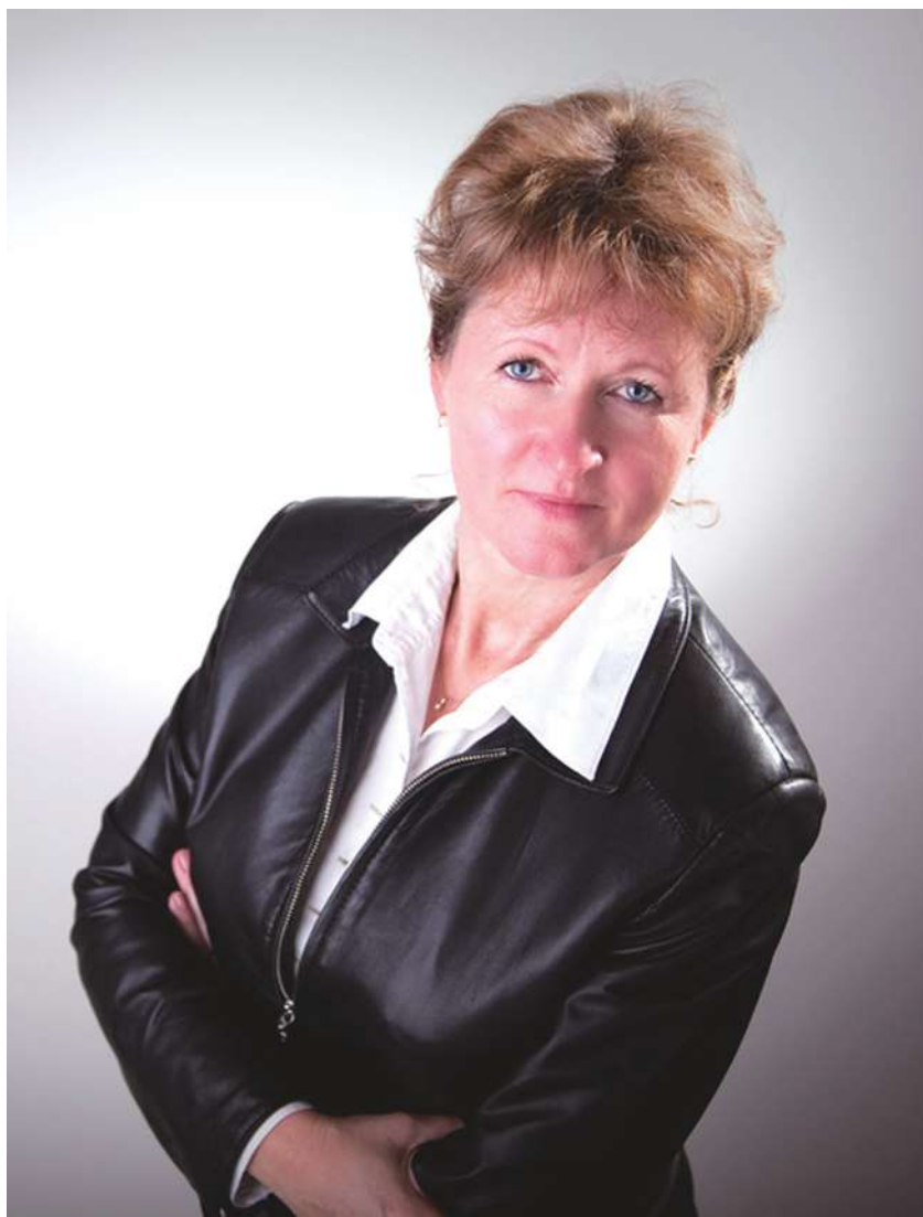
▲女性經理人在企業界所帶來不同觀點，已愈來愈受重視。

公司的價值有非常大的影響力。」此研究呼應了先前英國政府建議，女性董事在大企業的比例，在2015年前應提高到至少25%。 「英國女性董事」的常務董事霍桑說，女性董事因為身份在董事會中較為獨立，比較能分析、質疑公司所做的決定。霍桑進一步表示，通常女性被選入董事會是基於對她能力的考量，而不是她有沒有和其他董事「打高爾夫球」，透過交情而進入董事會。 以色列過去的研究也指出，公司裡的女性董事愈多，董事會愈有可能解雇表現欠佳的執行長。 本次研究發表在《企業財務》期刊。