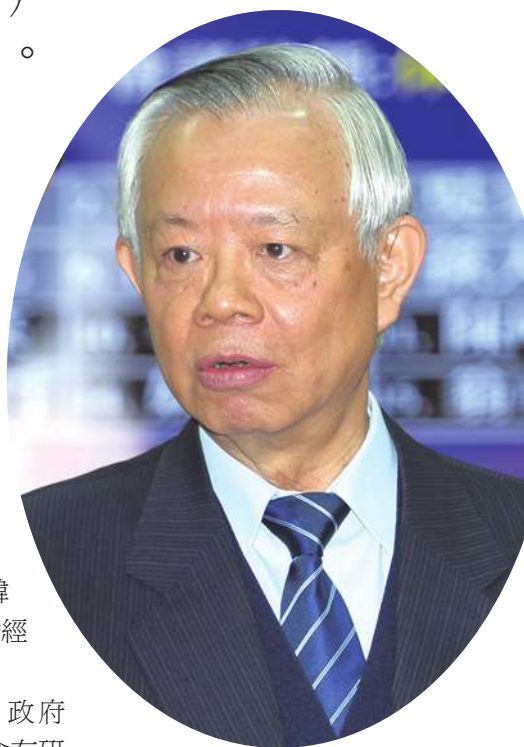
▲央行總裁彭淮南20日接受立法院財委會質詢，強調央行匯率政策目標是動態穩定，並無特定支持立場。

立委許添財指出，央行用匯率（升值）來保護進口商，卻讓他們「兩頭賺」。但彭淮南強調，央行只會穩定調控匯率升貶，沒有特定支持立場。