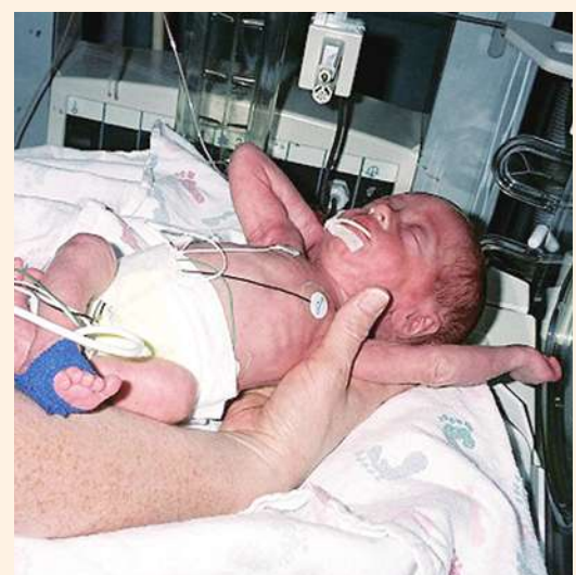
▲ 研究指出，男嬰早產的比例較女嬰為高，且早產男嬰的健康狀況普遍較不理想。

研究人員比較相同懷孕天數出生早產兒的生理狀況，發現女嬰普遍較男嬰健康；倫敦衛生與熱帶醫學院教授袁伊芬恩解釋，這是因為女嬰在子宮內發育的速度較快，包括肺臟及其他器官相對於男嬰較為健全，因此出生後較能抵抗外界感染。另一方面，懷男嬰的孕婦發生「妊娠毒血症」的比例也較懷女嬰者為高，此類病人因懷孕引發高血壓及蛋白尿的症狀，也相對影響胎兒的健康情形。