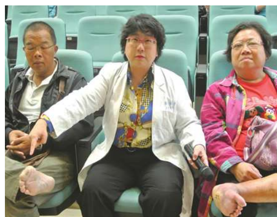
▲ 糖尿病患者傷口久不癒合有新療法。