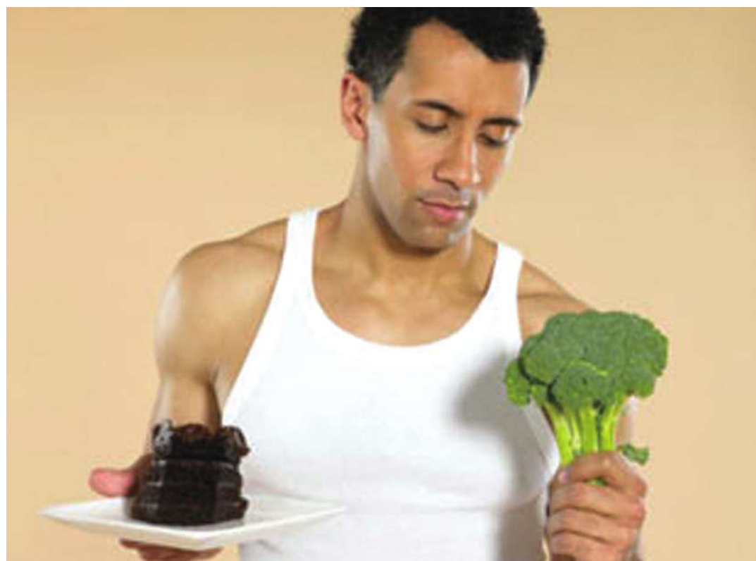
▲ 美國研究指出，攝取低脂肪食物與魚油，可降低攝護腺癌復發率。

本次研究結果刊登在《Cancer Prevention Research》期刊。