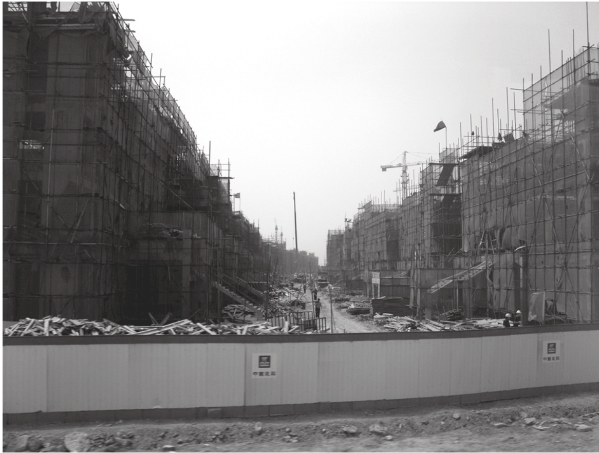
▲ 中國近年來積極推動城鎮化，地方政府卻以城市工商建設為由，強制以低價徵收農民土地，再高價移轉給土地開發商。(Photo by Cory M. Grenier on Flickr - used under Creative Commons License)

目前台灣政府已朝提高徵收價格以市價為準或採以地易地方式來降低民怨。中國政府除了有條件讓集體農地入市外，也可以透過第三方機構協助來提高徵地價格，讓失地農民有充分的資金來支應入城後的龐