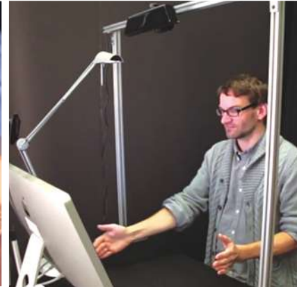
▲▲▲ 麻省理工學院一個名為「觸媒」的團隊，日前公佈一款名為「inFORM」的3D人機介面，此款人機介面可在視訊溝通時，讓對方看到相同物品的3D模型。

延伸閱讀 「觸媒」團隊在YouTube上，以實際操作來模擬「inFORM」人機介面平台的功能。