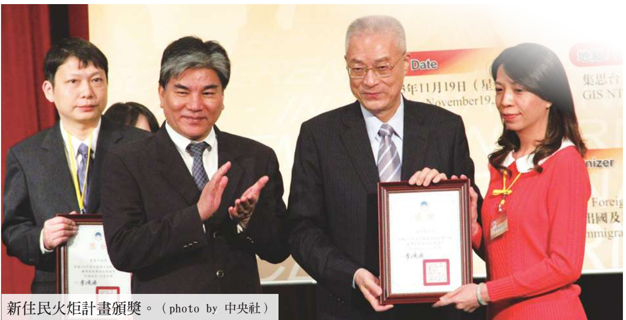
新住民火炬計畫頒獎。