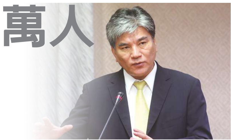
▲內政部長李鴻源表示，全台新住民配偶人數已經突破48萬人，相關輔導計畫刻不容緩。

更全面地去關心新住民，包括增進新住民之子的母語學習機會、舉辦多元文化美食競賽、加強新住民輔導志工的培訓等。另外，透過教育部編制下的「新住民文教輔導科」，幫助新住民適應新生活。並且透過讓新住民之子學習母語(如印尼語、泰語、越南語等)，使他們成為未來台灣國際化的推手。