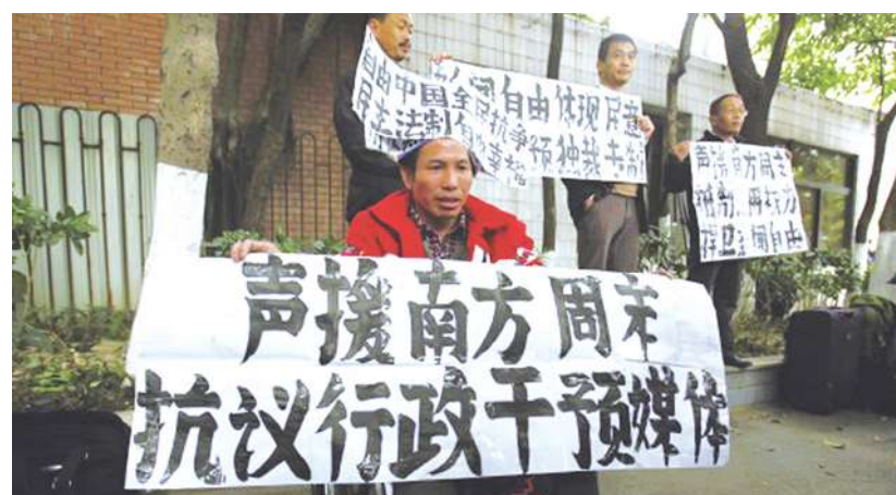
▼《南方週末》2013「新年獻詞」事件，得到許多中國民眾聲援。

件從討論轉為政治罵戰。因此，「自媒體」繁榮一方面讓網友對事件本身有更清晰、全面的了解，另一方面也暴露因立場不同所產生的偏見和對立。