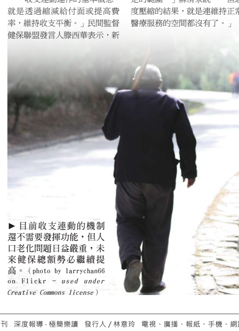
▶目前收支連動的機制還不需要發揮功能，但人口老化問題日益嚴重，未來健保總額勢必繼續提高。

「收支連動運作的基本概念，就是透過縮減給付面或提高費率，維持收支平衡。」民間監督健保聯盟發言人滕西華表示，新