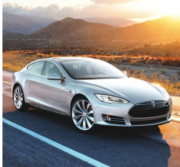
▲ 特斯拉大受歡迎的 Model S 英姿。