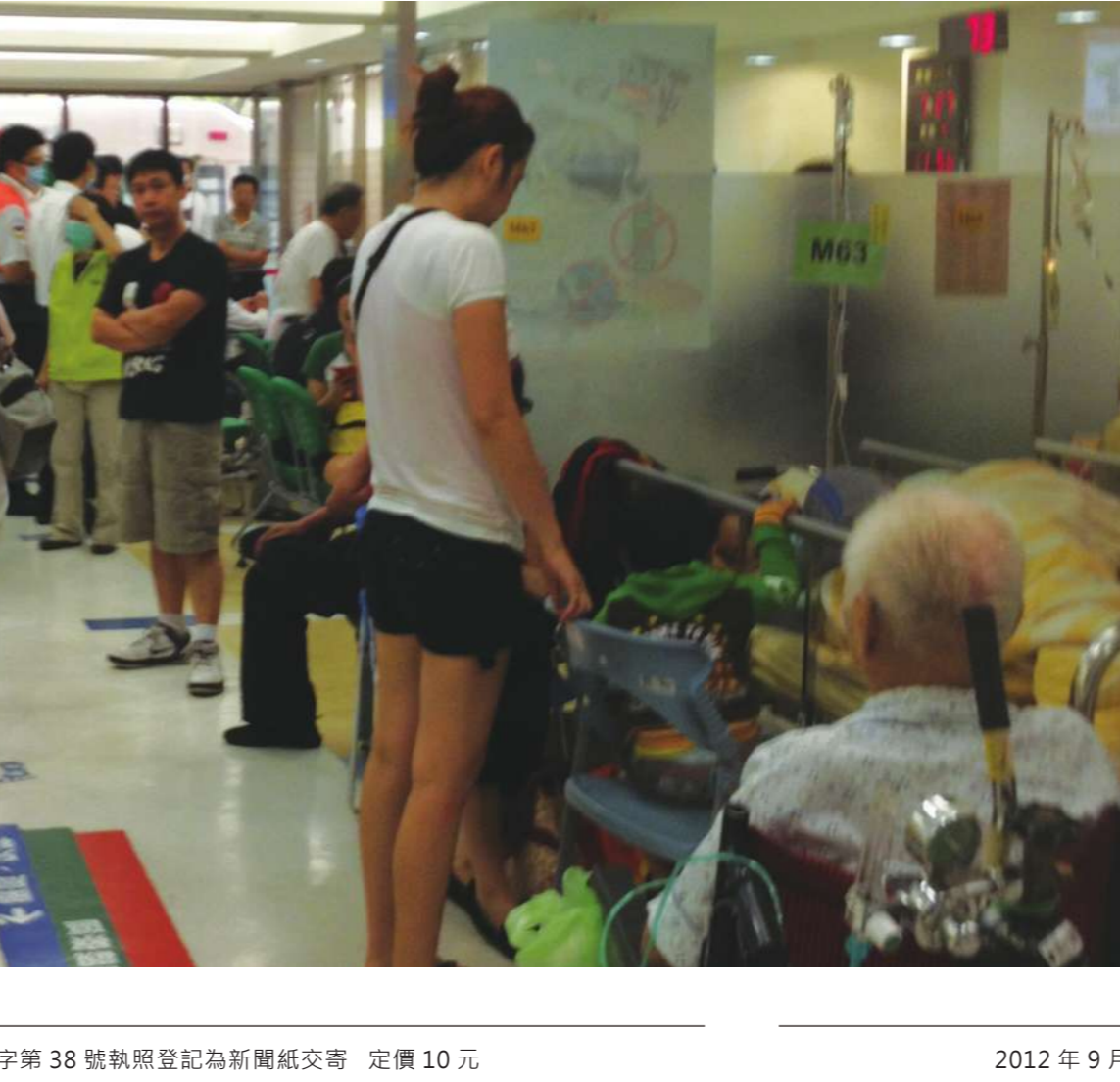
▶目前收支連動的機制還不需要發揮功能，但人口老化問題日益嚴重，未來健保總額勢必繼續提高。