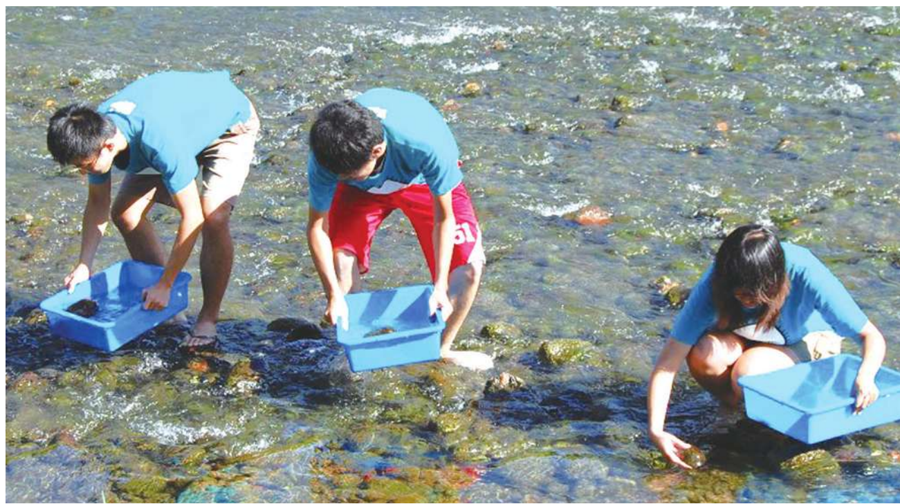
▲ 東吳大學的「臨溪路 70 號」巡守隊，透過環境教育的方式讓民眾認識外雙溪。

水質保護處科長陳龍珠說，全國已有 356 個河川巡守隊達 9652 人，巡守隊各具特色，並與社區、學校結合。