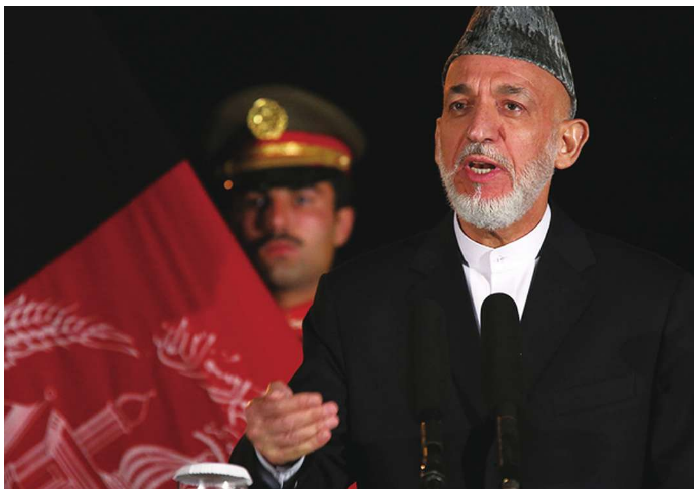
▲ 阿富汗總統卡札伊在國民會議前夕，表態拒絕美阿雙邊安全協議。(photo by U.S Embassy Kabul Afghanistan on flickr — used under Creative Commons license)

目前北約或美國駐阿大使館都不願對目前為止的談判表達任何評論，但一名不願透露姓名的西方外交官告訴《路透社》，「現在是一個非常緊張的時刻！」