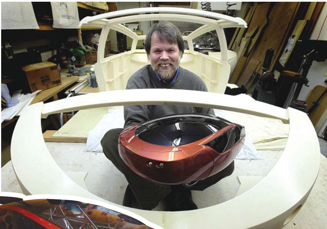
▲Urbee 3D 列印車與模型。

Urbee 2 要做的當然只是要橫越美國，不間斷行駛 42 小時，首先需要對付的是氣候與路況，