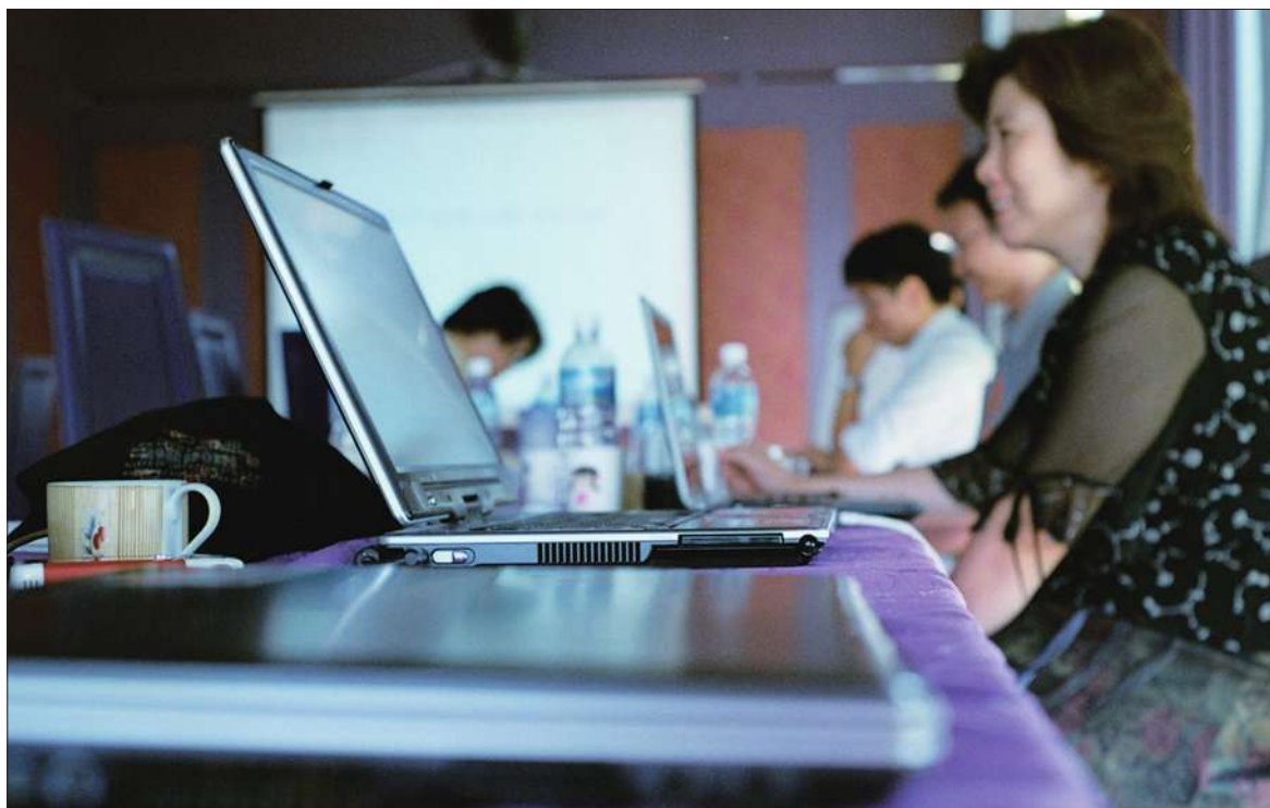
▲濟南市教育局政務微博管理辦法（試行）的通知，希望各校利用微博的平台與學生、家長在網上溝通，（photo by darkensiva~ on Flickr - used under Creative Commons license）

文件，希望各校利用微博的平台與學生、家長在網上溝通，形成有特色的「管理機制」。擁有53萬人口的長清區從本月開始，區內120多所公立學校校長和幼稚園園長，在未來8個月內每天都要上網「刷」（發佈）微博。 《政務微博管理辦法》內容要求校長或園長以學校名義建立實名認證的新浪微博帳號，並組成學校的微博小組，所有員工都要上微博管理的相關訓練。微博的內容要包括「政務資訊」、「辦事指南」、「教學感悟」、「服務舉措」和「動態新聞」等資訊，每週最少5篇原創內容。 校長除了建立微博帳號外，每天必須登錄查看有無學生或家長留言，並固定每週發布有關學校管理的訊息。長清區的教務局則將組織專門小組，對各校的微博管理及發言內容進行監督，將監督結果納入各校的考核績效。