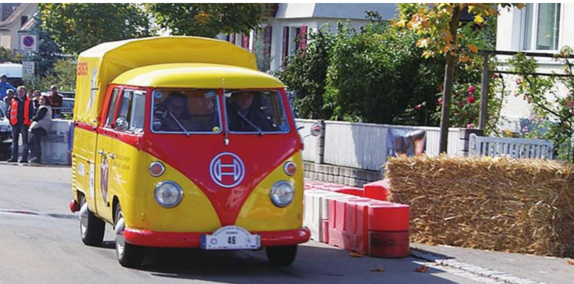
▲ 在國外的 BOSCH 行動維修車。

目前博世在全台已有 39 個服務據點，規模較小的有 4 家，完善的 BOSCH Car Service 專業維修站則有 20 家，針對柴油車修設立的柴油專業服務中心、柴油專業服務站有 15 家。為進一步佈局售後維修市場，