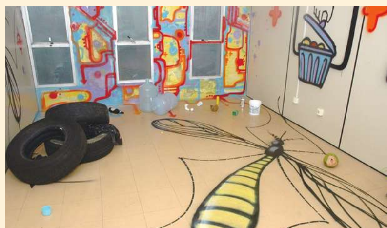
▲ 南部登革熱疫情延燒，疾管署醫師羅一鈞提醒民眾，必須小心疫情向北擴散。

「今年東南亞各地區的登革熱疫情都較往年嚴重。」疾管署副署長莊人祥提醒，民眾到中國廣東、馬來西亞、新加坡等，登革熱疫情目前仍在流行高點的地區出差、旅遊，必須特別注意防蚊措施。