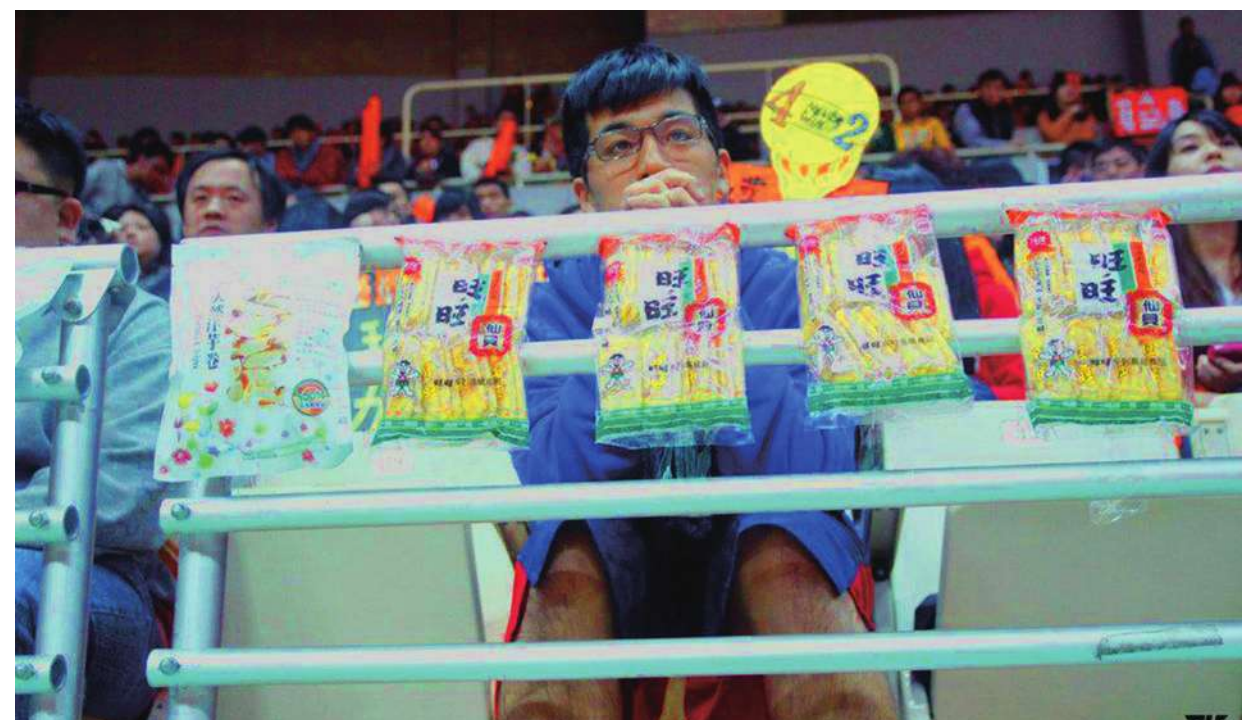
▲ 第 11 季 SBL 超級籃球聯賽上週末在台中台灣體育大學體育館點燃戰火，球迷朋友抱怨館方的禁食令。

廖景雲說，這個規定從 91 年實施到現在，館場經常與 SBL 主辦單位和球迷溝通，讓大家了解規則和原因，多年來鮮少接獲台北民眾的申訴抱怨。