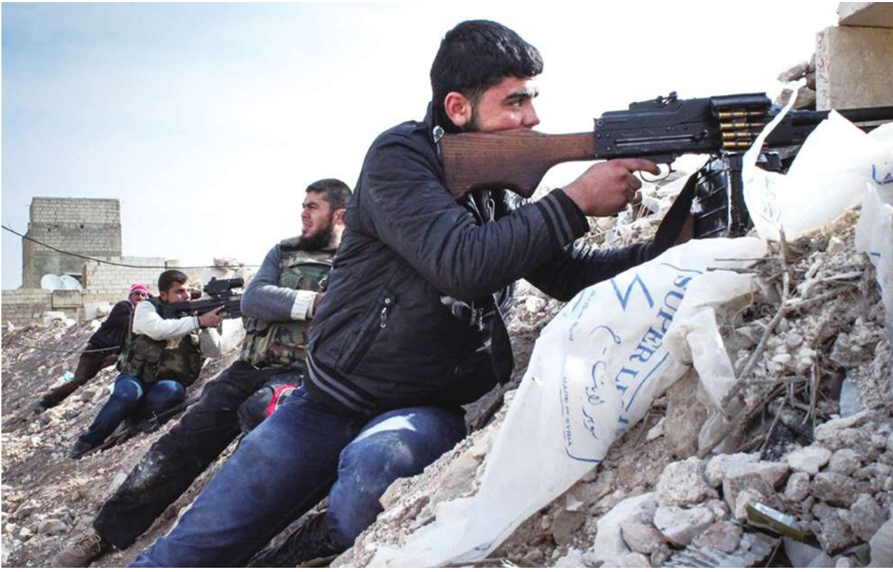
▲「敘利亞自由軍」民兵，正與阿薩德政府軍交戰。(Photo by Freedomhouse on Flickr - used under Creative Commons license)

敘利亞全國聯盟也開出與會條件：確保救援團體能進入遭圍困的地區、釋放政治犯，及所有政治會議都應有效促使政治轉型。敘利亞全國聯盟總部設在土耳其，是包括美國、英國、法國和阿拉伯國家聯盟在內的國際勢力所承認的唯一敘利亞人民合法代表。全國聯盟成員西夏克利說：「我們希望日內瓦會議能達成讓阿薩德下台的結局。」但這項提議並不被目前的敘利亞政府所接受。敘利亞境內的反抗軍過去曾指出，除非日內瓦會議促使總統阿薩德下台，否則他們反對日內瓦的和平進程，還揚言將參加日內瓦會議的人冠上「叛國」的罪名。敘利亞境內的反抗軍主要分為主流的「敘利亞自由軍」和與蓋達組織有關聯的武裝份子。考量反抗軍的反對，敘利亞全國聯盟已經指派一個委員會與敘利亞境內、境外的革命力量舉行會談，說明其對「第二次日內瓦會議」的立場。敘利亞全國聯盟一名成員表示：「我們不能在未獲得派別廣泛支持的情況下，前往日內瓦。」敘利亞全國聯盟將派遣 2 組使節團，分別與敘利亞自由軍及其它民間團體會談，討論參加日內瓦會議事宜。