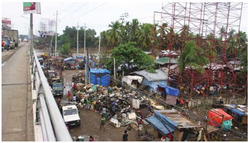
▲海燕襲菲，當地樹倒屋垮，損失慘重。

災損估計清楚，紐國將提供更進一步援助。澳洲則捐助約36萬美元，也提供睡袋、毯子、蚊帳等賑災物資。 我外交部也提撥20萬美元的人道救助金，協助菲國重整家園。有不少網友表示，台灣沒有受到颱風侵襲可喜可賀，但也有人說台灣捐助菲國是「熱臉貼冷屁股」，菲國既然不為「廣大興號」一事道歉，政府不應送錢過去；還有網民說，「菲國不好好建設自己國家，造成的損失應自己承擔。」甚至還有網民以嘲諷語氣說台灣飽受菲國欺侮，「沒必要資助」。