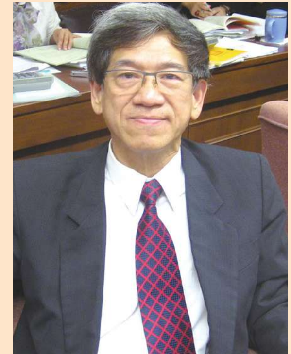
▲1日新上任的工程會主委陳希舜，曾擔任台科大校長，10月25日接任政務委員，身兼兩種身分。(photo by 羅佳旻/台灣醒報)