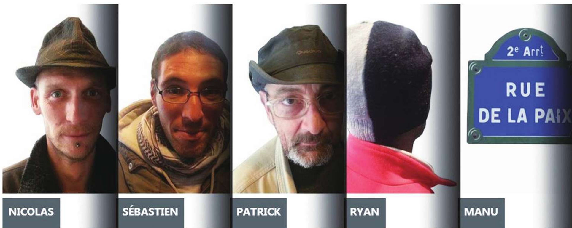
▲五位法國「來自街頭的推特 (Tweets 2 Rue)」的實況遊民們，其中 2 人沒有露臉。

根據最近的民調，儘管有近 4 分之 3 的法國人認為，嫖客是廢娼法案能否通過的重要一環，但只有少數人贊成罰款。