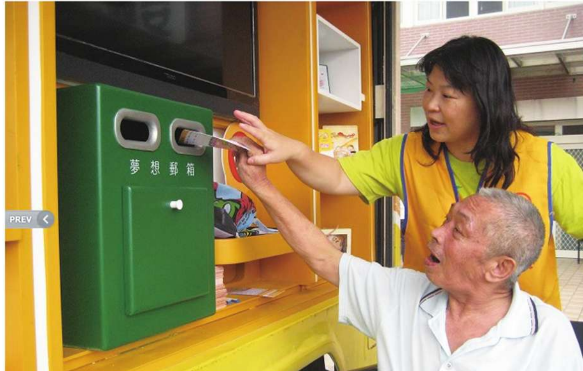
▶ 立委建議中華郵政能朝「銀髮郵業」發展，改善郵務虧損。