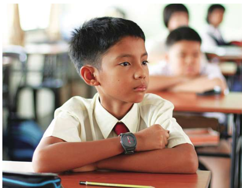
▲研究指出，家長對孩子要求太高，也可能對孩子造成太大壓力。