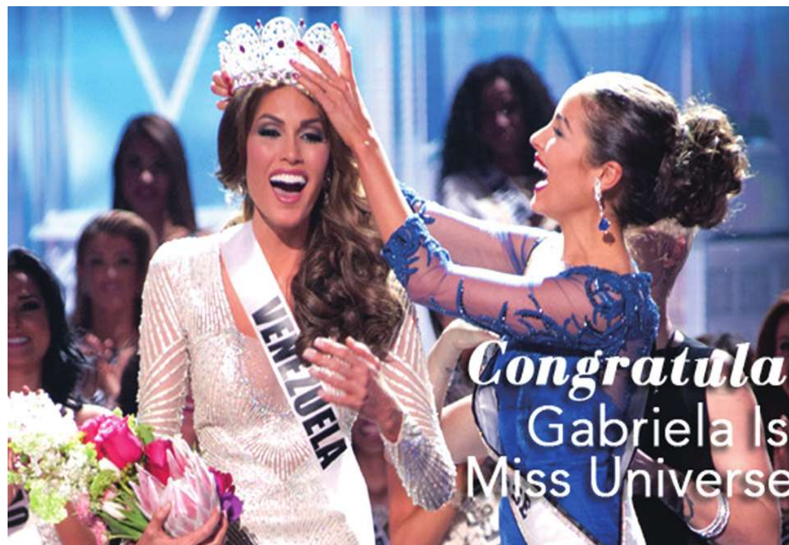
▲ 2013 年環球小姐由委內瑞拉佳麗艾勒奪后冠。

重外表，將精力投注在美容與整形，已曲解了美的意義，一名委內瑞拉知名部落客就說，「委內瑞拉女性很美且很有智慧，卻把整型和減重視為風潮，奉選美比賽為人生目標，女性的價值觀已經扭曲。」