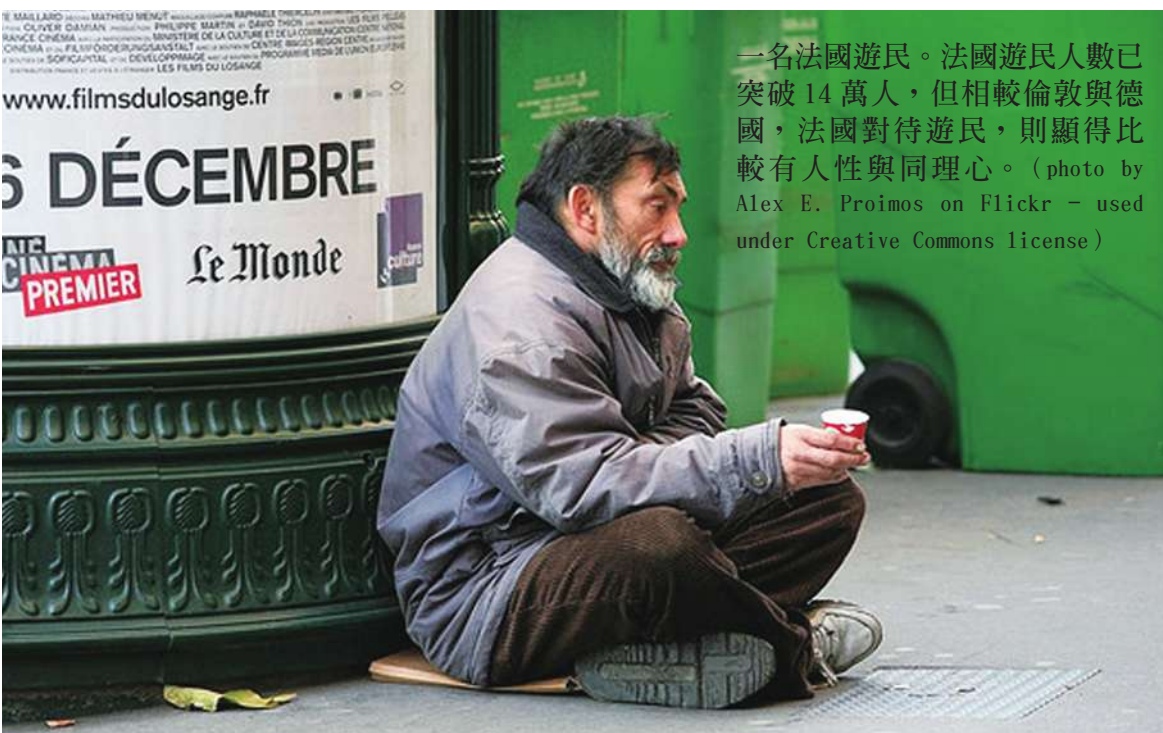
一名法國遊民。法國遊民人數已突破 14 萬人，但相較倫敦與德國，法國對待遊民，則顯得比較有人性與同理心。

【本報記者邱慕天、莊瑞萌綜合報導】鑑於法國有多達 14 萬的街友需要關注，法國社福團體最近推出推特遊民實況活動，提供 5 位遊民免費智慧型手機發表推特流浪日記，讓大眾可以透過即時追蹤和互動拉近距離。計畫活動於 10 月中旬上線後，雖然有人批評，光是給遊民手機上網「取暖」不如直接給予他們溫飽，但許多網友則因為這樣有機會貼近遊民生