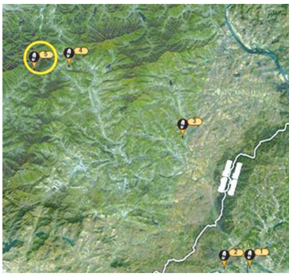
▲ 美國一基督教團體施放《聖經》氣球到北韓，圖中 1 為施放地點，標示 5 則為載有《聖經》氣球的降落地點。去年該團體已施放 5 萬顆氣球到北韓。

【本報記者莊瑞萌綜合報導】美國一個基督教團體「首爾美國」，過去 1 年向北韓施放了 5 萬顆掛有《聖經》等文宣的空飄氣球。根據該團體的牧師表示，在北韓從事基督教活動屬非法行為，但仍有 10 萬北韓人民選擇信基督教，而且當地基督徒對《聖經》的渴望與日漸增，該團體未來還將成立電台向北韓廣播「傳話」，撫慰渴望心靈自由的人心。