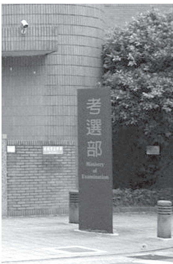
▲ 立委質疑本屆公務員人員傑出貢獻個人獎大部分皆為薦任9職等以上的高階主管獲得，基層公務員勤奮工作，卻都讓主管「好處全拿」。