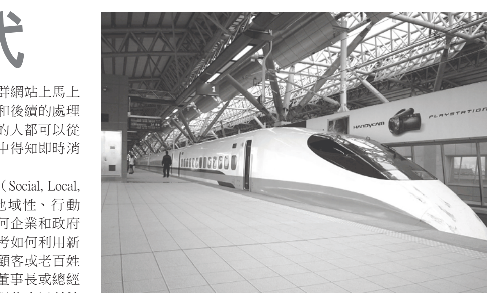
▲ 高速鐵路雖是高科技，但高鐵在溝通方面仍是使用主管口頭下令的低科技，並沒有善用網路高科技的即時溝通的特性。

可以在公司的社群網站上馬上公布故障的消息和後續的處理程序，這樣所有的人都可以從高鐵的社群網站中得知即時消息。 在這SoLoMo (Social, Local, Mobile, 社群、地域性、行動性)的時代，任何企業和政府機關都要好好思考如何利用新的資訊科技來和顧客或老百姓溝通，既然要當董事長或總經理，就好好學習現代資訊科技的溝通工具吧！