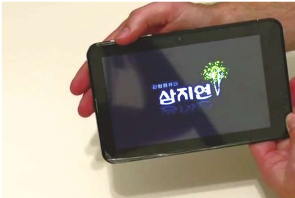
▲北韓推出國產平板電腦「三池淵」，受外界肯定。(網路截圖)

北韓的《North Korea Tech》網站也刊登了對「三池淵」的評測。分析中強調，「三池淵」啟動應用程式時非常流暢，攝像頭的速度也很快，「在玩《憤怒的小鳥》之類的遊戲時，沒有出現明顯停滯的現象。」