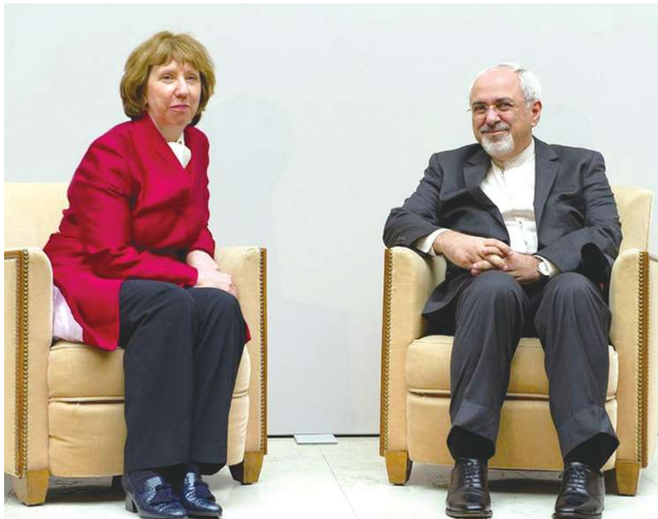
▲ 歐盟外交政策首長艾希頓，與伊朗外交部長查瑞夫表示，在談判過程獲得重大進展。