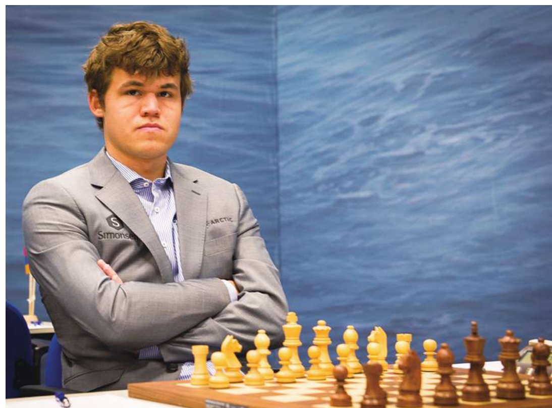
▲ 22 歲的挪威棋手卡爾森，在西洋棋 ELO 等級累計積分達 2872，為西洋棋史上最高分數。(Photo by Pics Frans Peeters on Flickr - used under Creative Commons License)

【本報記者劉運綜合報導】今年西洋棋世界冠軍的頭銜恐將易主！「最花腦力的比賽」——世界西洋棋賽在上週末展開，專家看好有「西洋棋哈利波特」之稱的挪威棋手卡爾森，有擊敗衛冕印度棋王安南德的可能。雙方的第一場比賽以和局收場，未來 3 週將繼續進行 12 場比賽。