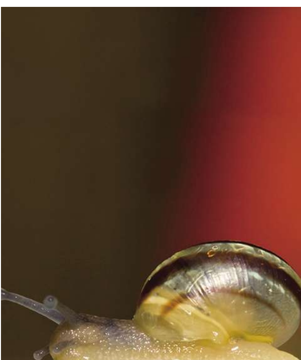
▲ 英國利用蝸牛實驗發現，當動物在身處多重壓力下，容易阻斷記憶，造成過去學習的經驗無法應用。

【本報記者莊瑞萌綜合報導】英國艾克斯特大學研究者以蝸牛實驗後發現，被訓練在惡劣環境下求生的蝸牛，如果必須同時應付多起突發事件，可能會遺忘之前學到的經驗，因此，研究者認為，如果人類在同一時間經歷到許多不同壓力，也可能會對記憶造成影響。