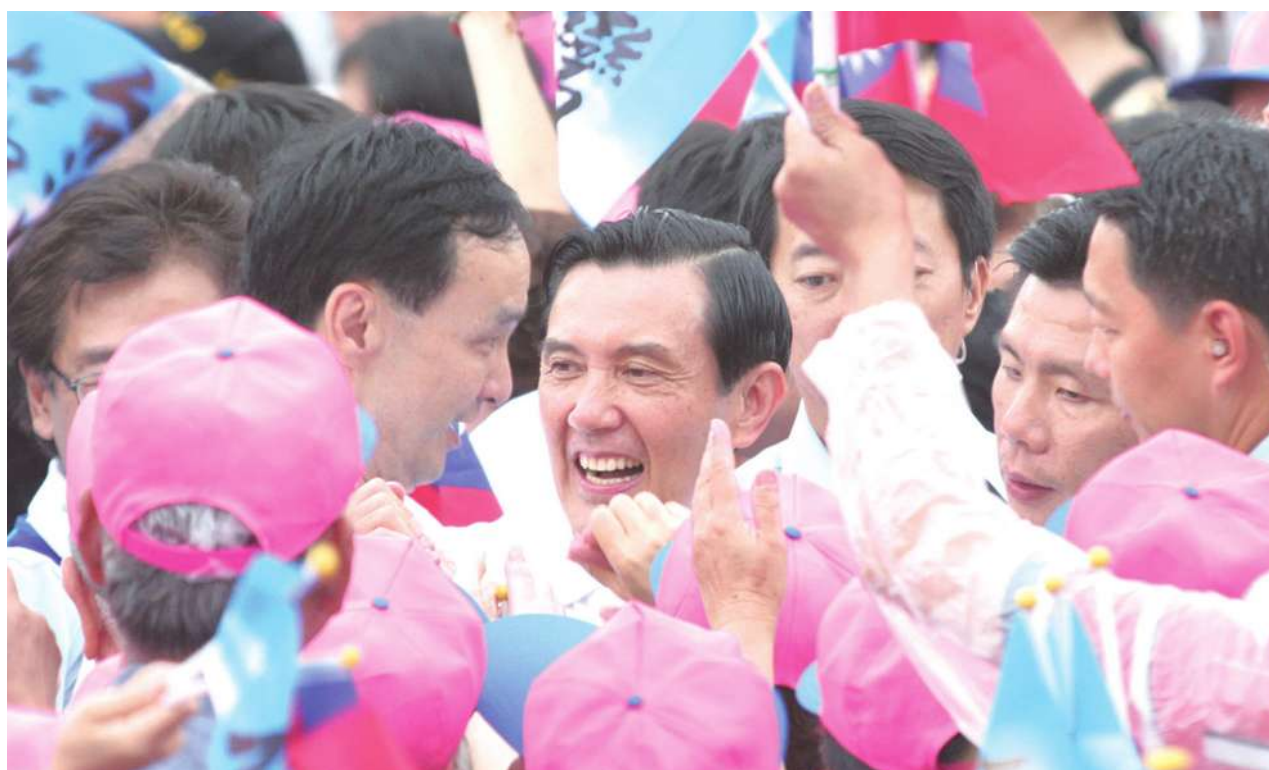
▲ 國民黨 10 日將召開第 19 次全代會，屆時場外抗議及場內角力將是各方矚目焦點。

「929 包圍馬英九行動」將追著全代會跑，希望當天「萬鞋齊發」；國民黨基層與中央則在場內角力，