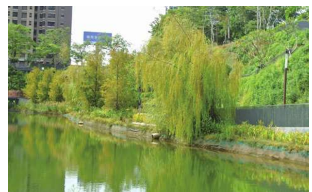
▲台中市正式宣告秋紅谷景觀生態公園，即日起全面禁菸。