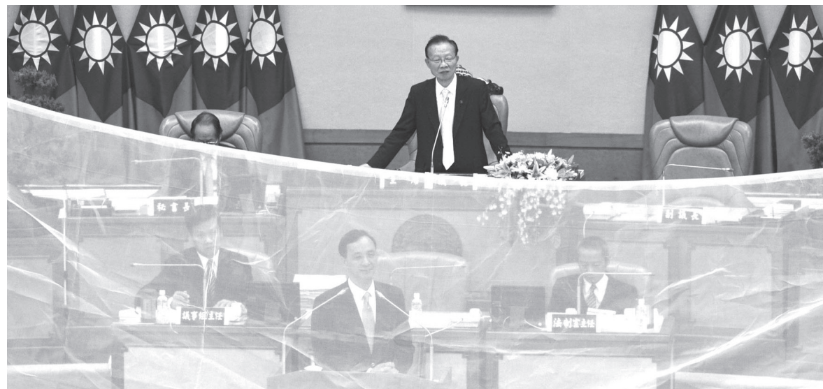
▲一夜之間，扔鞋成為台灣民眾抗議當權者的一項行為藝術。不稱職的大小官員都是扔鞋的對象。庸官酷吏，所到之處，鞋如雨下，即便各地警方購置防鞋網，亦防不勝防。