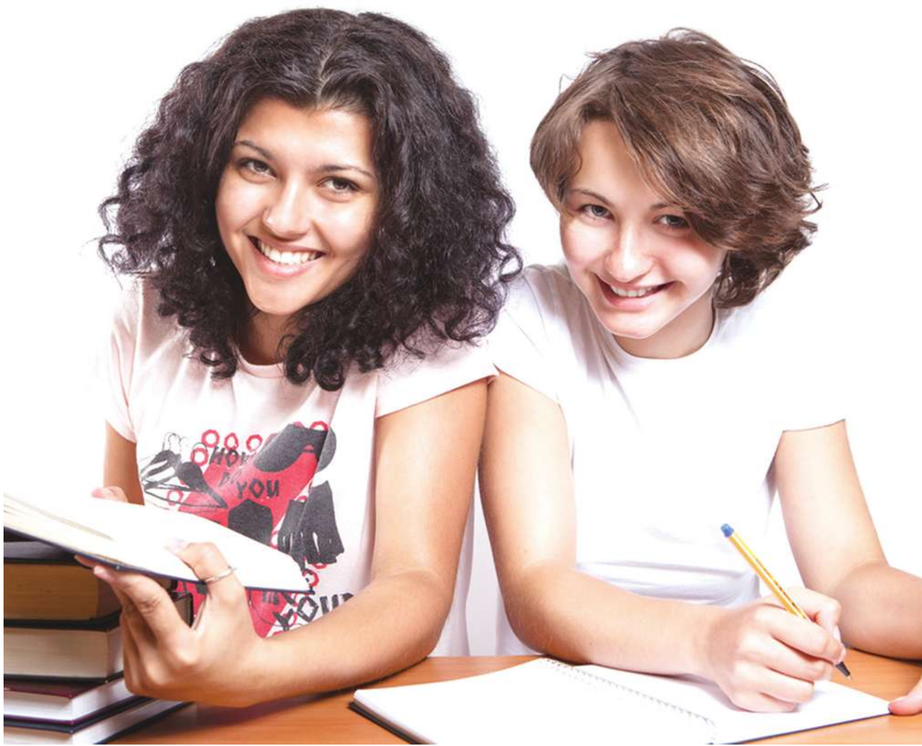
▲ 調查發現，除了課業外，大學生在校內還必須學到許多生活技能。

研究顯示，多數人在 4 個月後才感覺適應新的住所，5 個月後才能確定哪些人是自己的朋友。另外，大學生活最大的挑戰之一，是學習與陌生人一起生活、結交新朋友，及與來自不同背景的人交往。