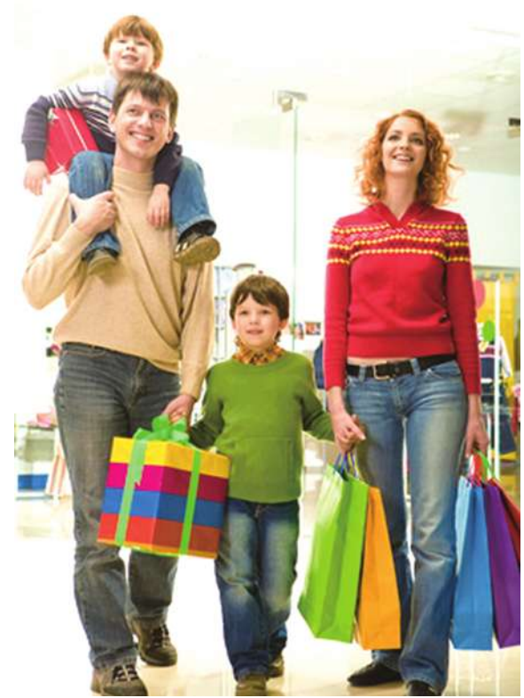
▲ 一對結婚夫妻在賣場購物。美國民調發現，結婚後的美國人，平均支出的金額高出單身者許多。

尤研究中心 2010 年的報告也指出，美國經濟不景氣，也是造成結婚年齡一直攀高的原因之一。