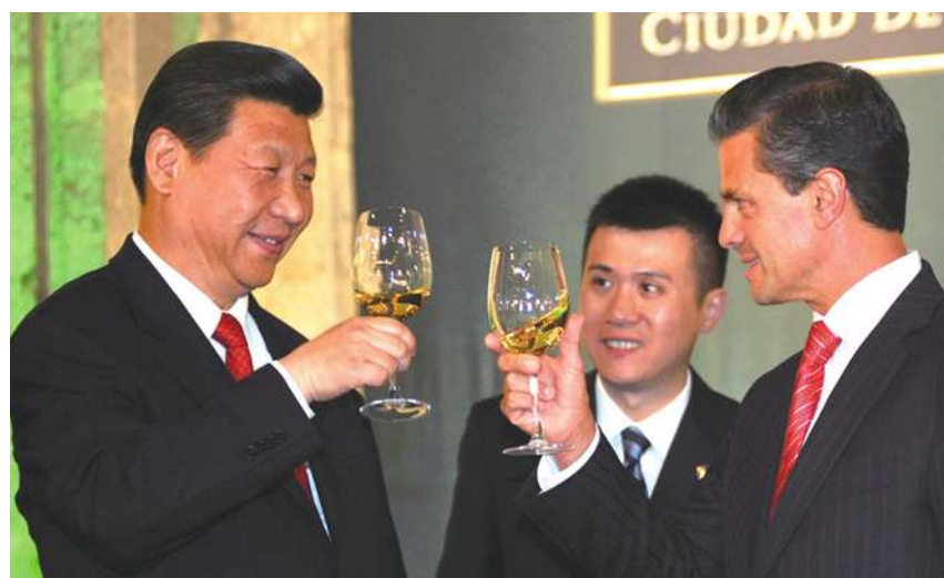
▲ 習近平表示，本屆三中全會將深化體制改革。

另外，目前中國大陸的國企已經成為改革標的，國企改革的尺度應會加大。除了少數涉及國家安全、國防、國民經濟命脈的國營企業外，其他將會朝更多元的方式發展。寇建文所長指出：「此次改革