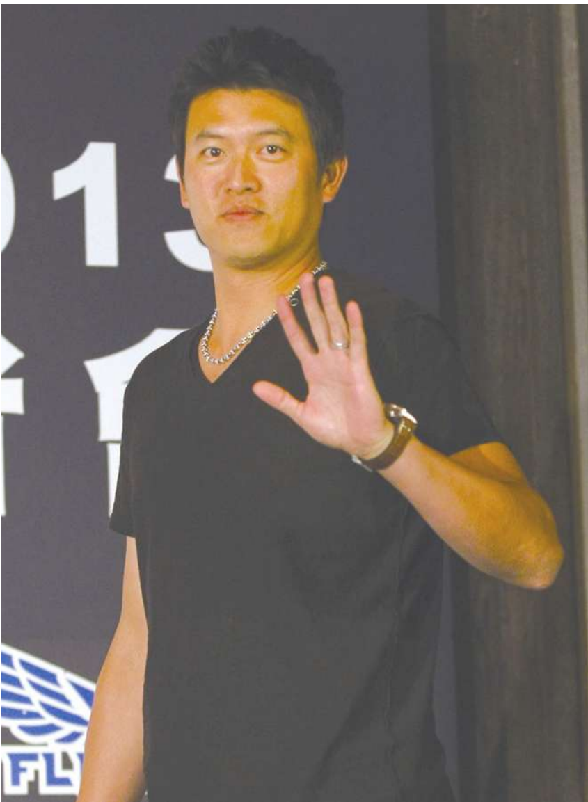
▲ 建仔4日清晨帶著全家大小回台，剛下飛機就召開記者會。