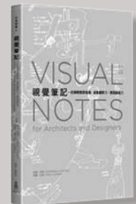
木馬文化 訂價：300 元

確實依照眼睛所見的樣貌畫出形狀，不要讓預想的形式或象徵性圖案干擾你。愛德華博士形容此舉為「關閉理性左腦」。