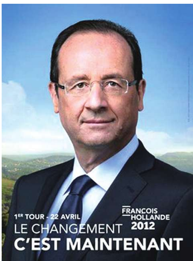
▲法國總統歐蘭德去年競選時以「改變，就是現在！」作為競選主軸，在如今的民調看來格外諷刺。