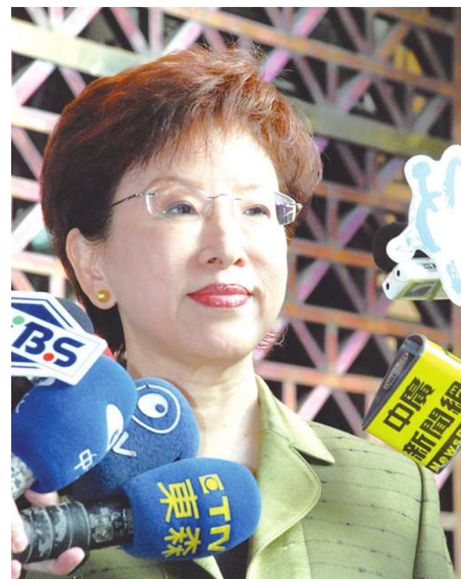
▲ 國民黨副主席洪秀柱將主持第 19 次全代會第 2 次大會，討論國民黨政策綱領，洪表示目前尚未收到黨內有關全代會的任何異議。(photo by 台灣醒報資料照片)

國民黨副主席洪秀柱受訪時指出，目前並未接獲來自黨內有關政策綱領草案，以及恢復王金平黨籍的意見，一切必須等到 10 日全代會現場，再見機行事。