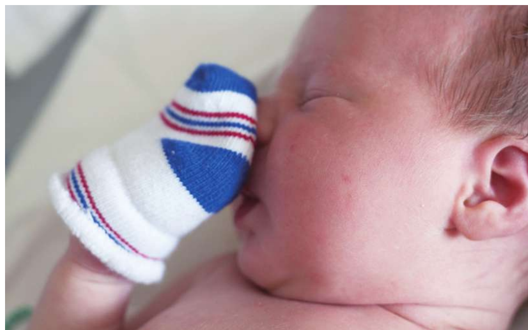
▲芬蘭利用《一閃一閃小星星》歌曲研究發現，胎兒記憶的時間，可以長達出生後 4 個月以上。