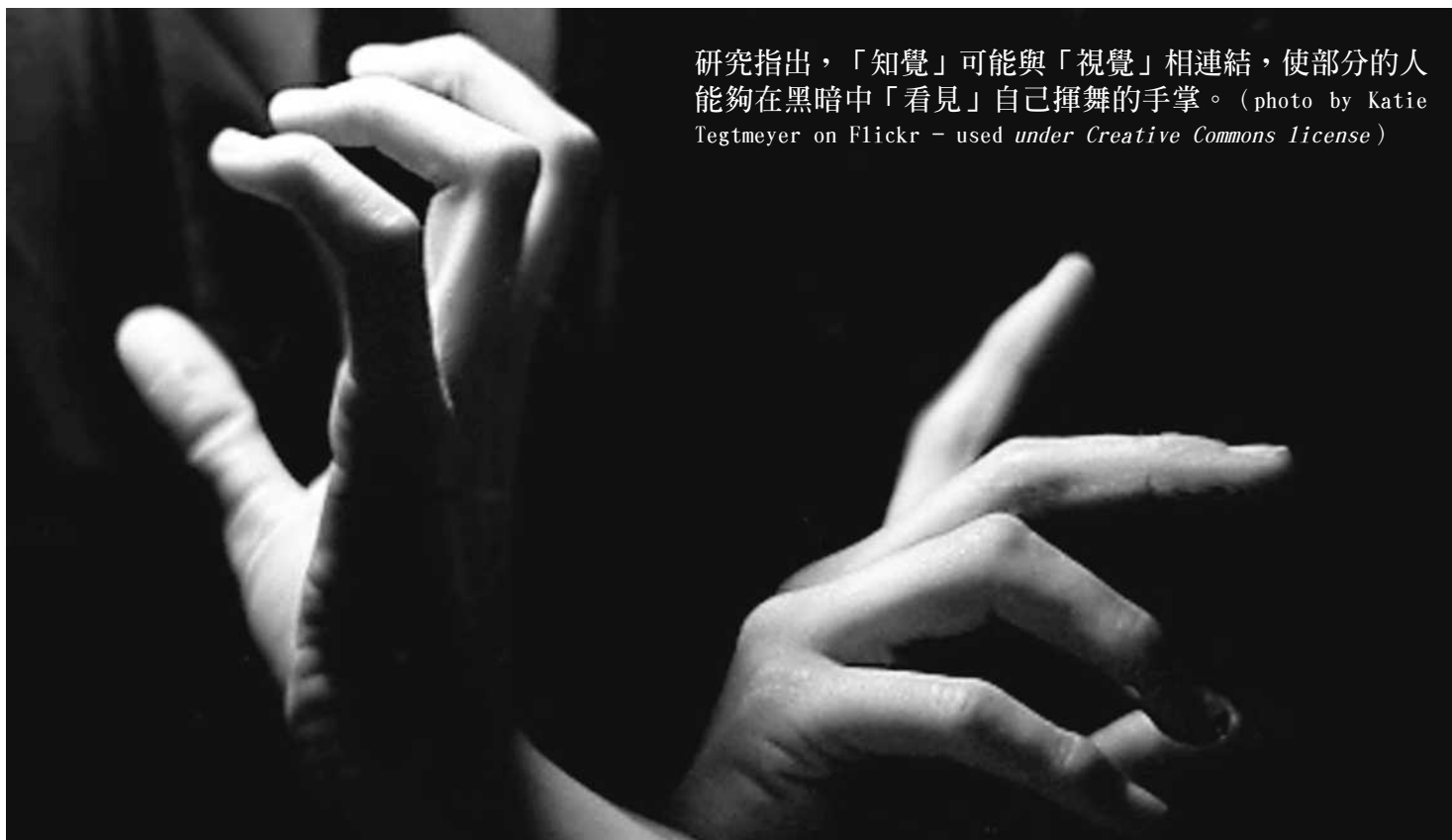
研究指出，「知覺」可能與「視覺」相連結，使部分的人能夠在黑暗中「看見」自己揮舞的手掌。